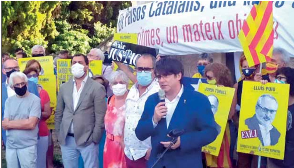
Els eurodiputats Carles Puigdemont, Clara Ponsatí i Toni Comín han estat aquesta setmana a la Catalunya del Nord ■ Ò.P.J.

Pendent del pronunciament del tribunal d'apel·lació belga, en tot cas la sentència de Puig obre perspectives del tot noves en un altre procediment en ple debat, la tramitació del suplicatori dels eurodiputats Carles Puigdemont, Toni Comín i Clara Ponsatí. Fins ara, eren conscients que seria molt difícil que no prosperés, ja que tot just tenien el suport d'uns 150 escons de 751, i donaven per fet que els grups popular i socialista hi votarien a favor, amb la qual cosa gairebé es conformaven amb un “resul-