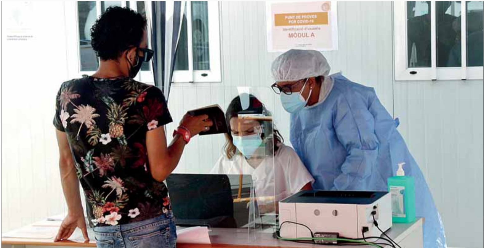
Personal sanitari atenent un home, ahir al matí, a la porta d'un mòdul del CAP Sant Pere, per fer-li la prova PCR

PETICIÓ • Demana a Sánchez la gestió dels fons d'ajuda de la UE