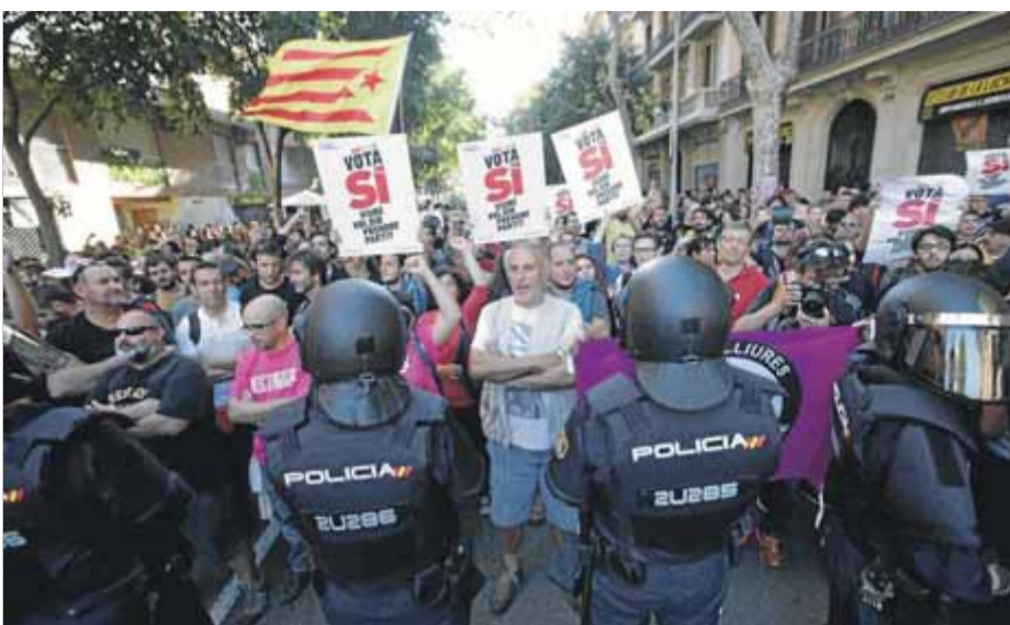
Setge policial a la seu de la CUP, amb cartells pel referèndum, el 2017