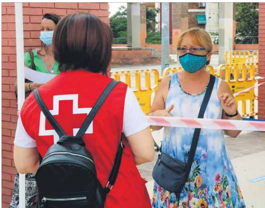
Una voluntària de Creu Roja atén una veïna de Cornellà de Llobregat que vol fer-se una prova PCR

Les universitats es bolquen en la docència híbrida