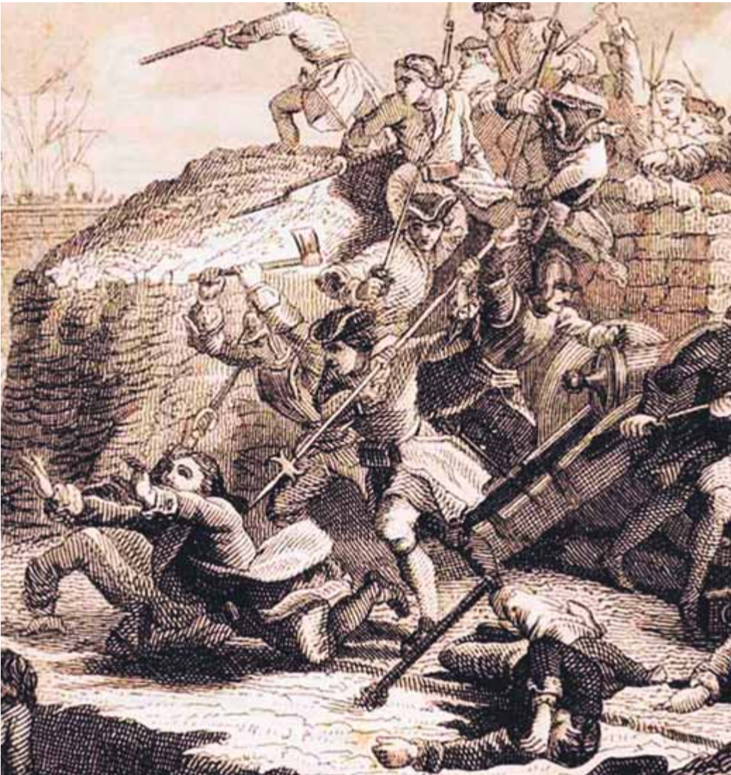
Un gravat que representa la derrota del 1714