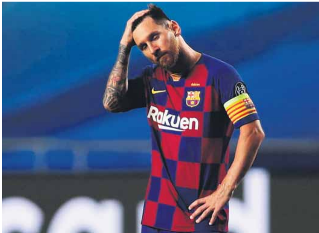
Leo Messi, en un moment del partit de la desfeta contra el Bayern de Munic

El crac argentí s'acull a la clàusula que li permet deixar el club a final de cada temporada