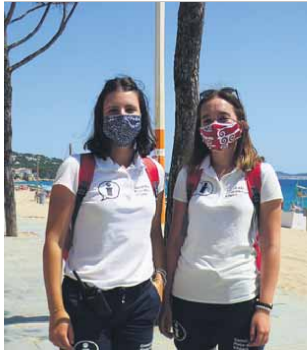
L'Arianna i l'Ariadna garanteixen les mesures ■ N.S.

Sobretot els caps de setmana, estan molt atapeïdes. A les cales la nostra feina també és moure la gent per mantenir la distància de seguretat. Els demanem si poden anar més enrere on hi hagi espai. També hi controlem l'aforament. A la platja Gran, garantim les distàncies perquè mai està ple. Però a les cales, els diumenges, sí que cap al