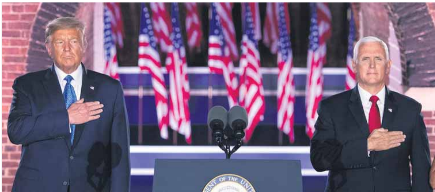
Donald Trump i Mike Pence, escoltant l'himne nord-americà en l'obertura de la sessió d'ahir de la convenció republicana

Argimon adverteix que l'aïllament no es compleix en el 45% dels casos Els majors de sis anys hauran de dur mascareta a l'aula a molts centres El govern descarta demanar l'estat d'alarma i militars per fer de rastrejadors