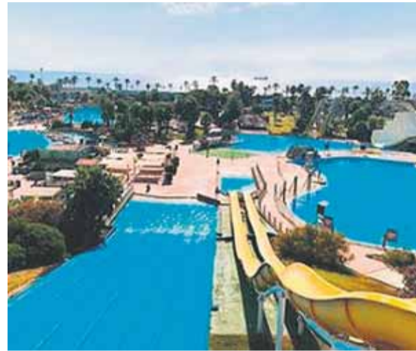
Les piscines del parc de Tarragona ■ AQUOPOLIS

El menor, que no sabia nedar, era en una zona de bany quan, sense que s'adonessin els seus familiars, va anar a una zona més fonda i perillosa per a