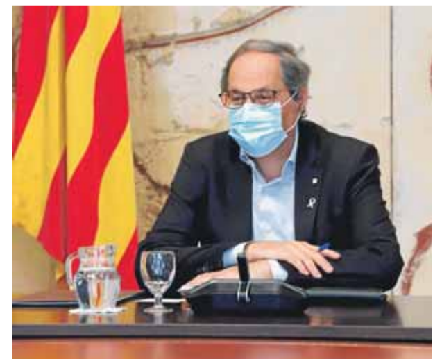
El president de la Generalitat, Quim Torra, ahir, durant la reunió del consell executiu

s'havia de debatre al plenari del juliol però que finalment es va decidir retirar a causa de la situació sanitària derivada de la pandèmia de coronavirus. Si la iniciativa prospera, podria comportar la retirada del bust de Joan Carles I que encara hi ha al saló de plens de la Paeria, entre altres honors. ■