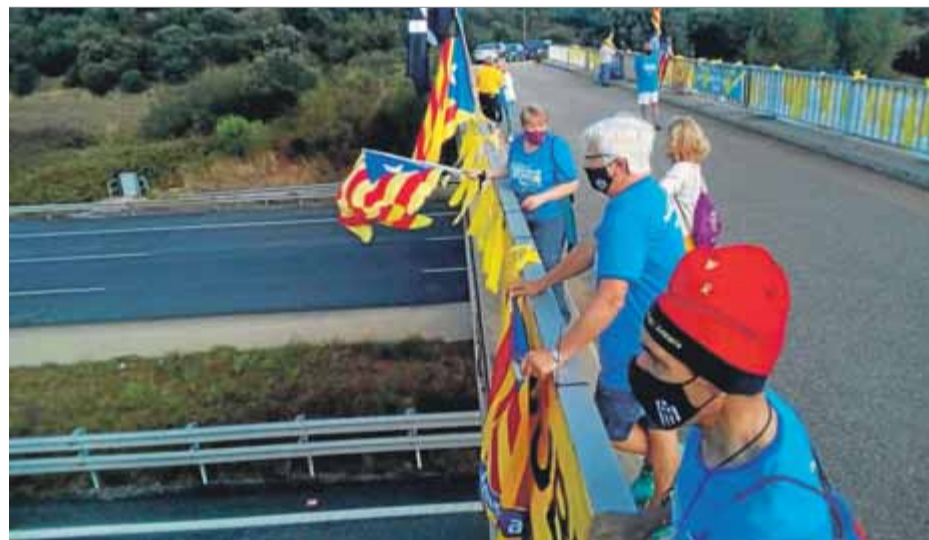
Un dels ponts des d'on les territorials de l'ANC van reivindicar la República