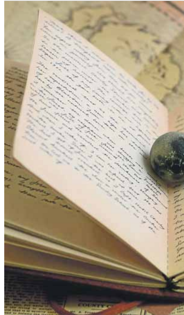
L'autor parteix del dietari d'un soldat prussià que va participar en la Primera Guerra Carlina

Mentre esmorzem, i vist que haurem de conviure i entendre'ns, fixem quin serà el nostre codi de comunicació: ells em parlaran tota l'estona en català, perquè és l'única manera de treure'n la capa de rovell que em fa sentir tan insegur. En aquesta banda de la frontera no cal dissimular més fent veure que m'és un idioma aliè, i procuraré no uti-