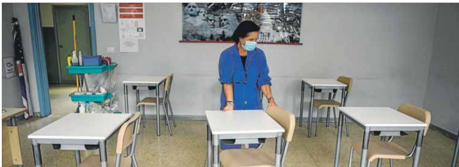
Una dona col·loca les taules amb la distància de seguretat establerta en un institut de Milà, aquesta setmana passada

L'autopista del Maresme, part de la C-33, l'AP-7 i l'AP-2 seran lliures en un any La Generalitat insisteix a implantar la vinyeta per finançar-ne el manteniment