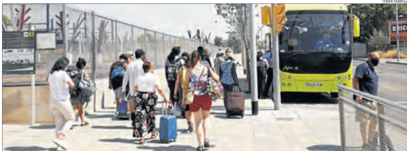
Desenes de passatgers es disposen a pujar a un autocar a Lleida després de cancel·lar-se el servei de tren pel sabotatge.