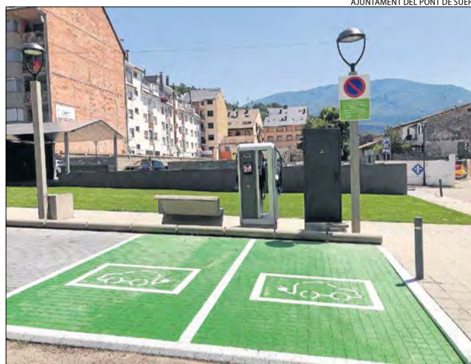
El nou carregador de cotxes elèctrics del Pont de Suert.