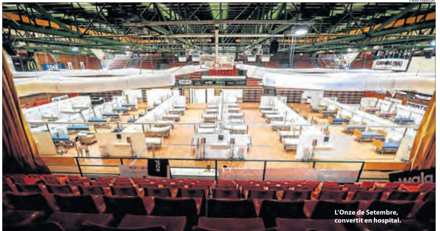
L'Onze de Setembre, convertit en hospital.

El jutjat número 4 de Lleida ha rebut un informe de l'Agència de Salut Pública en el qual es constata que les mesures adoptades al Segrià i la Noguera funcionen i la corba de contagis s'aplana. Mentrestant, el SEM anuncia que desmuntarà la carpa de l'Arnaú.