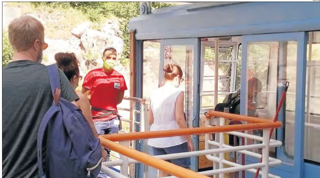
Alguns dels viatgers que ahir van estrenar la temporada estival al telefèric de la vall Fosca.

Després de quedar ajornada un mes l'obertura per una avaria