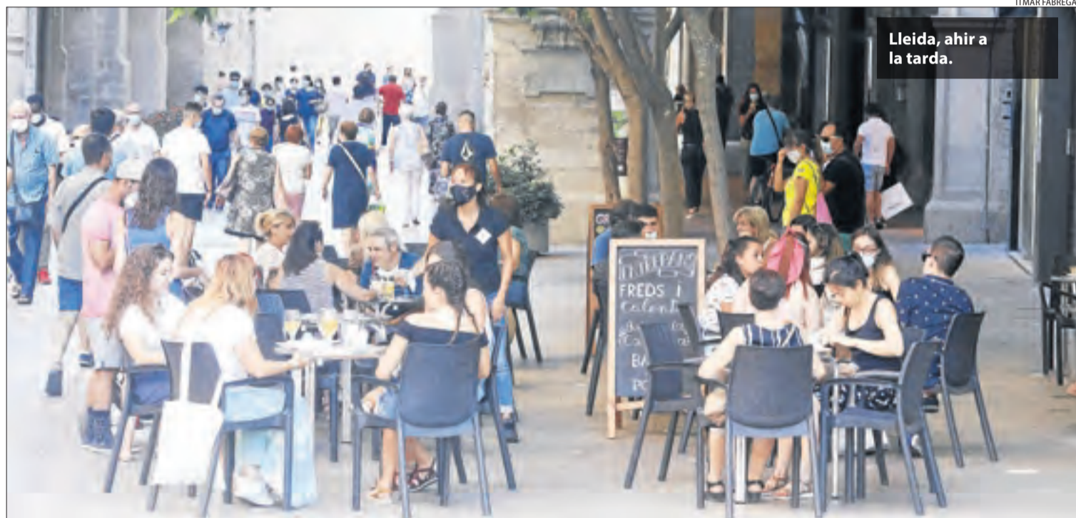
Lleida, ahir a la tarda.

Turisme || Per la seua part, el Pirineu s'atansarà al ple turístic aquest pròxim cap de setmana