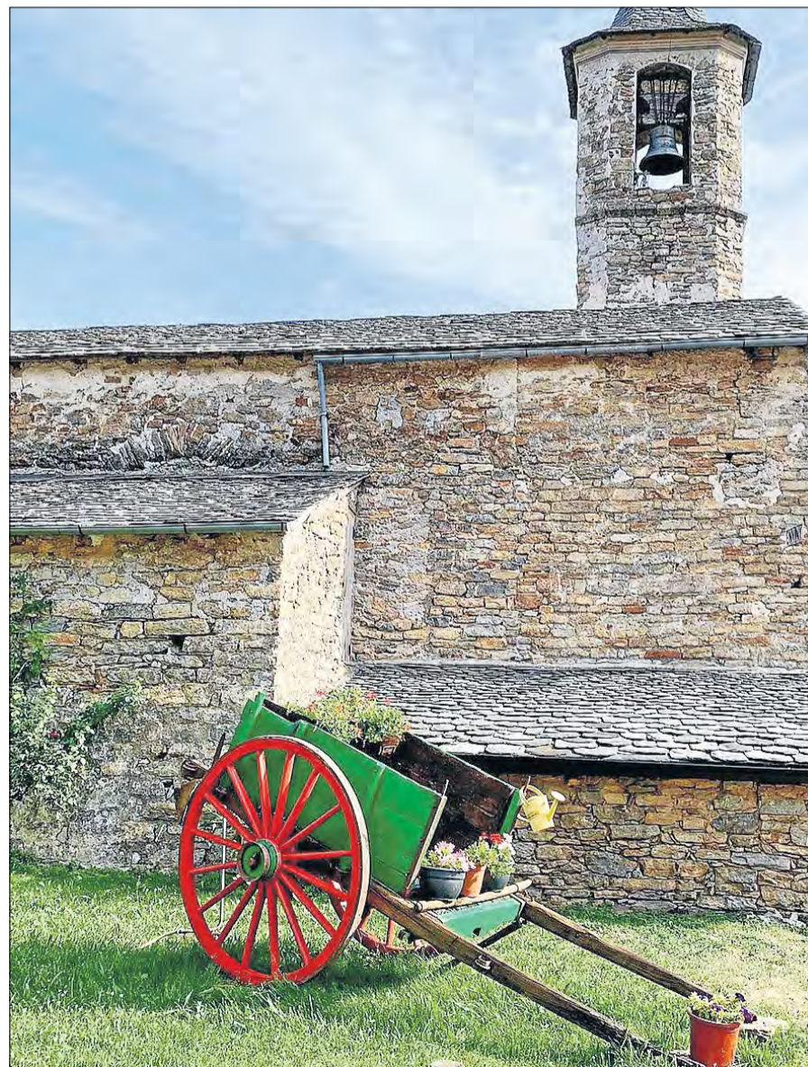
Enviny. Un racó amb encant de la localitat del Pallars Sobirà, que actualment pertany al municipi de Sort. @recasens.jordi