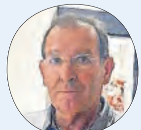
President del Jussà

«La millora de Comiols ajudarà a desenvolupar els Pallars i a lluitar contra la despoblació. És un dia històric»