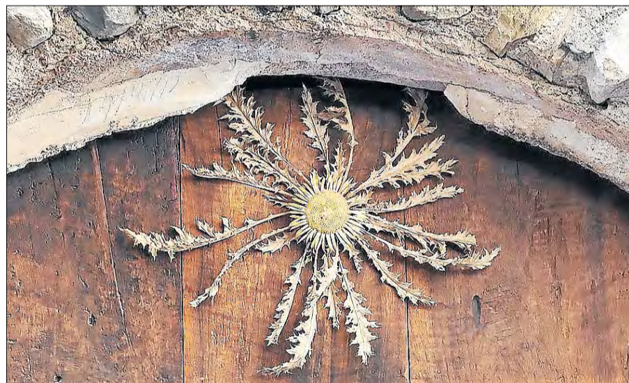
Llimiana. Una carlina presideix la porta d'una casa en aquesta localitat del Pallars Jussà, per protegir-la de bruixes i mals esperits. @rosaaites