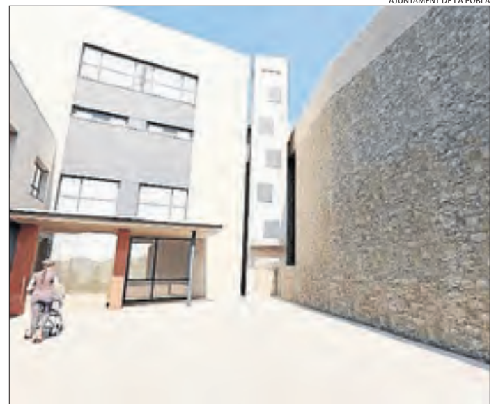
Imatge virtual del futur ascensor al costat del CAP de la Pobla.

| LA POBLA DE SEGUR | L'ajuntament de la Pobla de Segur instal·larà un ascensor a l'aire lliure d'ús públic al costat del Centre d'Assistència Primària (CAP), per salvar el desnivell de gairebé deu metres entre l'entrada al centre mèdic i la plaça de la Pedrera. Suposarà eliminar barreres arquitectòniques i facilitarà la mobilitat a peu entre la part alta de la població i les cotes més baixes. El projecte, en els primers passos de tramitació, preveu una inversió de 106.346 euros. El consistori ja disposa del 75% d'aquesta suma, a través de subvencions atorgades en el marc del Pla