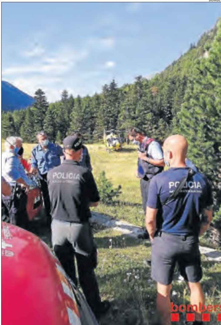
Bombers i Mossos al preparar el dispositiu ahir al matí.

Aquest any hi ha hagut tres accidents més de muntanya. Una dona va ser arrossegada riu avall a Montgarri, a Aran, un jove va perdre la vida fent snow a Martinet i un esquiador va quedar sepultat per una allau fora de pistes a Baqueira Beret.