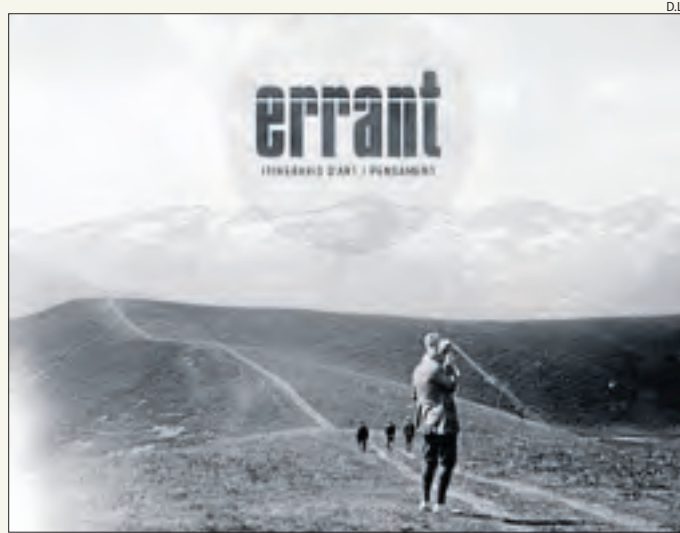
Cartell anunciador del nou festival cultural.

■ El festival tindrà la itinerància com una de les principals característiques. Es preveu que cada any es faci en municipis diferents.