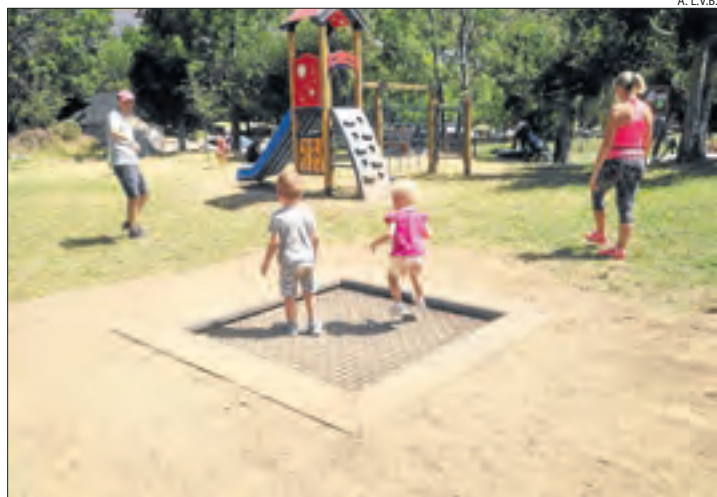
Nens jugant al nou parc del Pla de l'Ermita.