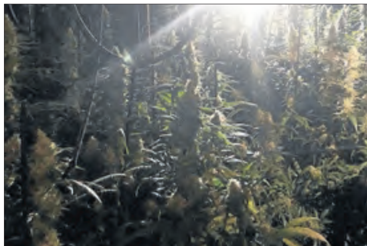
Imatge de la plantació de marihuana trobada a Rosselló.

| ROSELLÓ | Els Mossos d'Esquadra van detenir divendres un home a Rosselló acusat de ser el responsable d'una plantació de marihuana en la qual van trobar 376 plantes. L'arrest és fruit d'una investigació que van iniciar fa unes setmanes al sospitar que un veí d'aquesta localitat del Segrià podria estar dedicant-se al tràfic de marihuana i cocaïna. Després de diversos seguiments, divendres es va procedir a l'arrest de l'home i a l'escorcoll d'un immoble de la seua propietat. A l'interior, els investigadors van localitzar una plantació de marihuana preparada amb llums, ventiladors i altres materials, en la qual van trobar un total de 367 plantes. També van comprovar que tenia la llum punxada. Es desconeix si van trobar-hi altres drogues.