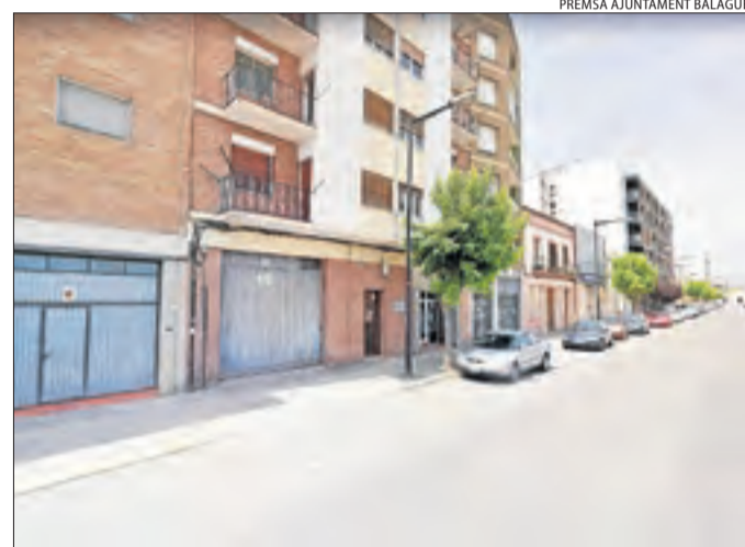
PREMSA AJUNTAMENT BALAGUER