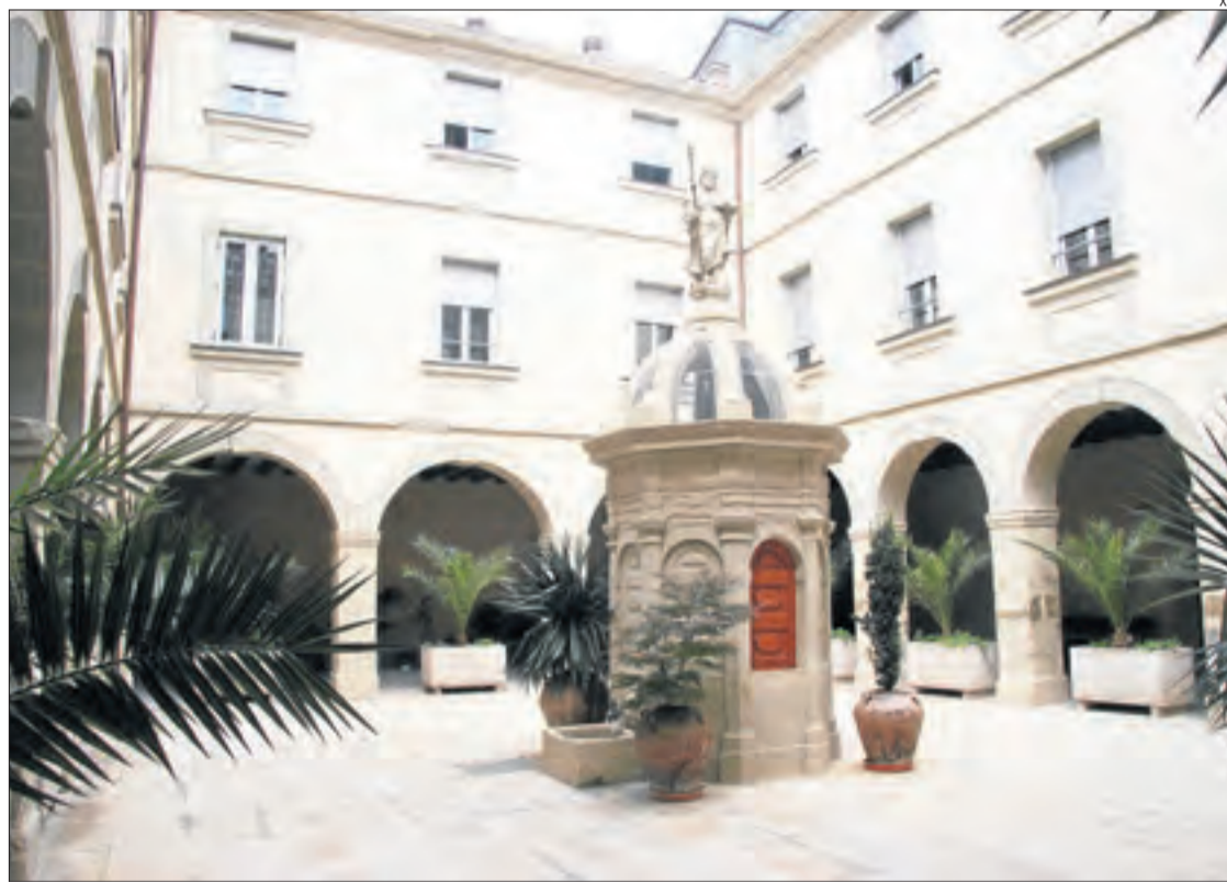
Imatge de l'interior de la residència Mare Güell de Cervera.

S'han tornat a fer PCR massius i s'ha detectat un positiu més, un usuari que és asimptomàtic