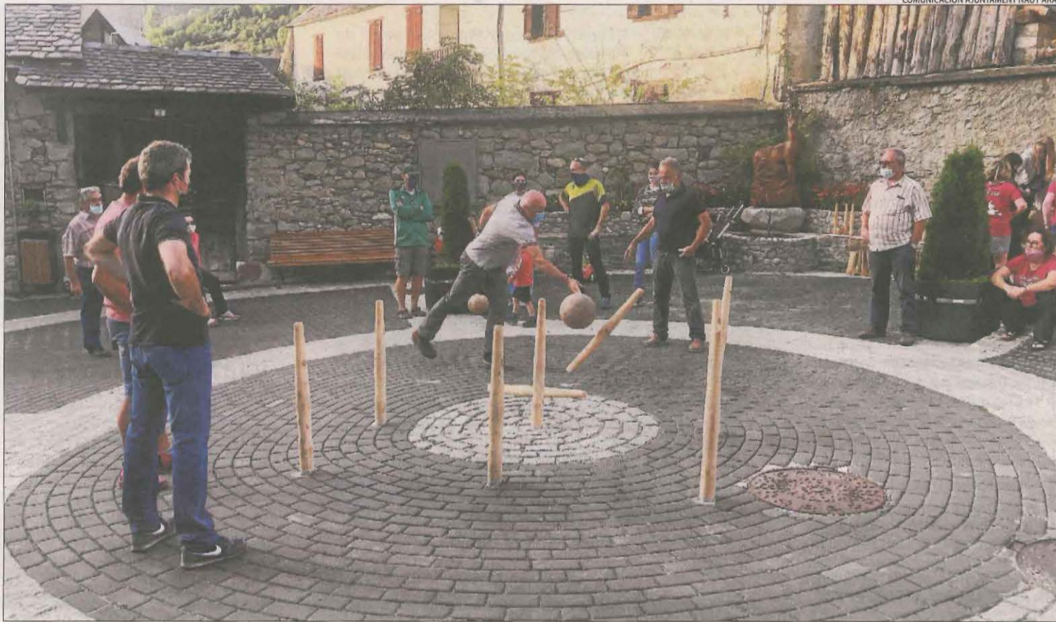
Les 'quilhes' tenen una altura d'1,25 metres i són fetes de fusta d'abet o de pi.