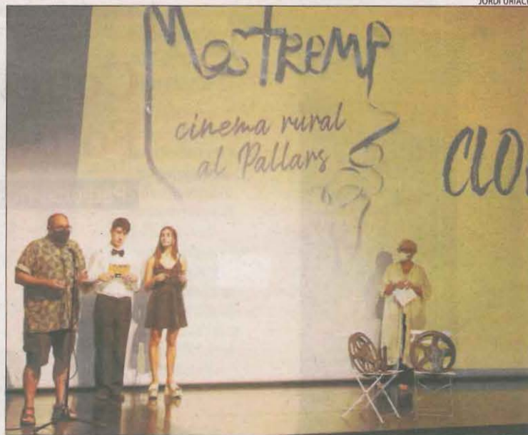
La cerimònia de cloenda de la novena edició del Mostremp.