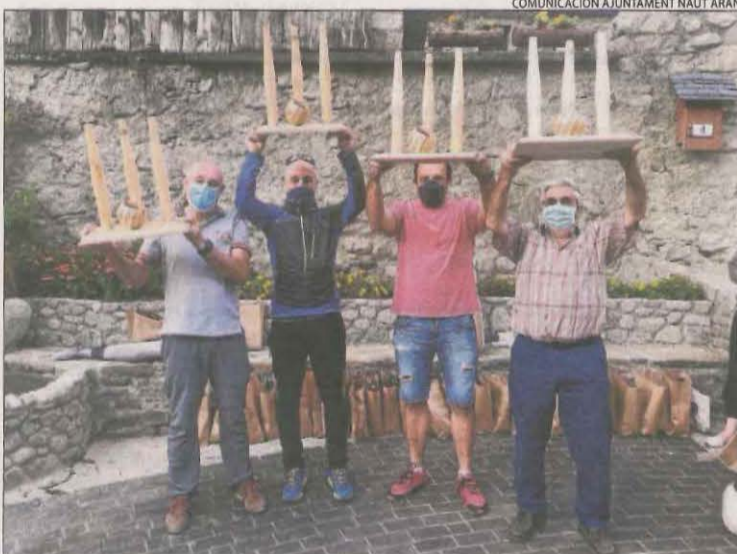
Els vencedors de la primera lliga que s'ha fet a Tredòs.