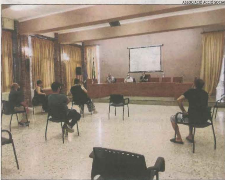
La reunió que es va fer ahir a Alfarràs.

El delegat d'Educació va recalcar que les famílies tenen l'obligació de portar els fills a les aules