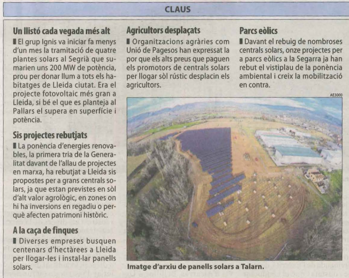
Imatge d'arxiu de panells solars a Talarn.