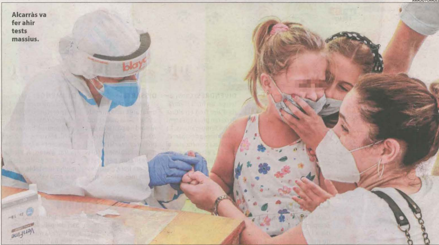
Alcarràs va fer ahir tests massius.