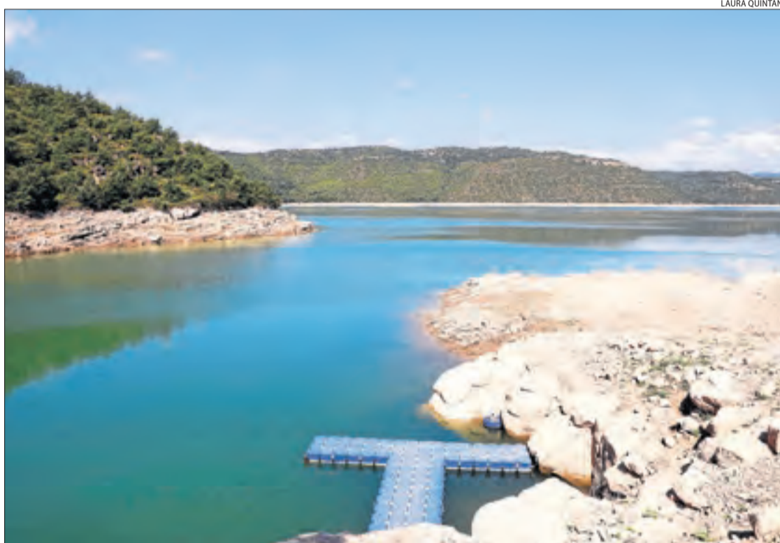
Vista del pantà de Rialb el dia 22, quan el Pirineu i el Prepirineu estaven al 100% d'ocupació.