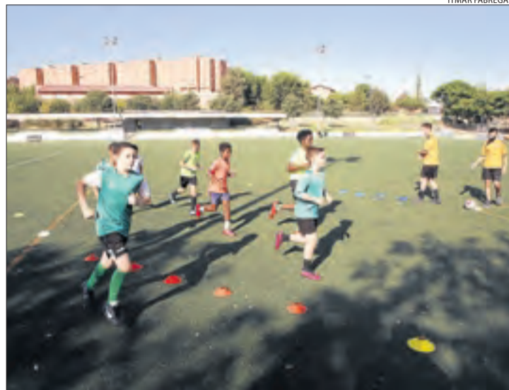
Jugadors de la base del Balàfia entrenant-se dimecres passat.

El comunicat aclareix que la prohibició de fer trobades i reunions de més de deu persones, inclosa a la Resolució de Salut que es publicarà al DOGC en les pròximes hores, no afecta