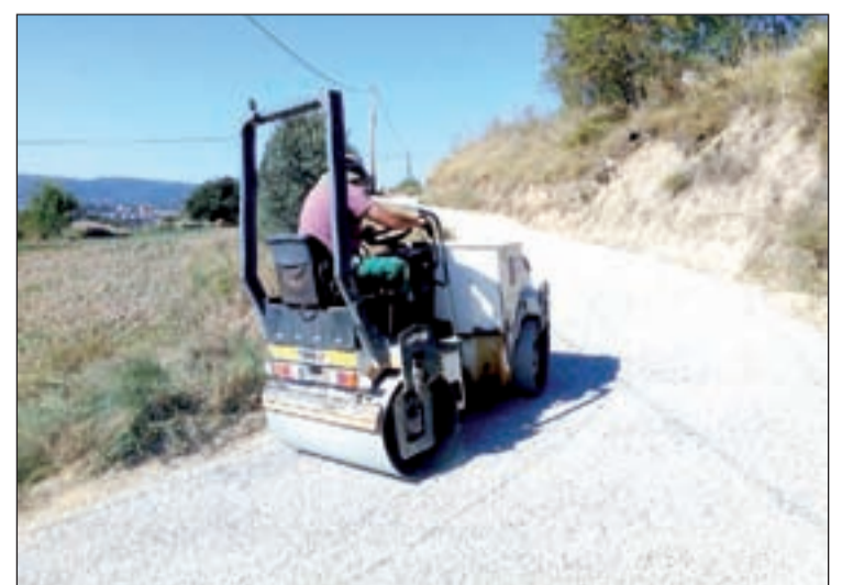
Imatge de les màquines treballant en aquest camí

L'Ajuntament de Solsona ha arranjat amb reg asfàltic el camí de Sant Bartomeu en el tram comprès entre la masia del Mas Vent Serè i Cal Llaró, que es trobava en molt deteriorat. Per finançar l'obra, que ha tingut un import de 6.146 euros, el consistori s'ha acollit a una subvenció de la Diputació de Lleida de 5.478 euros dins el Pla de camins.