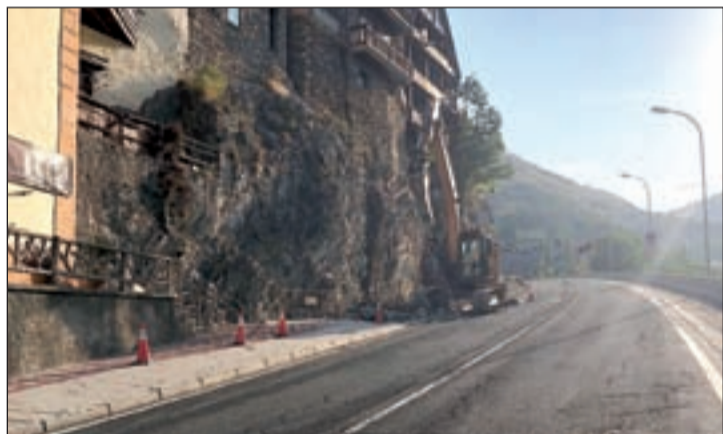
Els treballs estan en marxa des de fa uns dies