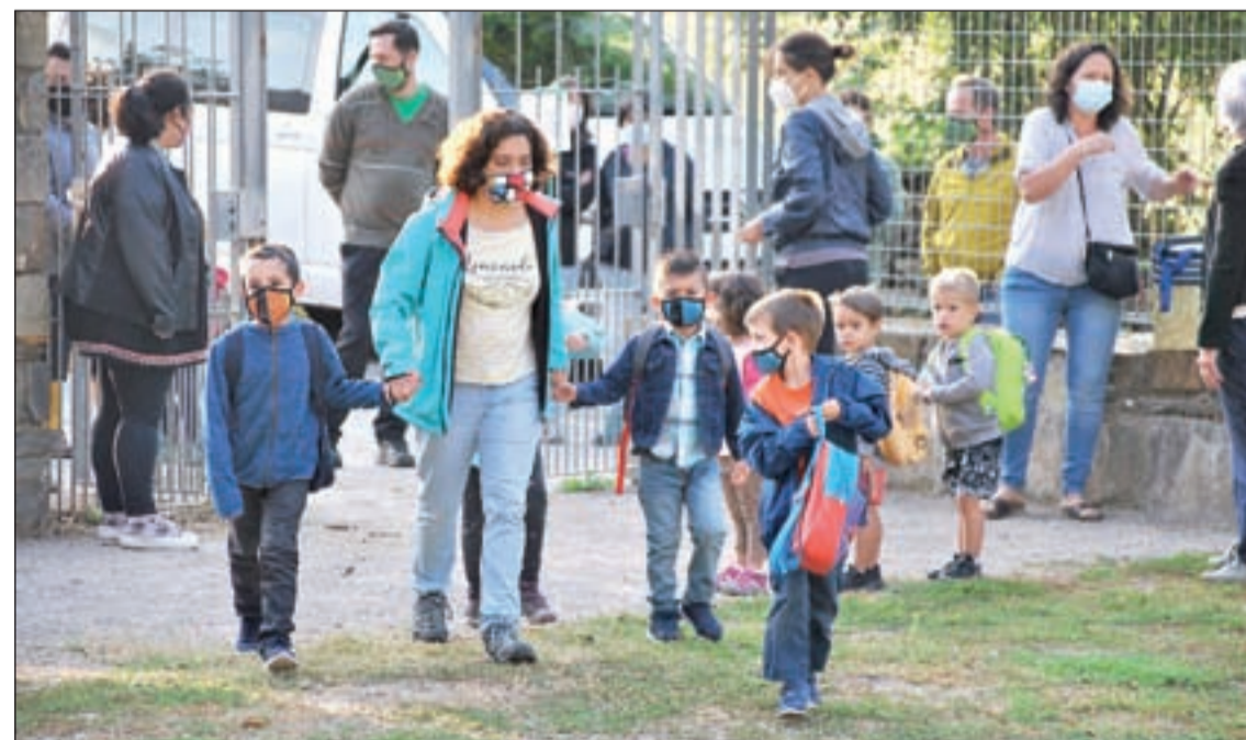
Els pares i mares de l'AMPA no van portar els seus fills dilluns com a mesura de protesta

nes inscrites a la borsa. Prèviament, s'haurà fet un procés de selecció dels candidats i també es facilitarà a les famílies que ho desitgin, la possibilitat de fer elles mateixes les entrevistes als candidats en dependències de l'IMO. Les persones que optin a la borsa han d'acreditar experiència en la cura de menors. Es valorarà tenir habilitats socials i comunicatives per al tracte amb els infants, responsabilitat, iniciativa i capacitat d'organització i un bon nivell d'expressió oral en llengua catalana.