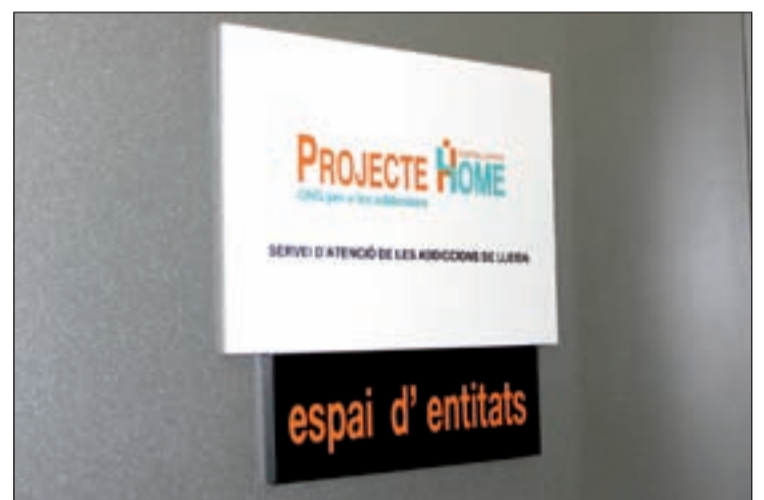
L'entitat té seus als municipis de Balaguer i Tremp

Després de la cocaïna, l'alcohol i el cànnabis se situen al mateix nivell pel que fa a les demandes d'ajuda que ocasionen, amb un 22,1% dels casos, respectivament. L'entitat remarca que l'alcohol, consumit sovint juntament