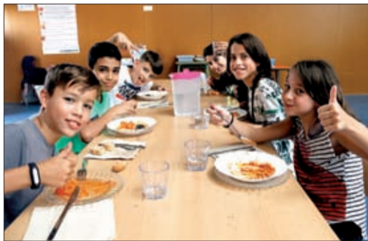
Un grup d'alumnes de l'escola Valeri Serra de Bellpuig