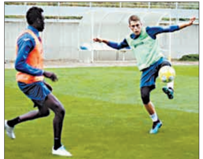
El equipo ya trabaja en la pretemporada