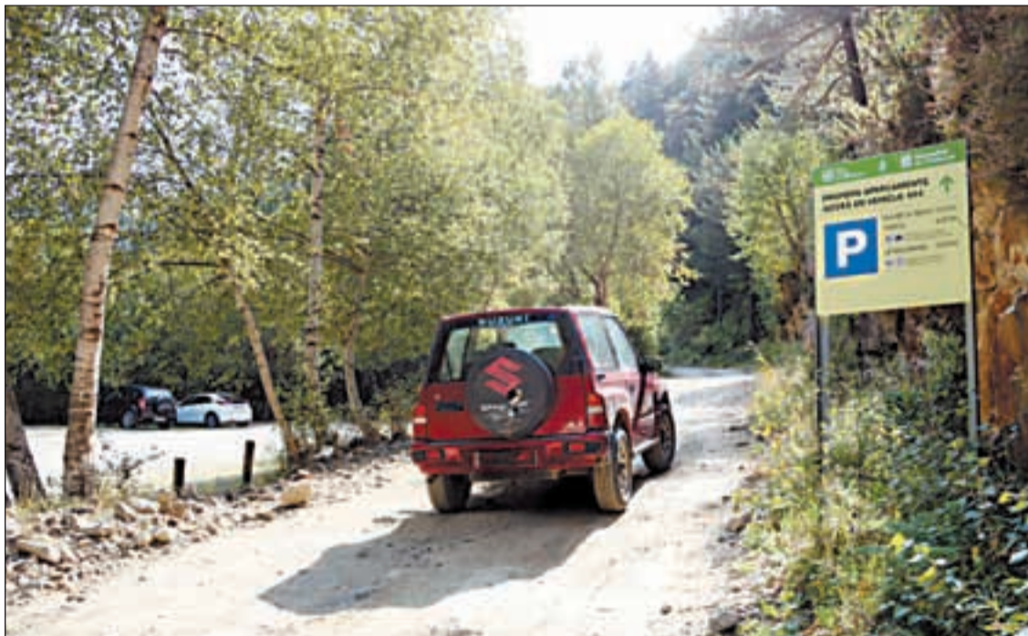
Un vehículo en la pista de acceso al aparcamiento de la Pica d'Estats