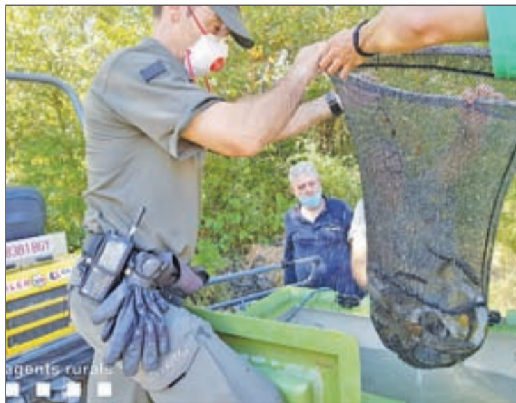
Els agents fent la supervisió de la fauna del canal

Els Agents Rurals realitzen aquests dies al terme de Conca de Dalt (Pallars Jussà) el seguiment i supervisió del pla de rescat de fauna del canal de Sossís, que s'ha d'assecar per al seu manteniment i el de la central hidroelèctrica. També han fet una inspecció en horari nocturn de la mateixa zona, on s'han rescatat 170 crancs autòctons que havien quedat amagats sota pedres i que haurien acabat morint. En total s'han rescatat 2.494 truites autòctones, 305 crancs autòctons i 137 Babs cuarroig. La majoria dels peixos i crancs s'han alliberat al mateix riu Noguera Pallaresa.