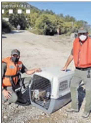
Diferents moments del rescat, efectuat pels Agents Rurals, de l'animal al pantà de Canelles