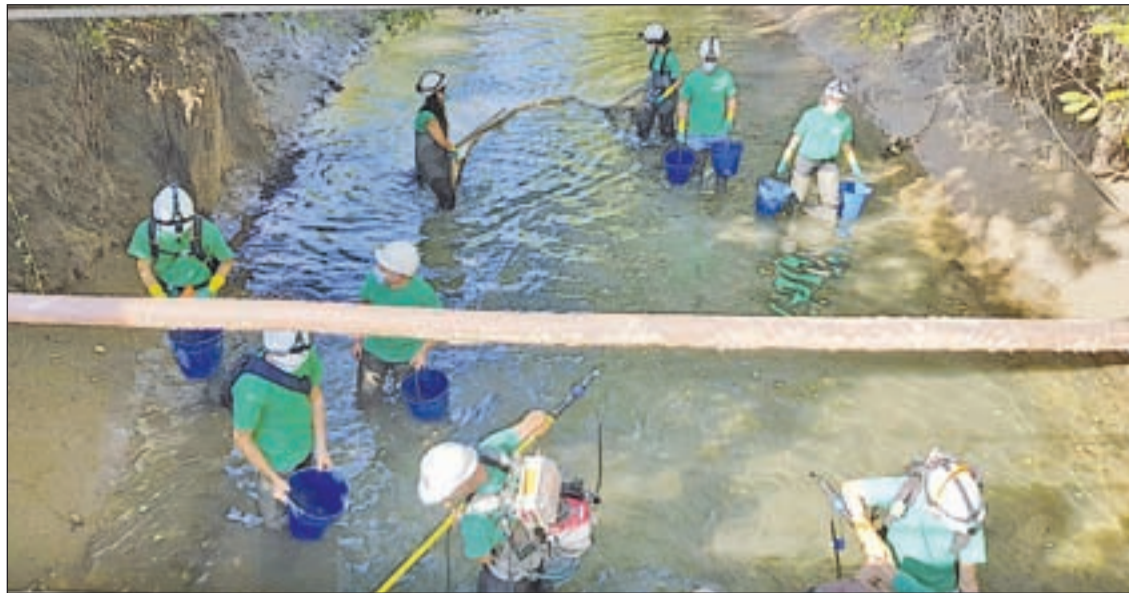
El canal s'ha d'assecar per al seu manteniment i el de la central hidroelèctrica