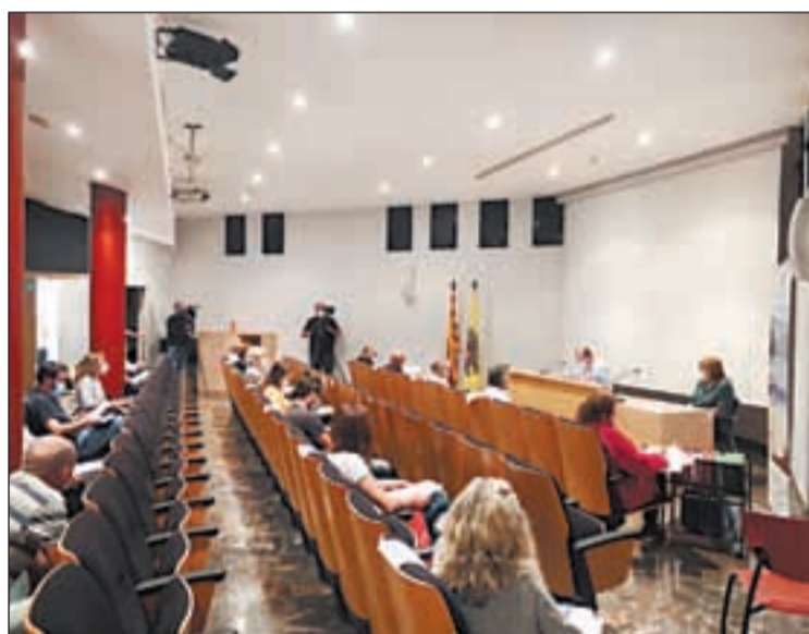
Es va anunciar al ple extraordinari del consell

Entre les actuacions més destacades que inclourà el projecte s'hi troba, per exemple, la millora de la via d'accés de Sant Esteve de la Sarga a Alsamora amb