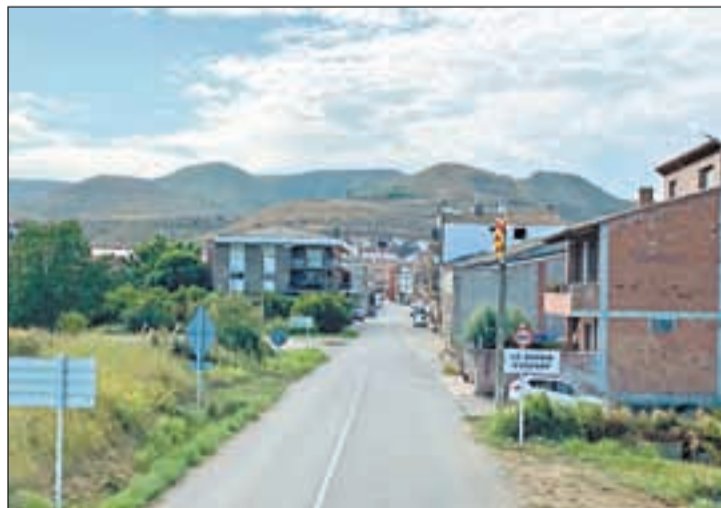
Es milloraran les voreres i el ferm del carrer

Gràcies a la col·laboració dels tècnics del Consell Comarcal del Segrià, que van redactar les tres propostes, l'Ajuntament ha rebut la màxima puntuació en els dos programes de la convocatòria PUOSC, desglossats en 250.000€ en el programa d'inversions i 120.000€ per al programa de petits municipis. Això permetrà comptar amb la màxima subven-