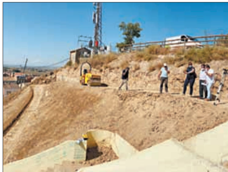
Els tècnics del consell supervisant les millores

posarà la millora de les voreres i del ferm del carrer, es renovaran els serveis d'aigua i clavegueram i s'ordenarà aquesta via per tal que permeti tant el trànsit rodat, com l'accés als habitatges.