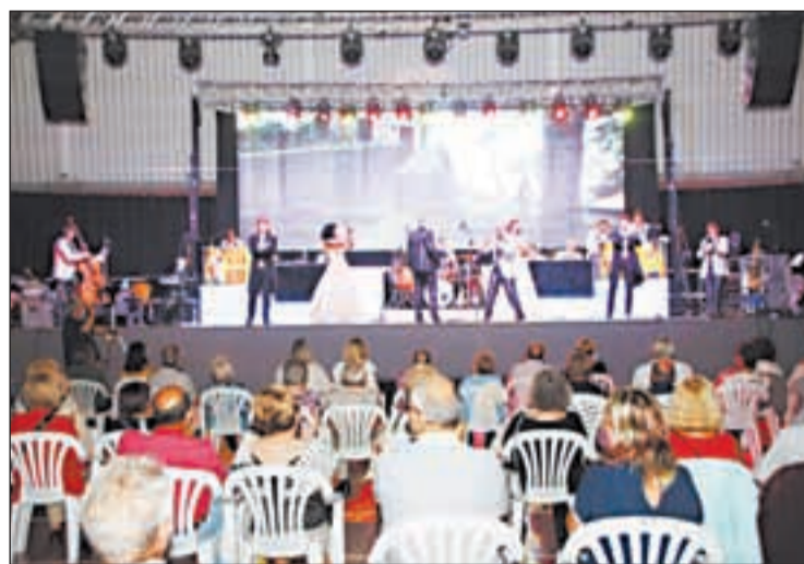
La Selvatana va oferir un concert ahir la tarda

Les Festes de la Mercè d'Almacelles van començar amb un repic de campanes a les 10 del matí. Enguany la celebració serà força singular com a conseqüència del Covid 19. Unes festes en les que l'acte més important i destacat serà la inauguració del Alma Parc Escultòric 2020, en l'interior del Parc d'Europa, el divendres 25.