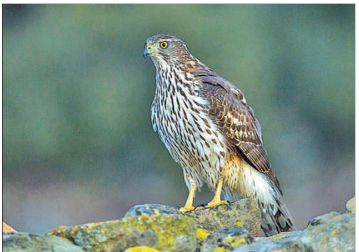
El virus es va trobar en un astor a Alpicat, però afecta principalment als cavalls

El 17 de setembre, el Centre de Recerca en Sanitat Animal (CRESA) de l'Institut de Recerca i Tecnologia Agroalimentàries (IRTA) va confirmar un cas de virus del Nil Occidental en un astor de la població d'Alpicat (Segrià) que