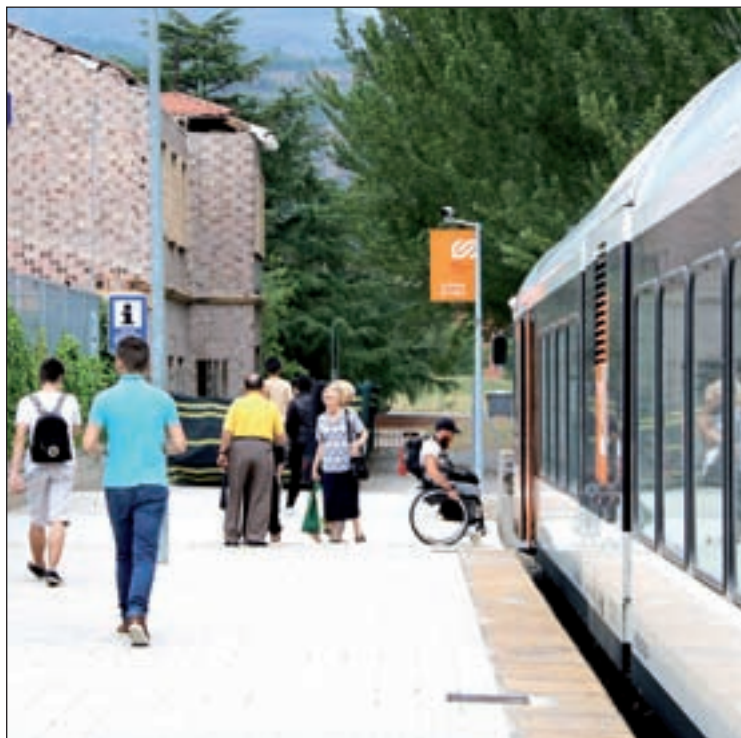
La pandèmia va endarrerir l'homologació del tren