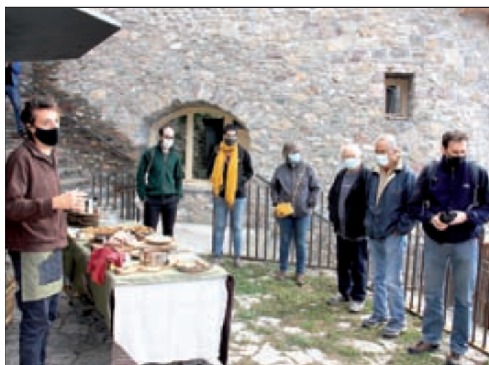
La cuina de proximitat serà una de les claus del projecte

perfil de visitant, ja sigui familiar, senderista o amant de la fotografia de fauna i natura. A més, els beneficis d'aquest projecte es volen revertir en accions destinades al territori, situat entre les comarques del Pallars Jussà i Sobirà i l'Alt Urgell, les quals seran consensuades amb la gent que hi viu durant tot l'any en aquesta àrea pirinenca.