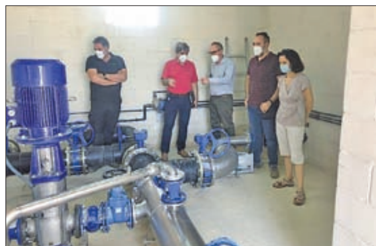
Fa dotze anys que es va iniciar el projecte

El nou dipòsit d'aigua està ubicat a la carretera de Vilanova, a prop del cementiri municipal. A diferència de l'anterior subministrament d'aigua potable, que s'abastia del Canal de Pinyana, el nou equipament rep l'aigua de l'embassament de Santa Anna i el gestiona l'empresa Cassa.