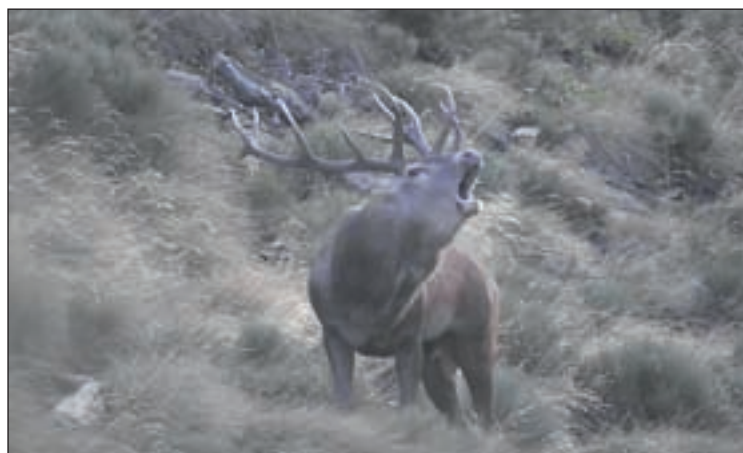
Imatge d'arxiu d'un cérvol bramant

Els serveis d'informació i observació de la brama del cérvol de la Reserva Nacional de Caça de l'Alt Pallars i del Parc Natural de l'Alt Pirineu ja estan en marxa i estaran disponibles fins al 18 d'octubre. Per quart any consecutiu, es posa un servei gratuït d'informadors situats en punts d'observació fixes, equipats amb material òptic i divulgatiu per fer més fàcil l'observació de la brama als interessats. Els tres punts d'observació guiats s'ubiquen a Alòs d'Isil, a la Bonaigua i a Gavàs. També hi ha la possibilitat de fer visites acompanyats de guies interpretadors. L'any passat es van atendre més de 1.000 persones en els diferents punts. Enguany, s'ha previst un protocol per evitar aglomeracions i mantenir la seguretat en els punts.