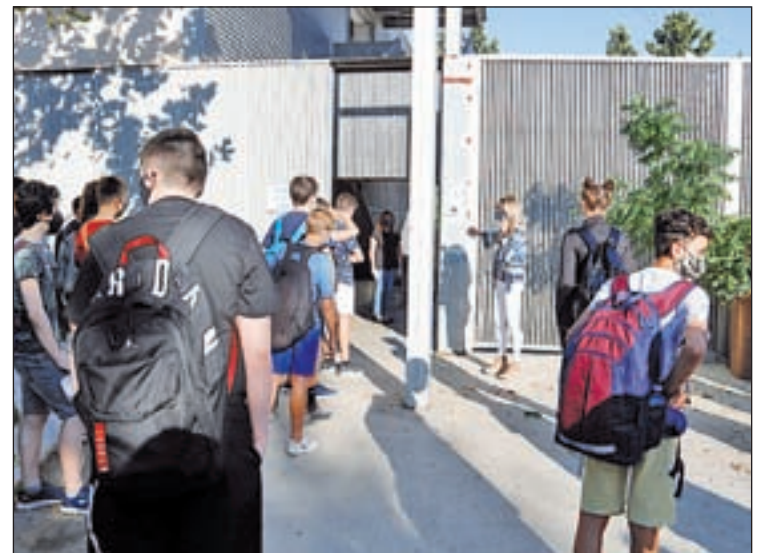
Accés dels alumnes a les instal·lacions de l'INS Gili i Gaya

A la capital de la Noguera, hi ha dos grups de dos centres