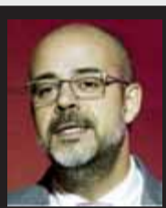
Miquel Buch CONSELLER