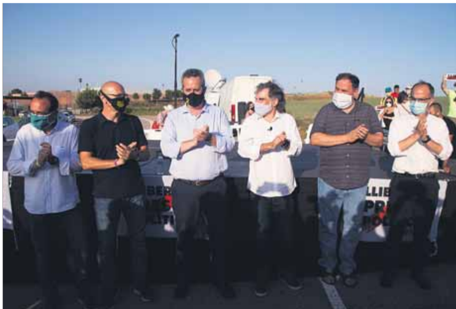
Els presos polítics, en l'acte per la tornada obligada a Lledoners, el 28 de juliol

Les defenses dels set presos polítics que són al penal de Sant Joan de Vilatorrada van valorar positivament que la jutgessa aprovés el seu pas a tercer grau, que els serveis del Departament de Justícia va concedir-los el 15 de juliol passat, i del qual van gaudir només dues setma-