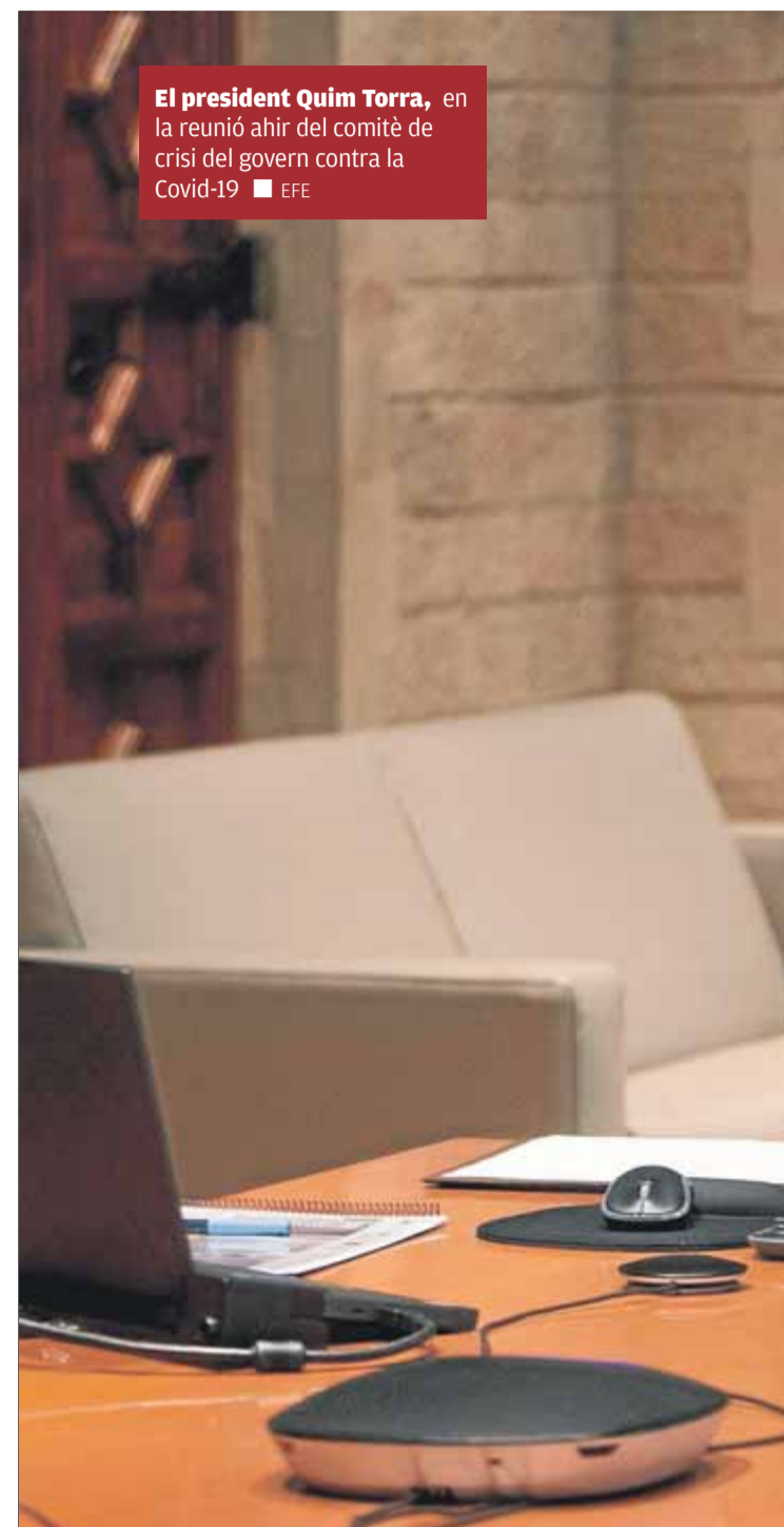
El president Quim Torra, en la reunió ahir del comitè de crisi del govern contra la Covid-19

dria acabar aportant una nova prova a la defensa dels polítics independentistes, tant els presos com els exiliats, en els nombrosos litigis ja oberts a l'exterior, i els que tard o d'hora arribaran a la justícia europea. El mateix Torra recordava ahir que està a punt de ser inhabilitat per una pancarta que “deia el que deia”, quan el dictamen del Grup de Treball de Detencions Arbitràries de l'ONU el 2019, en què la justícia belga ha basat per exemple la negativa a extraditar l'exconseller Lluís Puig, “diu que és responsabilitat dels governs fer pública” d'aquesta situació. “És molt important