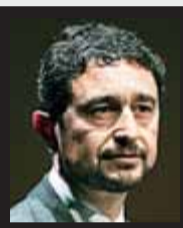
Damià Calvet CONSELLER