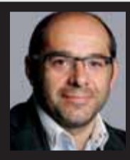
Lluís Guinó DIPUTAT