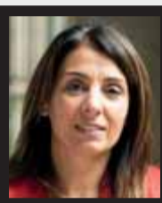
Meritxell Budó CONSELLERA