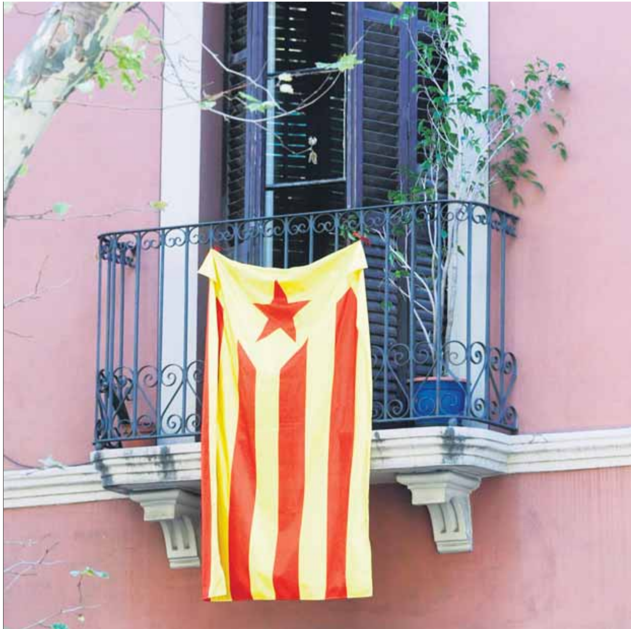
L'ANC proposa una sortida simultània al balcó perquè tothom que vulgui pugui participar en els actes ■ JUANMA RAMOS

L'organització reitera que aquesta no és una acció alternativa a les concentracions estàtiques planejades. "No tenim cap intenció de renunciar a l'acte físic", explica amb relació al centenar de plantades de protesta que es faran davant les delegacions d'organismes de l'Estat i que les autoritats sanitàries han començat a desaconsellar. Els encarregats d'organitzar els actes de l'ANC han anat definint el límit dels aforaments en cada punt de concentració tenint en compte que s'imposaran les distàncies interpersonals de dos metres i que, finalment, caldrà inscriure's personalment per participar en cadascuna de les plantades. La limitació de participants per la inscripció prèvia i la delimitació del perímetre de l'espai que s'ocuparà en cada cas impedeix la participació de la majoria de persones que haurien assistit a la manifestació ordinària