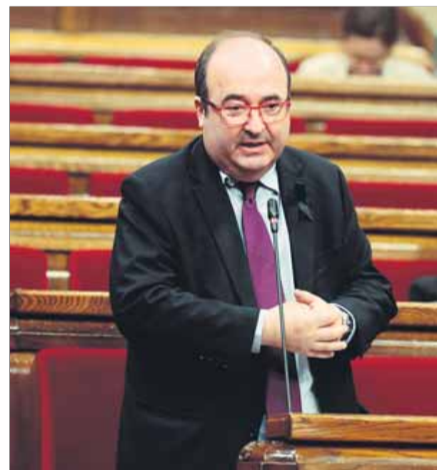
El líder del PSC, Miquel Iceta, durant una intervenció al Parlament, el juliol passat