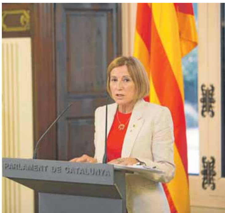
Carme Forcadell, ahir en la seva intervenció per commemorar els 40 anys del restabliment del Parlament

majoritària a les urnes. En aquest sentit, Forcadell va ser ahir la protagonista de l'acte i va ser en la figura de l'expresidenta que la resta de presidents van voler encarnar els principals valors que al llarg de la història s'han posat en valor des del Parlament. "Diàleg parlamentari, rebuig de l'autoritarisme i el reconeixement de l'altri com a interlocutor vàlid", va afirmar el president Joan Rigol. El president Ernest Benach va posar el focus en el treball legislatiu com a eina per millorar la vida dels ciutadans i va destacar el repte d'haver intentat elaborar un nou Estatut d'Autonomia per ampliar el marc de l'autogovern i donar així resposta a les necessitats de la ciutadania malgrat el fracàs registrat quan l'Estat va esmenar la voluntat de la ciutadania expressada en el text. La presidenta Núria de Gispert va