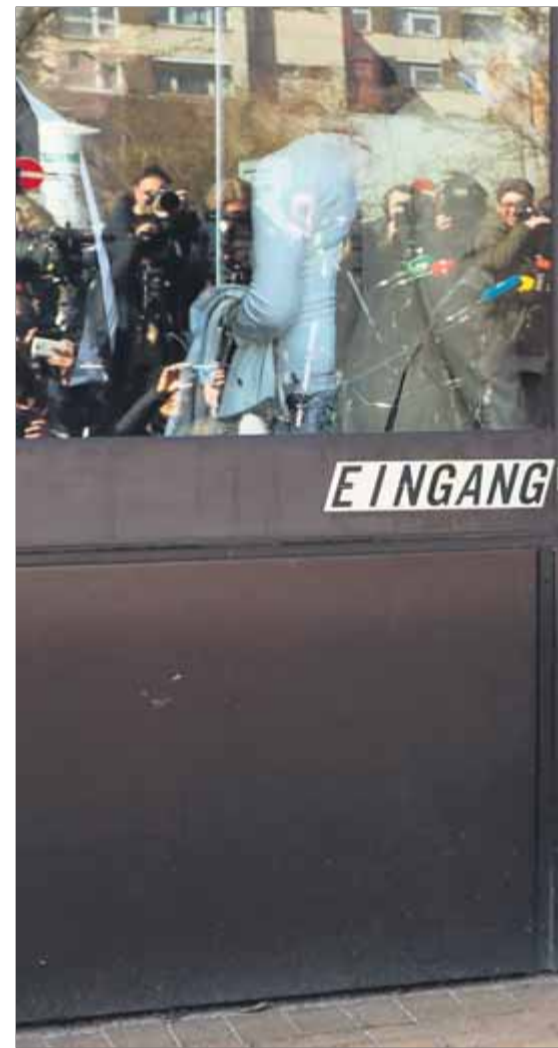
El president, sortint de la presó, el 6 d'abril del 2018 ■