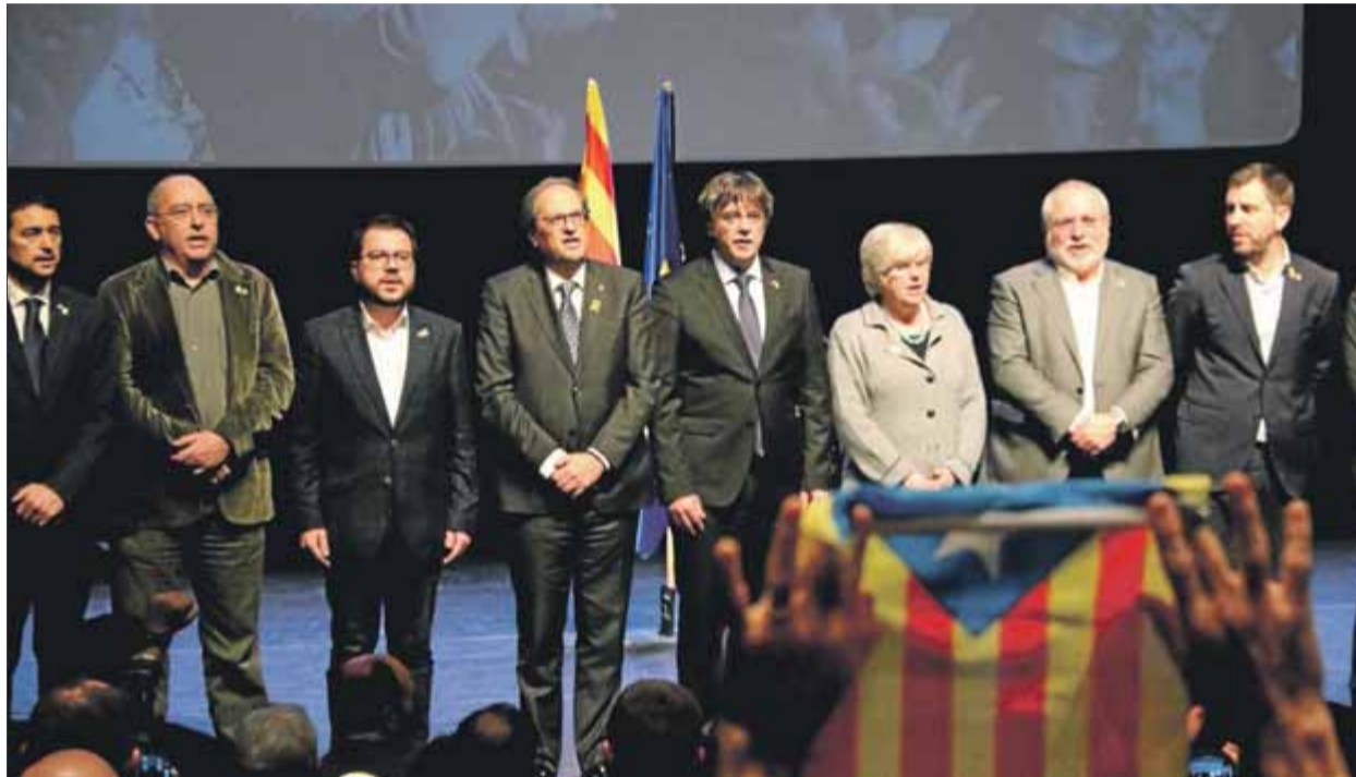
El Consell per la República es va presentar a Brussel·les el desembre del 2018, amb les principals autoritats del govern

L’article sosté que no es pot permetre la “instrumentalització electoral”