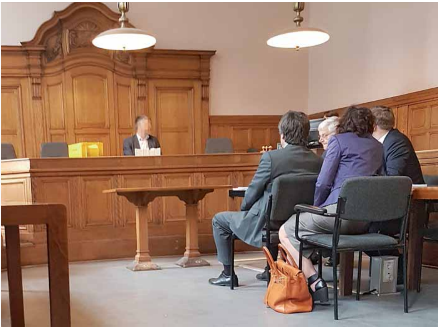
Imatge inèdita del president declarant davant del jutge, a Berlín ■