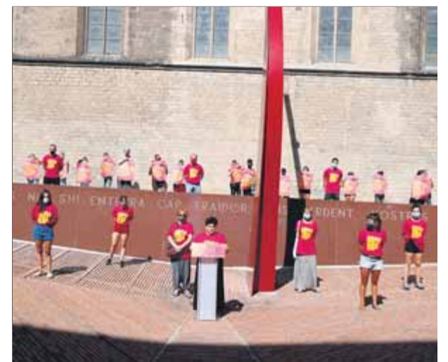
Representants de l’EI presentaven ahir al Fossar de les Moreres la manifestació estàtica de la Diada

L’EI també preveu realitzar durant la Diada actes polítics a Lleida, Reus i Girona mentre que a Barcelona, a dos quarts d’onze del matí, també tindrà lloc una manifestació juvenil pel carrer Ferran, on es mantindran les distàncies entre participants. ■