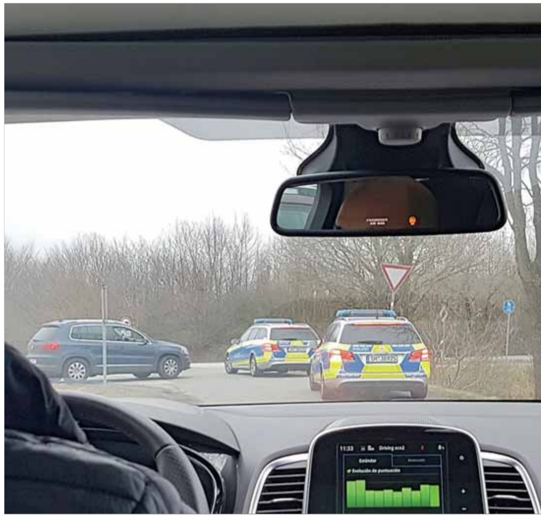
Imatge presa el 25 de març del 2018 des de l'interior del cotxe on viatja Puigdemont en el moment en què la policia l'intercepta quan acaba d'entrar a Alemanya i l'atura en una àrea de servei

En el segon lliurament, del qual El Punt Avui n'avança un fragment en exclusiva, el lector hi trobarà un relat igualment notarial però molt més periodístic que en el primer. Si M'explico és un document històric extraordinari per acostar-se als fets del període més intens del procés (2016-2017) i saber què pensava en temps real el principal protagonista, a La lluita a l'exili hi ha, a més de la trepidant successió d'esdeveniments del període 2018-20 (amb moments clau com la detenció a Alemanya, negociacions frustrades amb Esquerra i la tensió a Estrasburg el dia de la gran manifestació), espai per a la reflexió política, amb opinions i anàlisis del president a l'exili que no deixaran ningú indiferent.