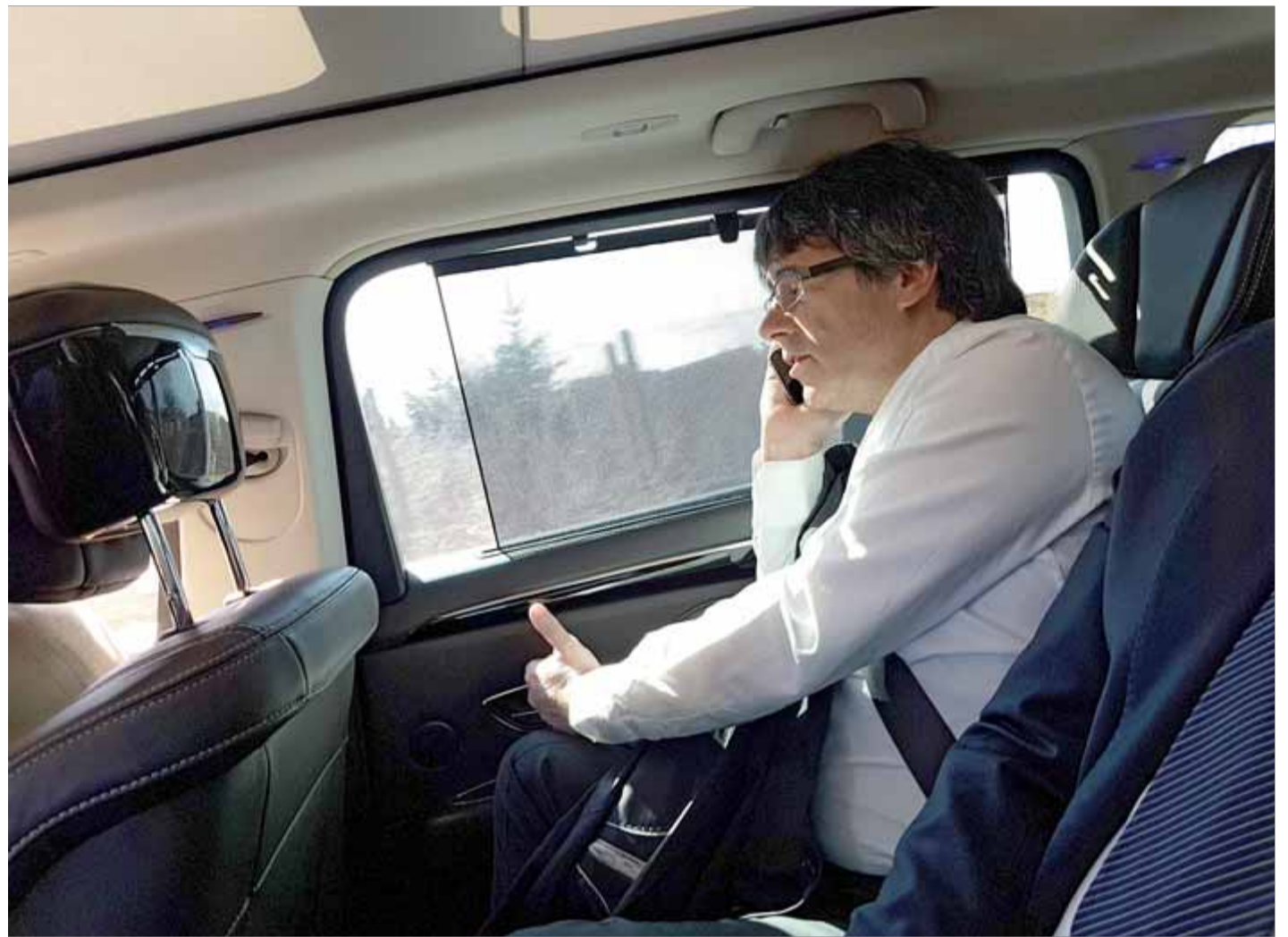
Sortint de la presó de Neumünster, fent la primera trucada, a les seves filles