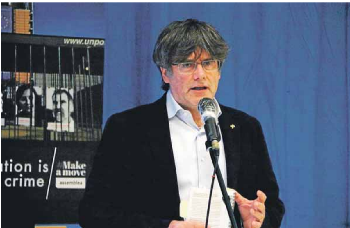
Carles Puigdemont va intervenir ahir en l'acte de l'ANC a Brussel·les en què s'exposen les fotos censurades a Arco ■ ACN

EXPOSICIÓ • S'inaugura a Brussel·les amb motiu de la Diada l'exposició dels presos censurada el 2018 a la fira Arco PUIGDEMONT • El president a l'exili diu que no es pot negociar amb un "estat opressor" que vol "doblegar-nos"