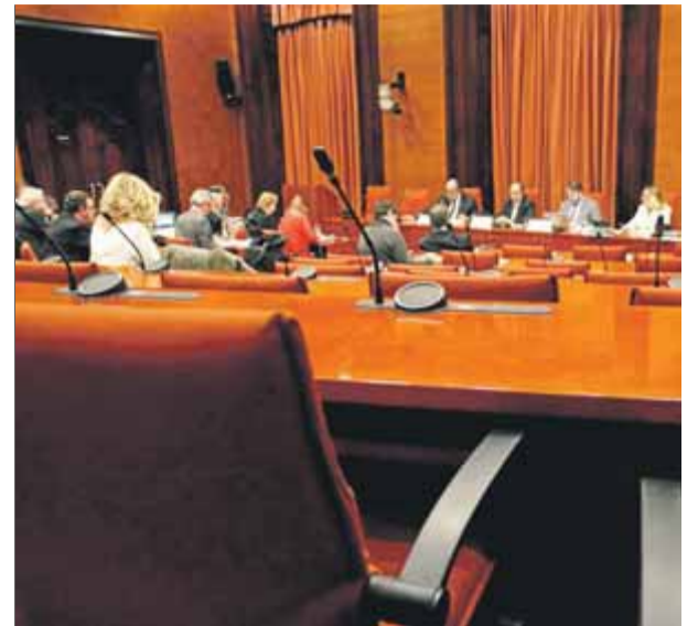
Una sessió de la comissió de la Sindicatura de Comptes del Parlament celebrada a principi de l'any passat

L'exconseller Lluís Puig i el raper Valtònyc també van intervenir en l'acte de l'ANC per inaugurar l'exposició de Santiago Sierra Presos polítics a l'Espanya contemporània , que va ser censurada a Arco el 2018. Les fotografies dels presos es podran veure del 6 al 30 de setembre a la sala Espace Nive Centre Multiculturel de Molenbeek. "Aquesta exposició ens interpel·la sobre la persistència de la tradició espanyola d'empresonar dissidents", va afirmar Puigdemont. ■