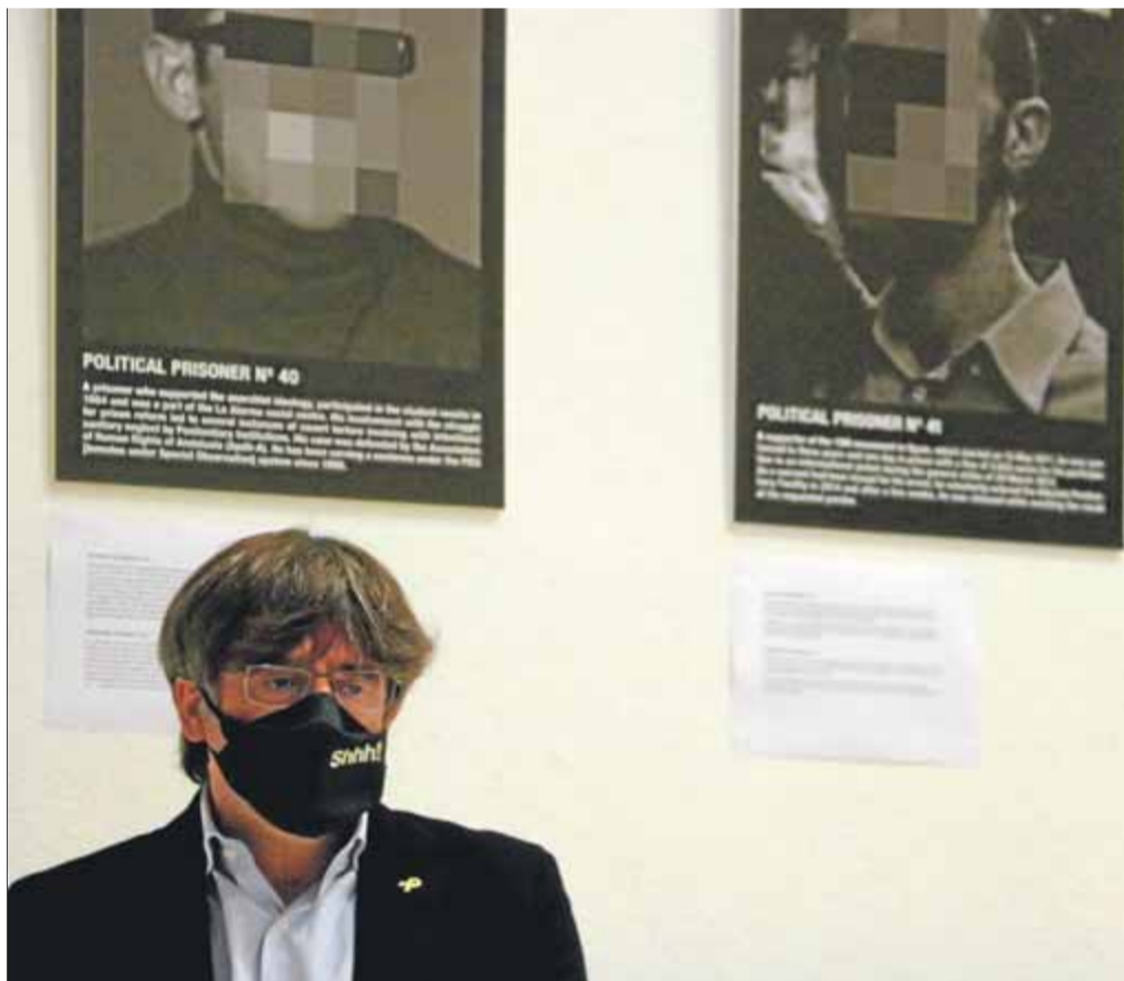
El president Puigdemont, durant la presentació a Brussel·les de l'exposició de Santiago Sierra 'Presos polítics a l'Espanya contemporània'