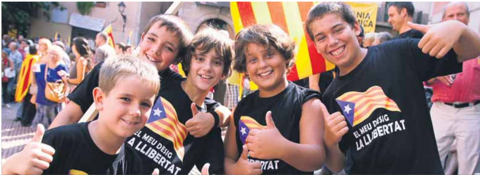
Un grup de nens, amb la mateixa samarreta i el disseny de llibertat, a la Diada del 2012 a Barcelona