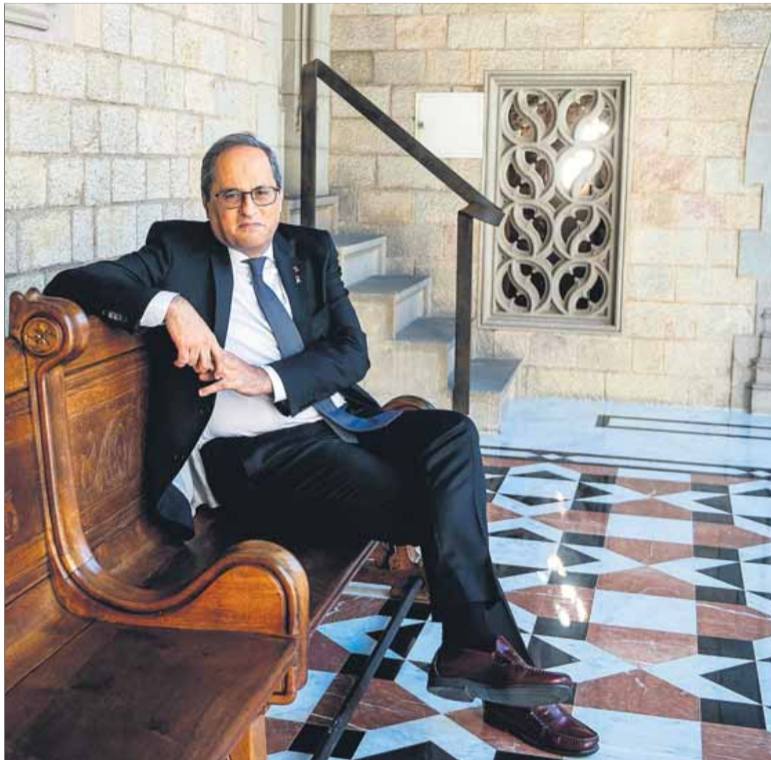
El president de la Generalitat, Quim Torra, va enregistrar ahir el missatge institucional de la Diada

En aquest cas no va dir res, però respecte a la taula del diàleg, jo li vaig dir: "Escolti'm, per mi, si