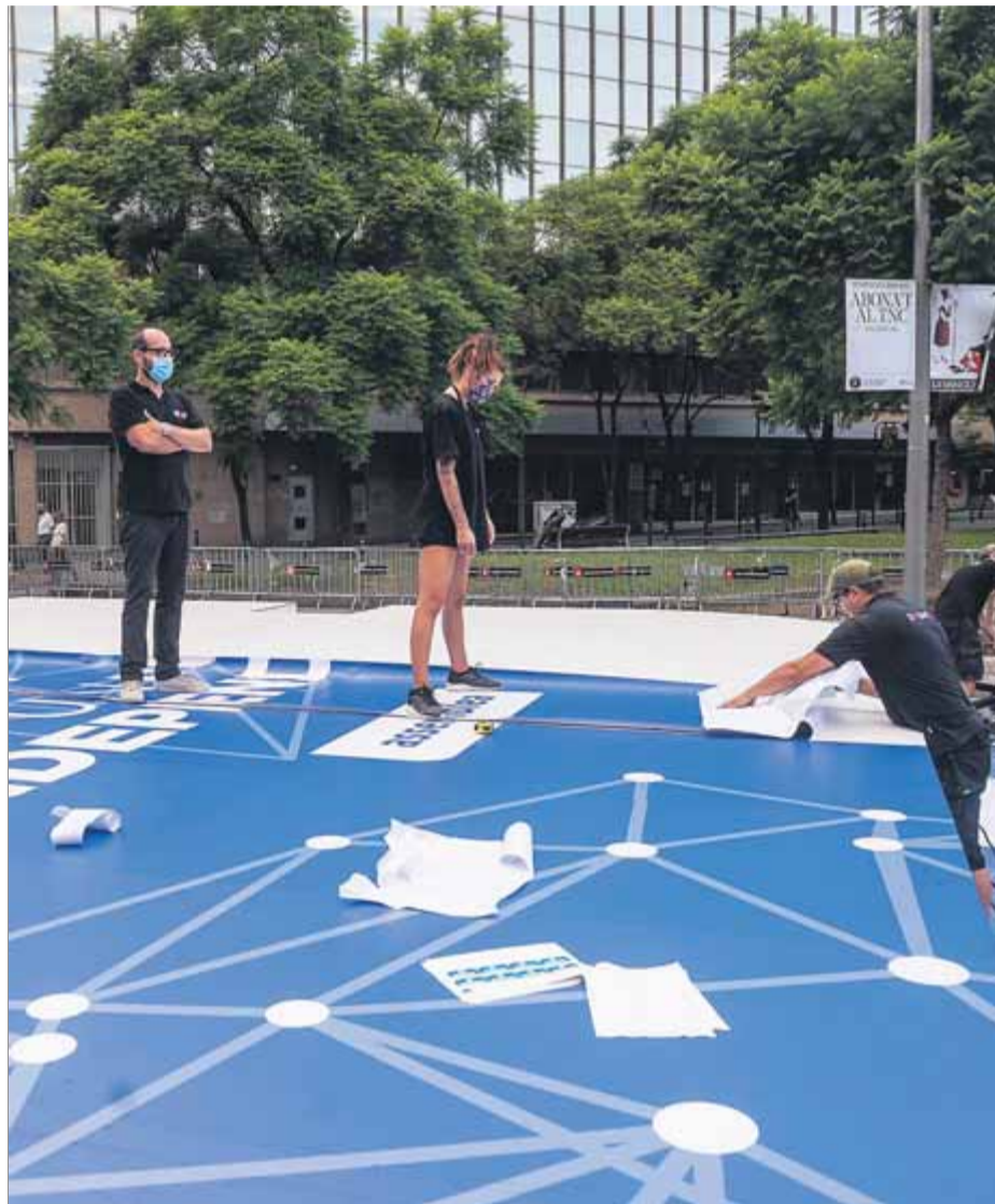
Preparació de l'escenari de l'ANC a la plaça Letamendi davant d'Hisenda

L'independentisme, però, mantindrà la seva presència majoritària amb les concentracions de l'ANC, Òmnium i l'Esquerra Independentista (EI). Òmnium reclamarà al matí al passeig Lluís Companys l'amnistia dels presos polítics i els exiliats en un acte sense públic, com també ho han estat els organitzats pel Parlament i el govern. També al passeig Lluís Companys, l'EI farà la seva tradicional manifestació; també se'n faran a Girona, Lleida i Reus. Per primer cop una concentració estàtica, amb distància, límit d'aforament i control d'accés. La mateixa fórmula que utilitzarà l'ANC en més d'un centenar de concentracions d'entre 200 i 300 persones de mitjana que farà en desenes de municipis arreu del país. Des de l'acte central es faran connexions arreu. ■