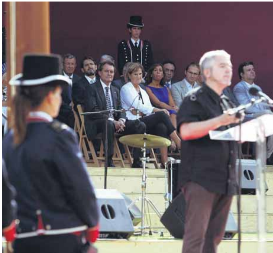
El president Mas, al fons, mentre Màrius Serra pronunciava 'Català a l'atac!' ■ QUIM PUIG

La profunda crisi econòmica i les consegüents retallades eren un factor de desassossec, juntament amb l'endèmic maltractament fiscal de l'Estat contra Catalunya. S'hi afegia una reforma express de la Constitució, pactada entre el PSOE i el PP, sense referèndum ni els consensos del 1978, que laminava l'autogovern. Però la indignació brollava especialment de la temptació recentralitzadora, manifestada també en forma