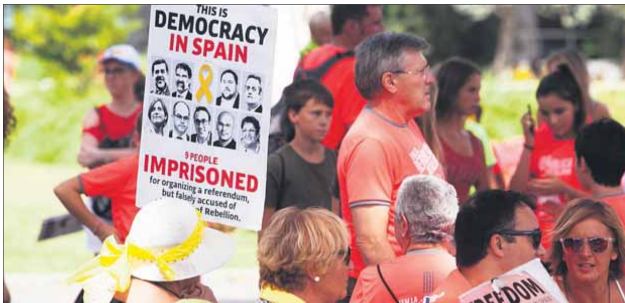
Manifestants a la Diada del 2018 amb pancartes i motius grocs per demanar l'alliberament dels presos

Els manifestants van anar-hi amb estelades però també amb pancartes pels represaliats i motius grocs per demanar-ne l'alliberament. Fins i tot en algun tram es va veure alguna urna de l'1-O, que els assis-