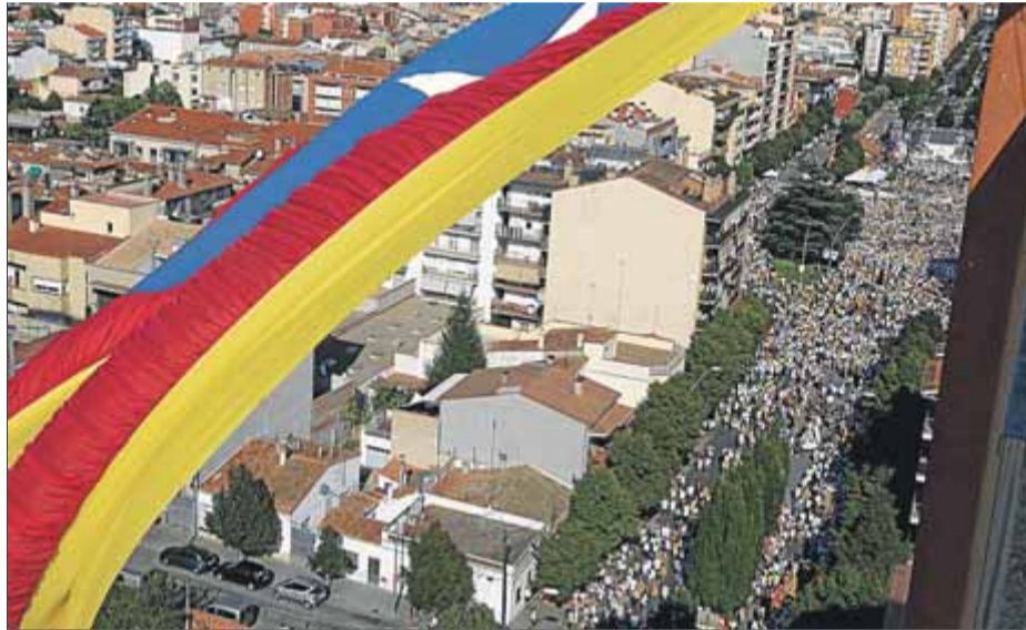
Vista aèria d'una de les cinc grans mobilitzacions de la Diada del 2016, a Salt

Després de deixar Artur Mas "a la paperera de la història", el 2016 va començar amb la investidura in extremis de Carles Puigdemont com a president de la Generalitat, un fet que va desencallar una legislatura que havia de dur en 18 mesos a la independència. Aquest, si més no, era el compromís de Junts pel Sí, i en això es va posar de seguida: el govern, a preparar "estructures d'estat" mentre insistia en va a parlar amb l'executiu espanyol (que, després s'ha sabut, aleshores ja tenia a tota màquina l'operació Catalunya per espiar els líders catalans); i el Parlament, a dissenyar el procés constituent i les "lleis de desconexió". El fet, però, que el 27-S, amb una participació rècord, l'independentisme no hagués arribat al 50% dels vots, feia que des del principi ja hi hagués veus que possessin en dubte el full de ruta, que preveia la proclamació de la república i un posterior referèndum constituent. Van ser la CUP, i també Demòcrates, els primers a