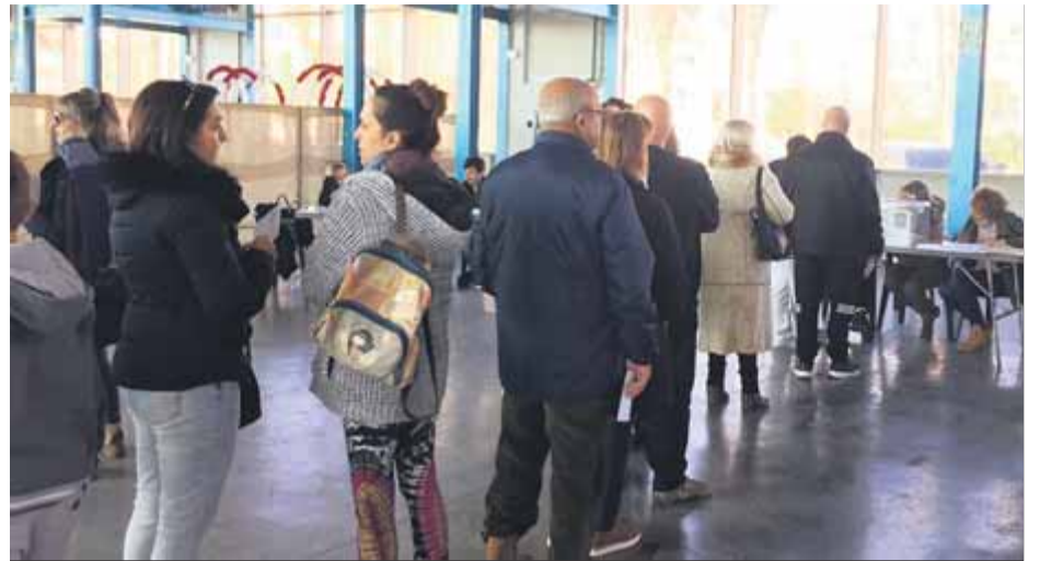
Veïns fent cua per votar l'1-0 a Sant Carles de la Ràpita, on va haver-hi càrregues policials