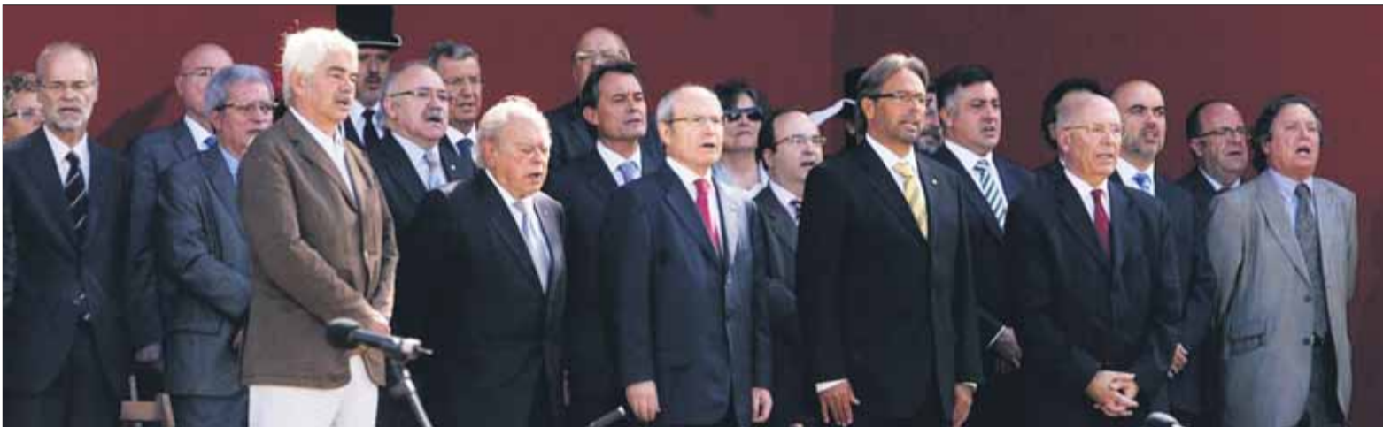
Acte institucional de la Diada del 2010 al parc de la Ciutadella, amb els expresidents Pasqual Maragall i Jordi Pujol i el president Montilla