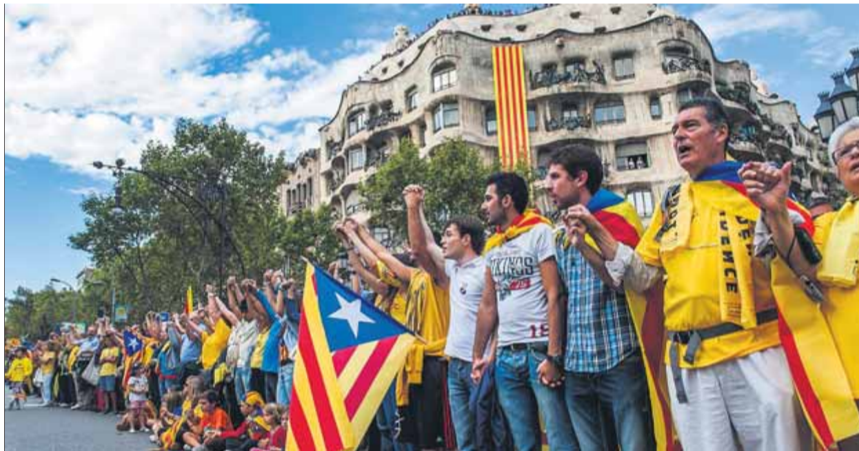
La Via Catalana del 2013, a La Pedrera, a Barcelona

Artur Mas, president de la Generalitat de Catalunya, havia entomat prèviament aquest repte, però entrats en l'últim quadrimestre de l'any encara no hi havia data ni pregunta. Aquell 2013 havia començat amb l'estrena d'una legislatura –Mas va ser investit el 24 de desembre de 2012– que havia d'abastir-se dels mecanismes legals per poder convocar un referèndum. El gener es posava fil a l'agulla amb l'aprovació al