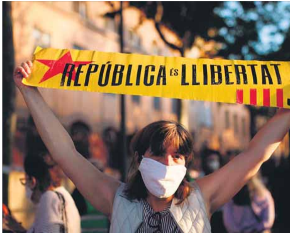
Una de les últimes manifestacions per la llibertat dels presos, del mes de juny, quan el Tribunal Suprem va anul·lar el tercer grau de què gaudien

El recull de les últimes diades comença amb la del 2010, que precisament encara no va ser tan multitudinària, però que ja havia viscut la primera gran manifestació contra l'Estat arran de la sentència del Tribunal Constitucional que retallava l'Estatut. N'hi ha hagut algunes amb un gran contingut polític i d'altres de molt imaginatives, però que no van perdre el to festiu fins que l'empresonament dels lí-