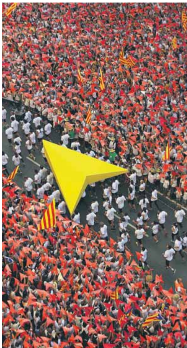
El 'punter' passant pel mig dels manifestants

Amb el tauler de joc dels comicis ja configurat, arribem a la Diada. Un cop més, l'independentisme