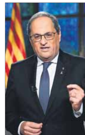
El president Torra

En el discurs també va recordar que enguany es