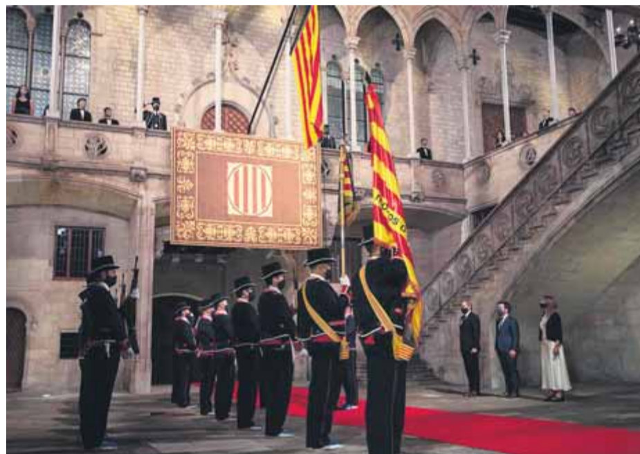
L'acte dels sanitaris i, a sota, l'institucional de la Generalitat ■ PARLAMENT / GOVERN