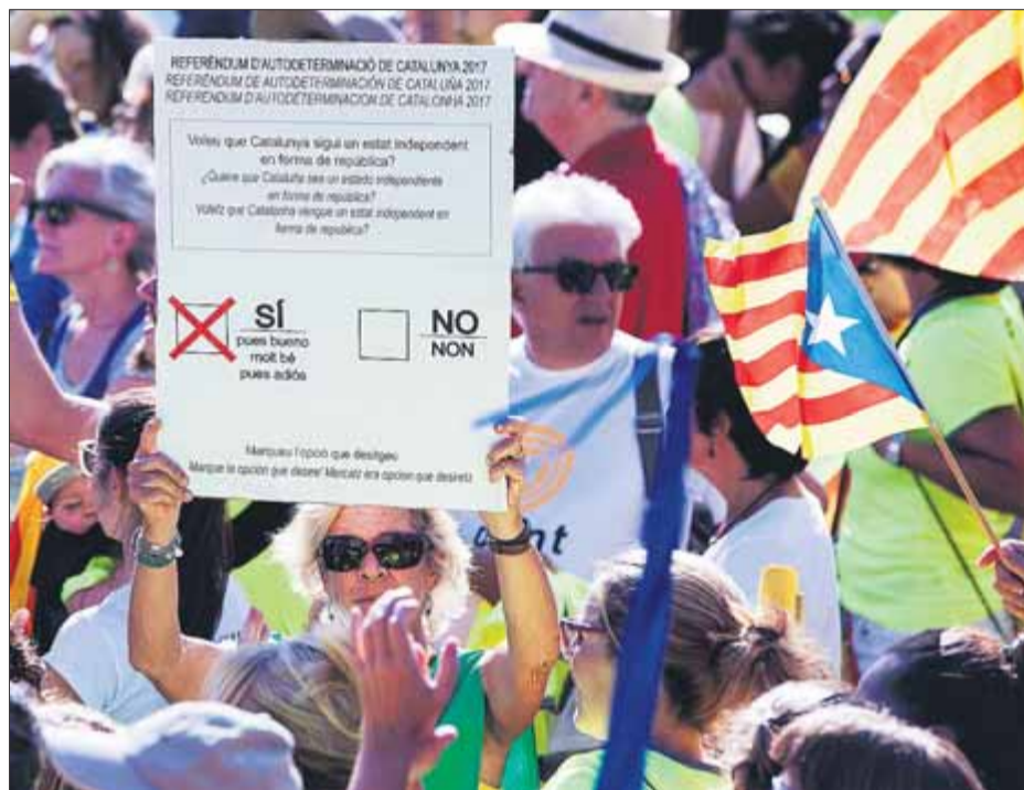
Una manifestant aixeca una rèplica gegant d'una butlleta del referèndum

Enmig d'un estira-i-aronsa sense precedents entre els governs català i espanyol, Barcelona vivia