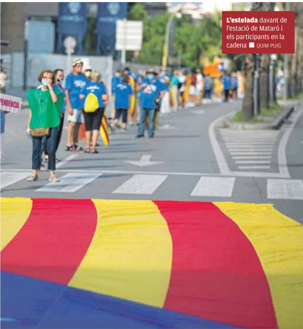
L'estelada davant de l'estació de Mataró i els participants en la cadena