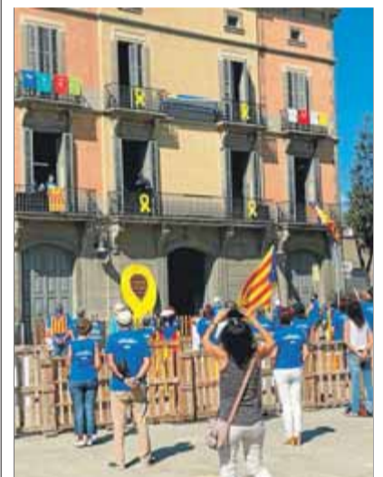
Manlleu. En aquesta ciutat d'Osona la concentració estàtica convocada per l'ANC es va fer al matí a la plaça Dalt Vila i va reunir unes 300 persones. Es va llegir un text en honor del caiguts l'any 1714, es va desplegar una gran pancarta amb el lema d'enguany i es va cantar 'Els segadors'. A la tarda va ser el torn de l'acte de l'esquerra independentista.