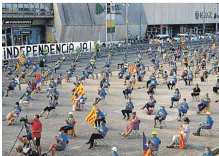
Els concentrats a Girona, davant l'estació de Renfe