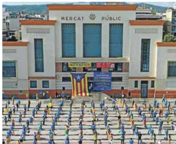
Vilanova i la Geltrú. La capital del Garraf va ser una de les escollides per l'ANC per la celebració de la Diada descentralitzada a causa de la Covid-19. La plaça del Mercat va ser l'escenari d'un reivindicació de marcat caràcter social