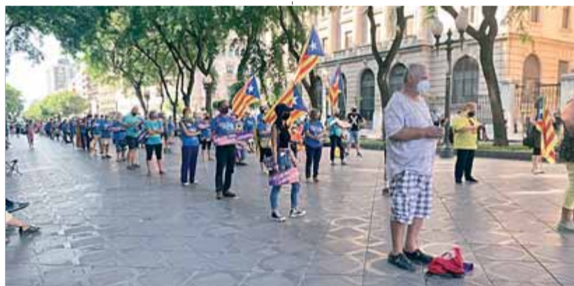
Tarragona. Unes 800 persones es van reunir a la capital del Tarragonès en un acte que va servir per reivindicar uns impostos justos per a Catalunya. L'acte, organitzat per l'ANC i Òmnium, va consistir en una manifestació estàtica en diferents punts de la Rambla, des d'Hisenda fins a la plaça Imperial Tàrraco.