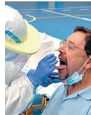
Un sanitari fa una PCR durant un cribratge ■ ACN

El total de persones contagiades a Catalunya des de l'inici de la pandèmia confirmades amb proves PCR s'eleva a 120.324. Pel que fa a les