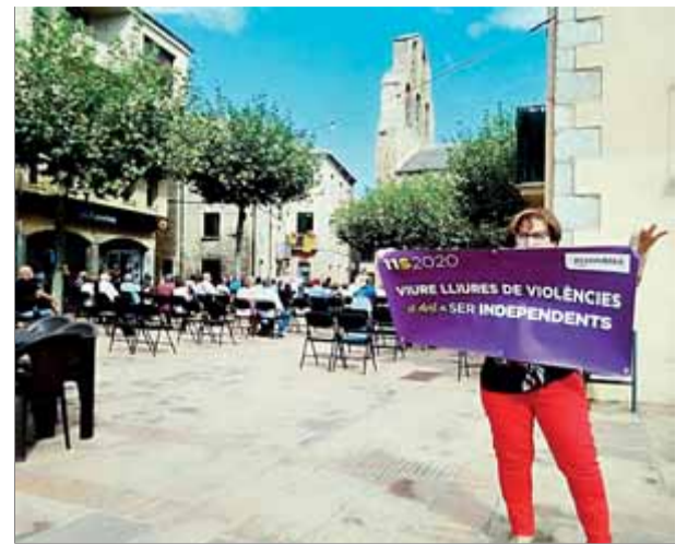
Agullana. Aquesta població de l'Alt Empordà va ser, junt amb Cornellà, Reus, Tarragona, Barcelona, Badalona i Lleida, una de les triades per la sectorial de dones de l'ANC per fer visibles les reivindicacions feministes amb els punts liles.