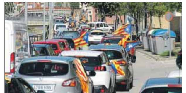
Centenars de vehicles van envair al matí els carrers de Terrassa fent sonar clàxons i lluint estelades ■ J.A.

i, pel que es va poder veure, com a mínim la xifra va ser el doble o més. Entre el públic, diversos grups de joves tocant el tambor i moltes parades amb venda de samarretes i tot tipus de marxandatge independe . ■