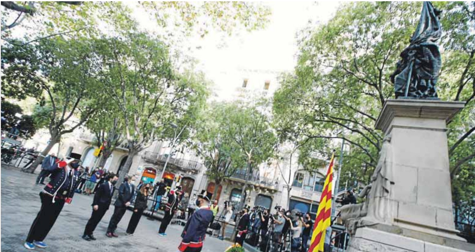
El president, Quim Torra; el vicepresident, Pere Aragonès, i la consellera de la Presidència, Meritxell Budó, ahir al peu del monument a Casanova