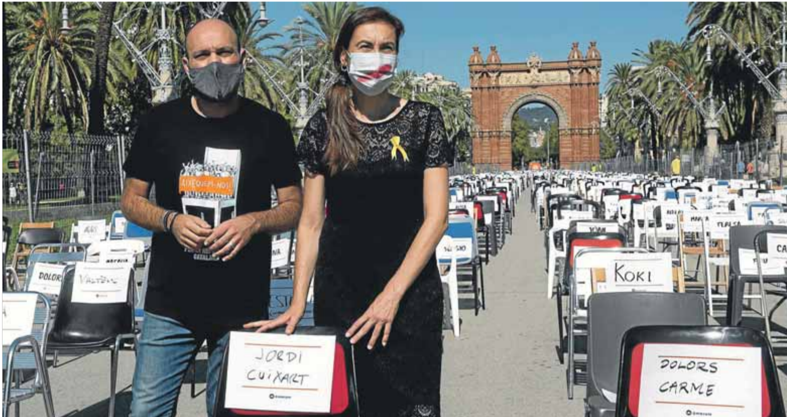
Marcel Mauri i Txell Bonet posen el nom de Jordi Cuixart, president d'Òmnium, en una de les cadires buides al passeig Lluís Companys, ahir

■ L'entitat planta al passeig Lluís Companys milers de cadires buides amb noms dels presos, exiliats i independentistes perseguits des del 2017 ■ Insta l'Estat a reconèixer el dret a l'autodeterminació