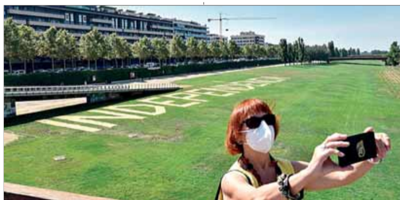
Lleida. A la capital del Segrià l'acte descentralitzat organitzat per l'ANC, amb el suport d'una vintena d'entitats més, va ser una marxa de vehicles, com al matí s'havia fet al Vallès i a la Cerdanya. Hi van participar prop de 250 cotxes. Al matí també hi va haver un acte de l'esquerra independentista. ■ FOTO: EFE