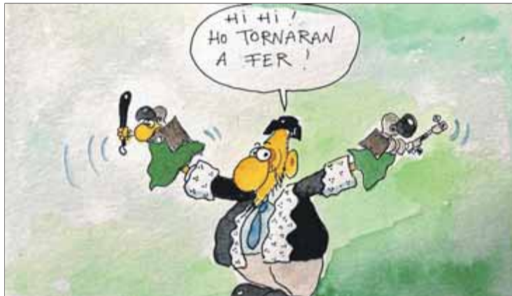
Fer, El Punt Avui , 11 d'octubre del 2019

L'actitud negativa contra Catalunya té molts anys. Si bé Miguel de Cervantes va dedicar dues línies a parlar bé de Barcelona a El Quijote , Francisco de Quevedo ens va dedicar una sèrie de poesies que ens deixaven