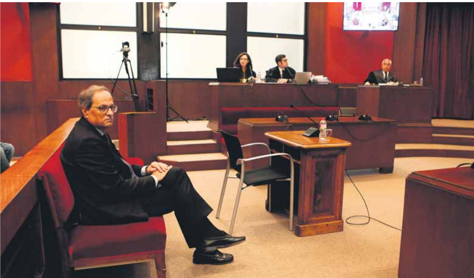
El president Quim Torra, assegut al banc dels acusats en el judici per desobediència al TSJC el 18 de novembre passat