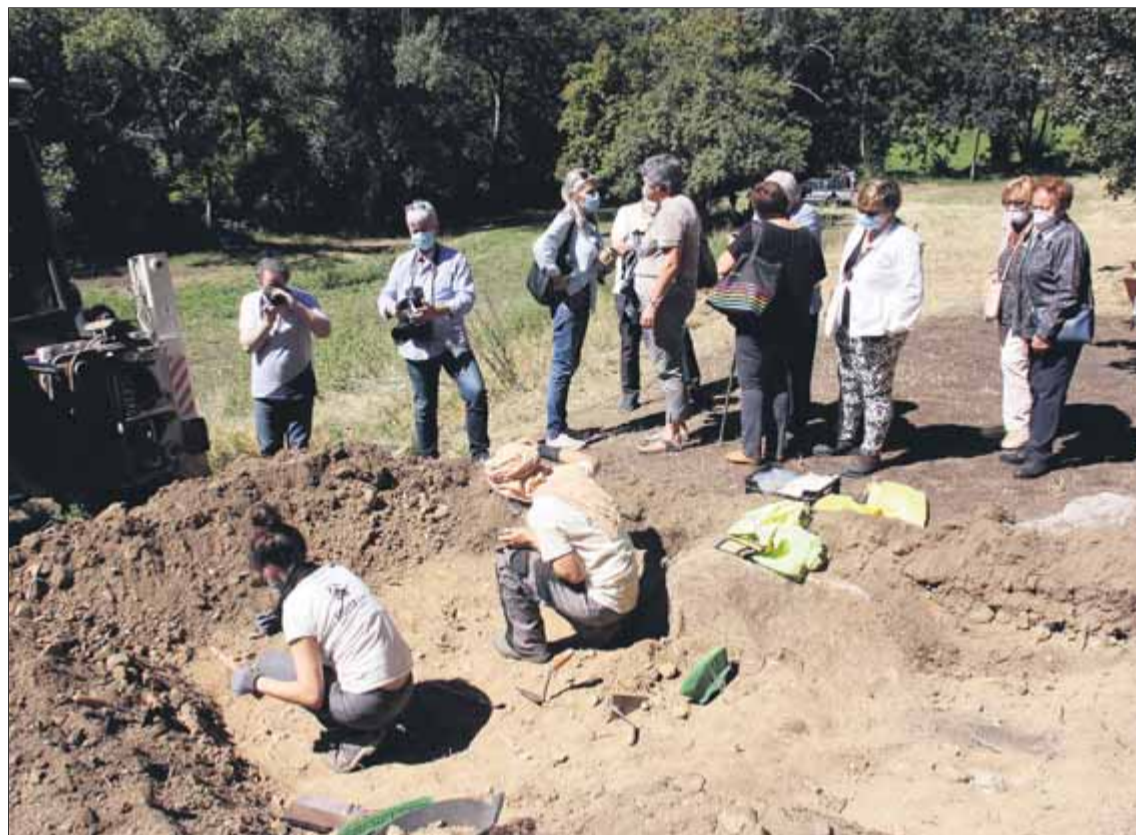
Excavació d'una fossa a Alt Àneu, aquest mes, en presència de familiars de possibles enterrats al lloc