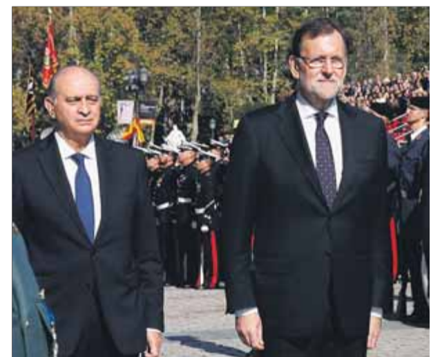
L'expresident Rajoy i el llavors ministre de l'Interior, Jorge Fernández Díaz, en un acte del 2015