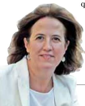
Elisenda Paluzie. Presidenta Assemblea

A la presidenta de l’Assemblea, Elisenda Paluzie, la vam veure dijous fent costat a Quim Torra a les portes del Suprem, juntament amb altres entitats i partits sobiranistes. Una possible inhabilitació del cap de l’executiu seria, segons ella, “l’enèsima ingerència de l’Estat contra la sobirania del poble de Catalunya i una condemna a la llibertat d’expressió mateixa; també significaria constatar una vegada més la impotència de l’autonomia i els seus límits, i