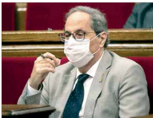
El president Torra en el ple de política general d'aquesta setmana al Parlament ■ JOSEP LOSADA