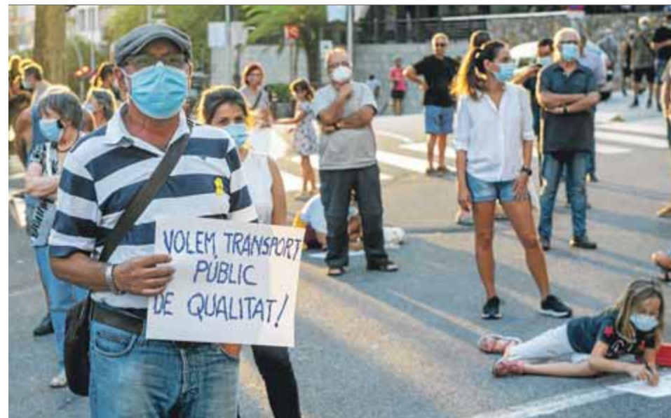
'Confinem els cotxes'. La pandèmia fa augmentar l'ús del vehicle privat. A Santa Coloma de Gramenet ahir es va reprendre la campanya per la millora de la qualitat de l'aire