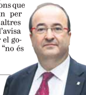
Miquel Iceta Primer secretari del PSC

Davant del que considera una cita electoral inevitable, Iceta demana a Torra que sigui ell com a president i no la sentència del Suprem qui posi data: “És millor per a Catalunya que sigui el president qui convoqui eleccions que no que se celebrin per efectes induïts per altres institucions.” I l’avisava que deixar allargar el govern quatre mesos “no és la solució”.