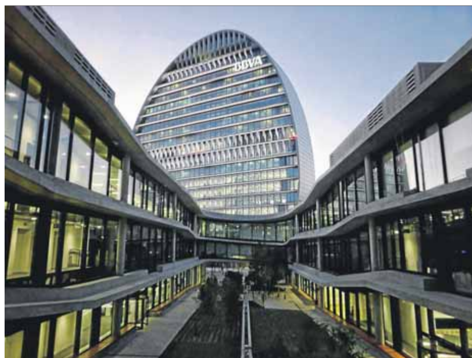
Les finances sostenibles permeten contribuir a la lluita contra el canvi climàtic ■ BBVA

El març del 2019, el banc va liderar la seva primera línia de crèdit RCF sostenible al Regne Unit