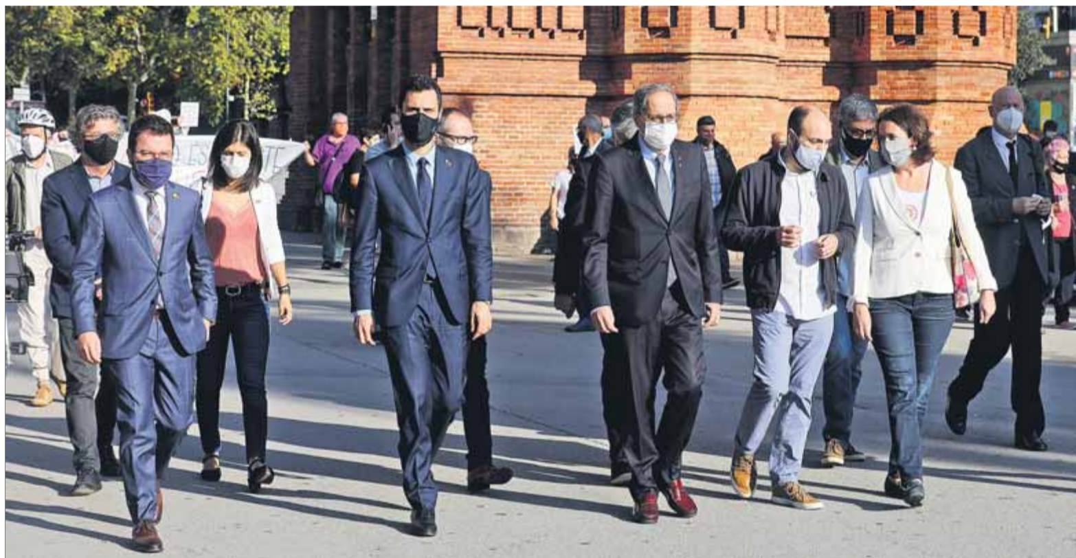
El president Quim Torra, acompanyat de la resta d'autoritats, en el seu camí cap al Tribunal Superior de Justícia de Catalunya

El ministre de Justícia anuncia que inicia els tràmits per als presos polítics L'independentisme manté que l'única via és la llei d'amnistia