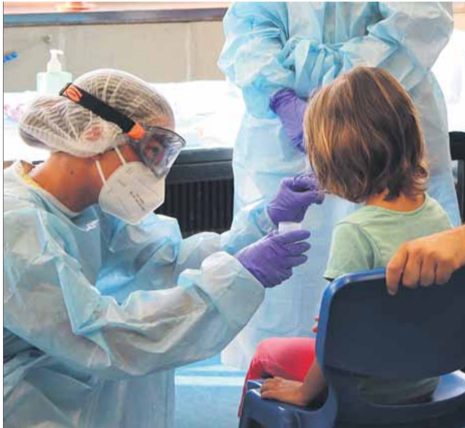
Proves a un nen aquest estiu durant l'estudi Kids Corona, a Sant Joan de Déu

Els centres educatius, d'acord amb els serveis de vigilància epidemiològica i els serveis territorials d'educació, establiran si és millor fer les proves PCR al mateix centre, en un espai alternatiu o bé que es concerti amb el CAP de referència un dia i hora perquè hi vagin els companys de l'alumne contagiats a fer-se el test. El centre ho comunicarà a les famílies, igual que el moment en què començarà l'aïllament, segons Cuenca. Un equip mòbil es desplaça a les escoles on es fan les proves, uns equips que ara mateix s'estan reforçant i que no sempre arriben amb la celeritat desitjada. "En la majoria de casos les proves es fan en 24 hores, en alguns es triga dos o tres dies", segons Cuenca, i la indicació de la Generalitat és que es vagi a classe fins que arribi aquest equip a fer les PCR. Tenint en compte que les escoles treballen amb grups aïllats, "que estiguin dos dies en espera no supo-