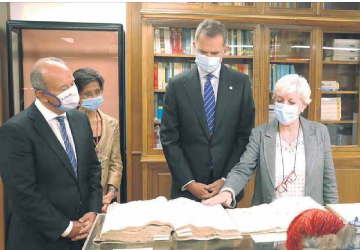
El ministre Campo, el rei Felip i la presidenta del Tribunal de Comptes, De la Fuente, ahir en aquest ens estatal