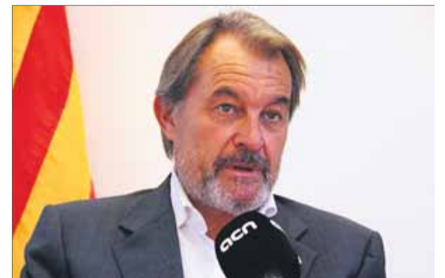
L'expresident de la Generalitat, Artur Mas, durant l'entrevista concedida a l'ACN

■ L'expresident fa de mitjancer perquè s'hi puguin integrar com a independents