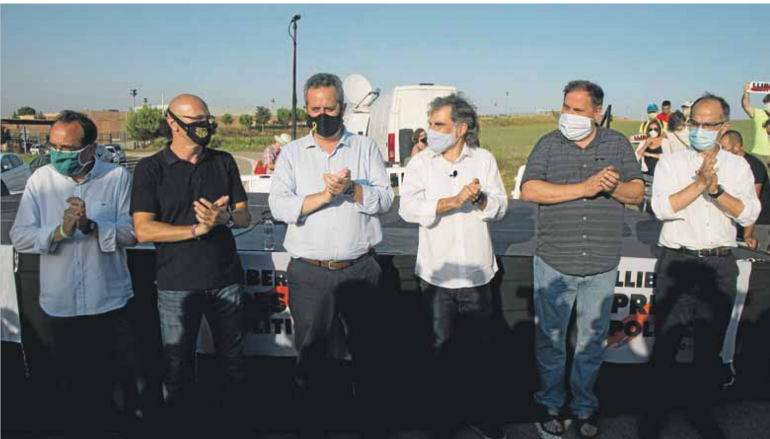
Rull, Romeva, Forn, Cuixart, Junqueras i Turull, el juliol passat, abans de tornar a ingressar a la presó de Lledoners