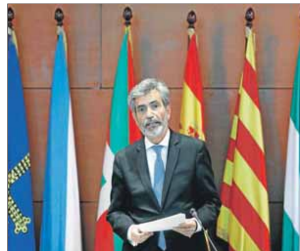
El president del CGPJ i del Suprem, Carlos Lesmes, divendres passat en l'acte de Barcelona

ciutadania en les institucions públiques i deteriora els estàndards democràtics". El mandat de cinc anys del ple del Poder Judicial va caducar el desembre del 2018 i el president del CGPJ i del tribunal, Carlos Lesmes, ha demanat en diverses ocasions que els partits facin la renovació de càrrecs. ■