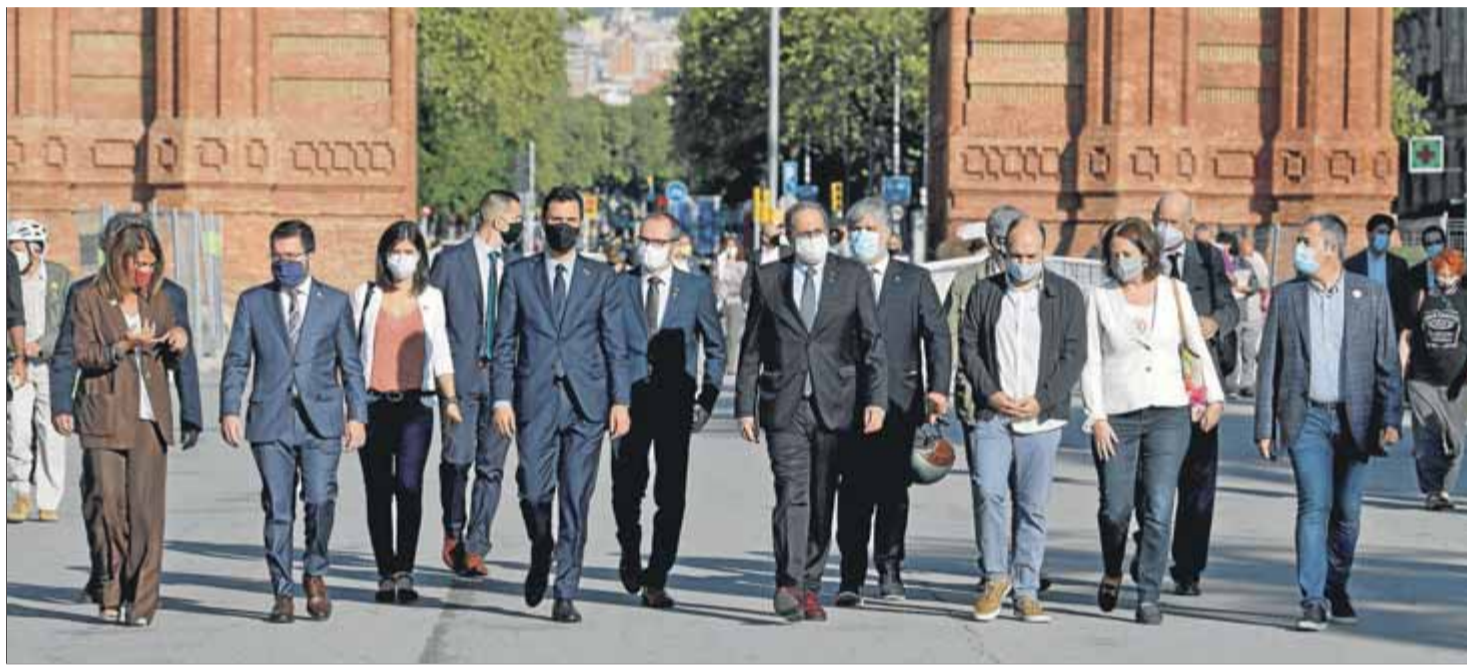
El president Quim Torra, acompanyat de membres del govern, del Parlament, partits i entitats, dirigint-se dimecres al TSJC

seva satisfacció en una entrevista a Vilaweb per "haver-los empenyat tant" i el consideressin "com una pedra a la sabata". Interrogat sobre la seva inhabilitació, va assegurar que tot el que havia passat aquests anys "mostra els límits de l'autonomia": "Tenim un Parlament que no pot aprovar les resolucions que pren, tenim 2.850 represaliats i és possible que ens trobem amb un president inhabilitat per haver defensat la llibertat d'expressió." Per això pensa que "no podem anar topant contra les costures de l'autonomia i quedar-nos dins aquests límits" i defensa "una ruptura democràtica" davant "la conclusió que un dels obstacles per assolir la independència és l'autonomia".