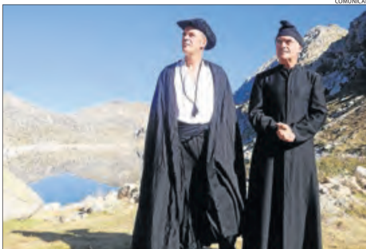
Vestuari d'època cedit pel Museu Hidroelèctric de Capdella.

Els figurants són veïns de la Vall Fosca i part del vestuari d'època que llueixen per a la pel·lícula ha estat cedit pel Museu Hidroelèctric de Capdella, que també ha aportat diversos elements d'ambientació, com per exemple articles de pesca o ornaments per a cavalleries.