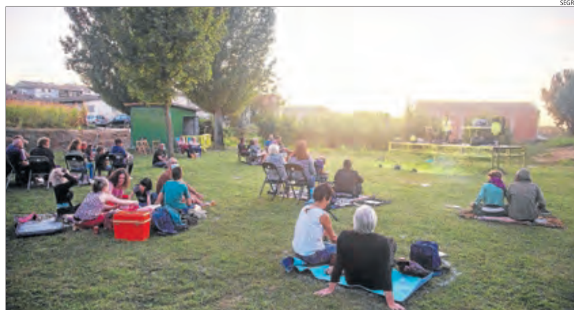
Un concert de Joan Colomo i Selektah Elektra va clausurar dijous el festival d'estiu de Tornabous.

Veïns de la Vall Fosca es converteixen en figurants per a aquest documental històric, amb vestuari d'època cedit pel Museu Hidroelèctric de Capdella.