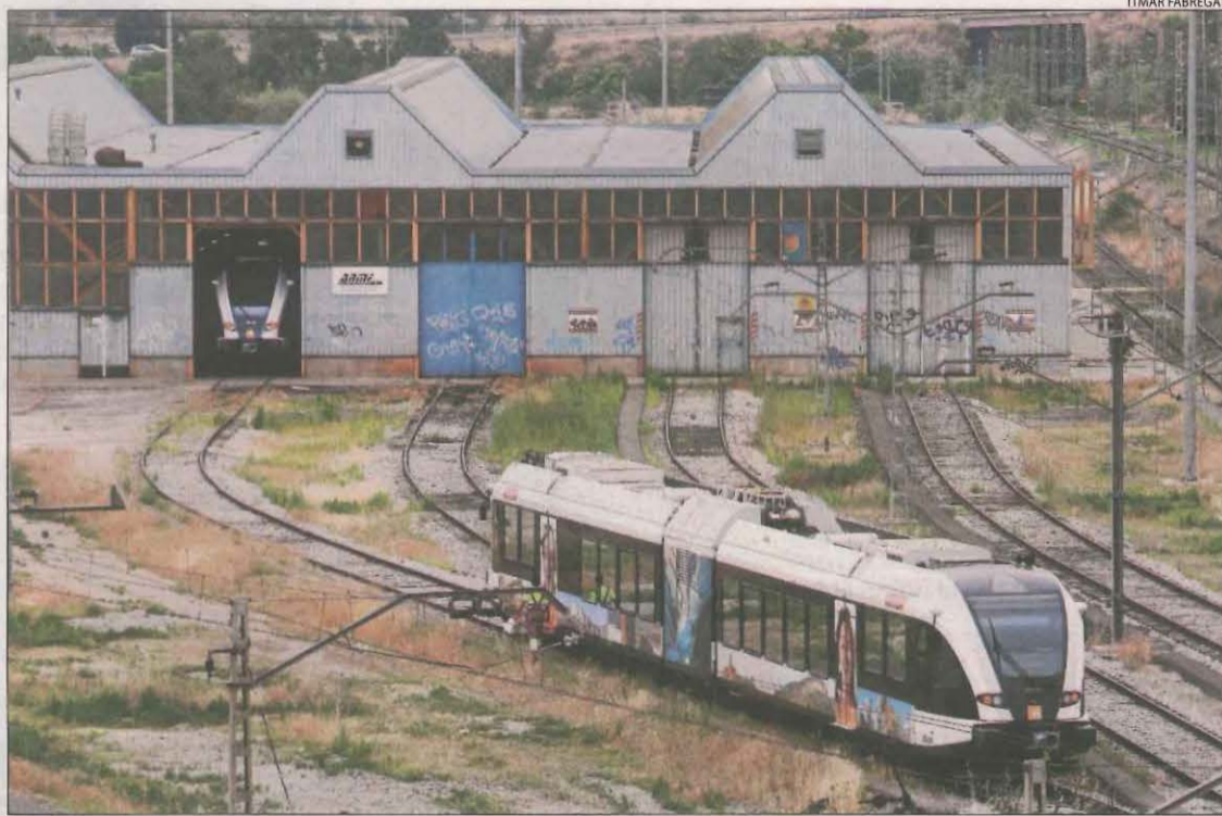
El comboi reparat està estacionat al Pla de Vilanoveta de Lleida.

L'objectiu de l'empresa pública és que la certificació del comboi estigui llesta coincidint amb l'inici del curs escolar. Fonts d'FGC van confirmar ahir que el tren està reparat des del mes de juliol passat però que la pandèmia del Covid-19 ha impossibilitat que tècnics suïssos es desplacin fins a Lleida per poder fer-ne la certificació. "El tancament de les fronteres i el confinament del Segrià aquest estiu han retardat l'entrada en servei del comboi, prevista inicialment per al mes d'agost", van dir des de Ferrocarrils. Malgrat això, FGC no vol dilatar més la posada en servei del tren i exigeix a la firma Stadler que trobi