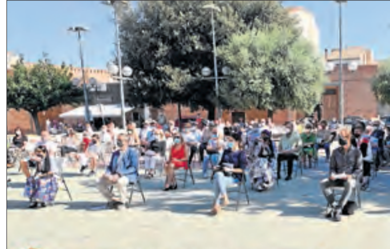
Torres de Segre. En aquesta localitat, els actes es van celebrar a la plaça dels