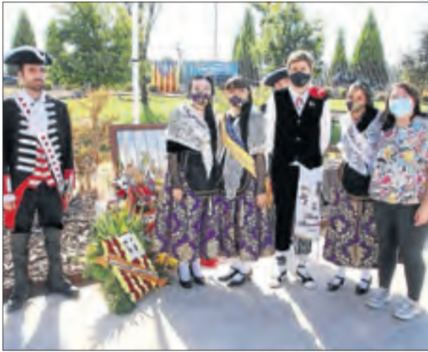
Almacelles. Tradicional ofrena floral.