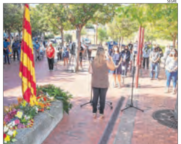
Tàrraga. L'acte oficial de la Diada celebrat a Tàrraga.