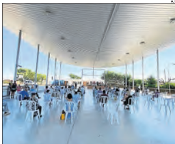
Torre-serona. Diada amb totes les mesures de seguretat.