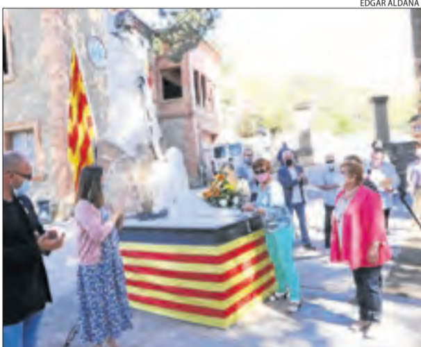
La Pobla de Segur. El Pirineu es va omplir també d'ofrenes.