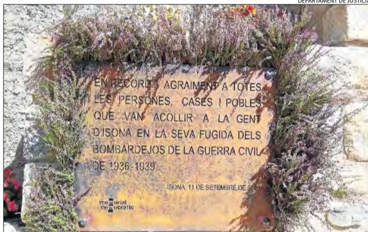
Placa commemorativa de l'homenatge que es va dur a terme ahir.

Isona va ser un dels municipis catalans que més van patir els efectes del conflicte bèl·lic. L'abril del 1938, les tropes de Franco van entrar a Catalunya i van establir un front vertebrat