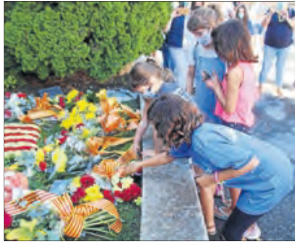
Bellpuig. Ofrena a la qual va seguir una marxa de cotxes.