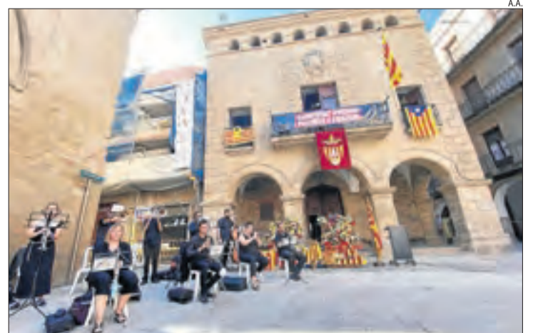
Agramunt. La música va presidir els actes en aquesta localitat.