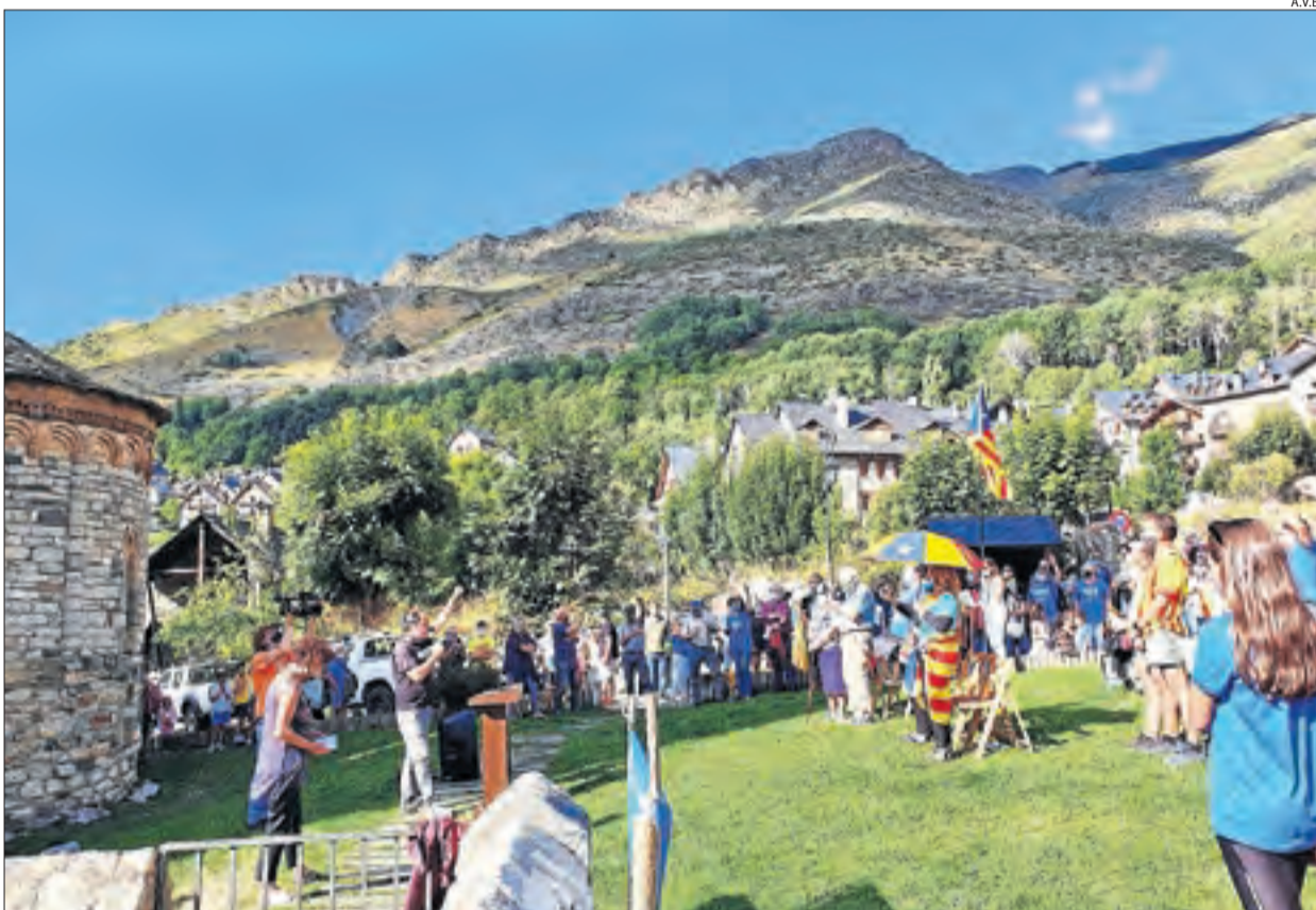
La Vall de Boí. La mobilització de l'ANC a l'Alta Ribagorça es va celebrar davant de l'església de Sant Climent de Taüll.