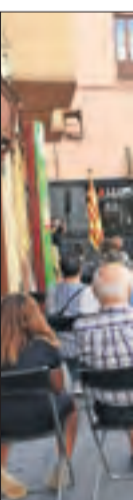
La Seu d'Urgell