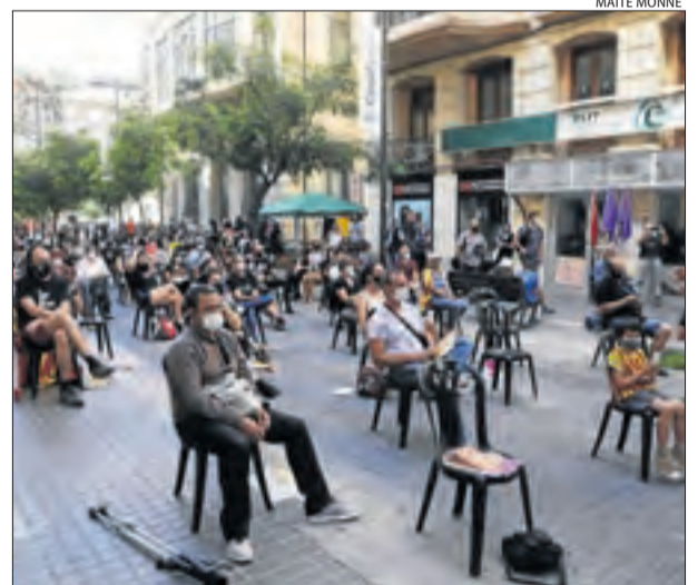
Lleida. Acte de la CUP a l'avinguda Blondel.