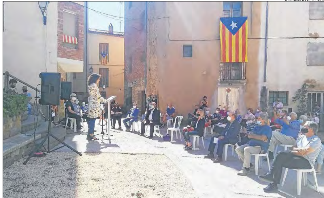
Isona i Conca Dellà va homenatjar ahir els veïns que van haver de fugir durant la Guerra Civil.