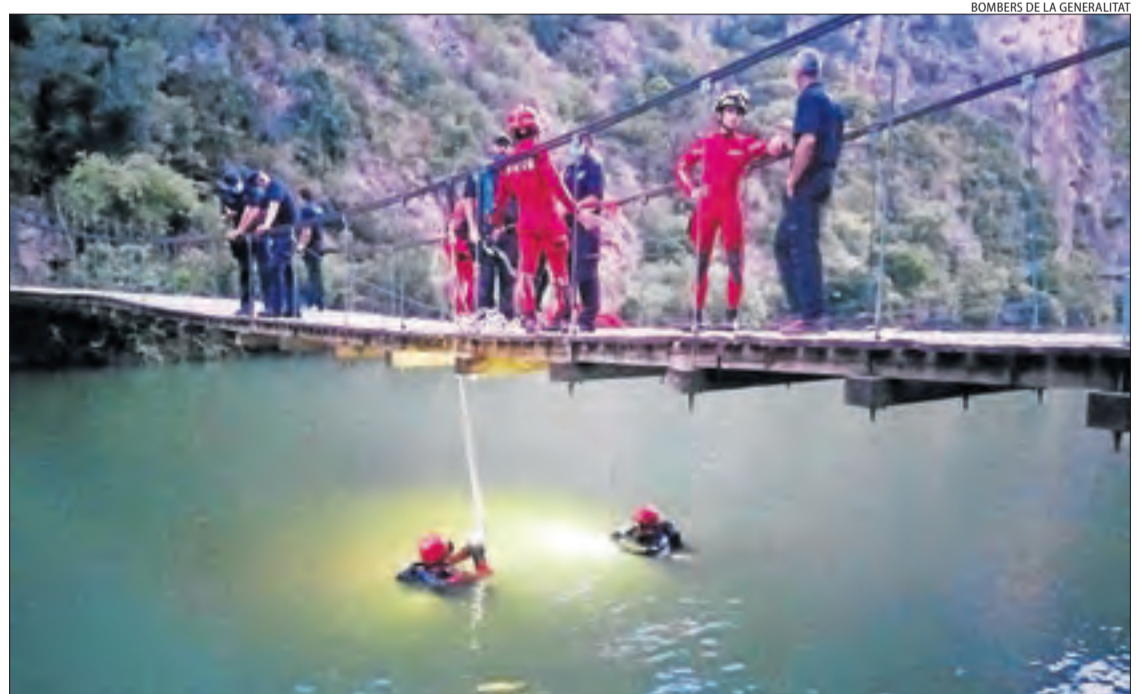
El cos sense vida del jove va ser trobat per membres de la unitat subaquàtica dels Bombers.

Els Bombers van fer ahir dos rescats de muntanya a Fígols i Alinyà i Vielha