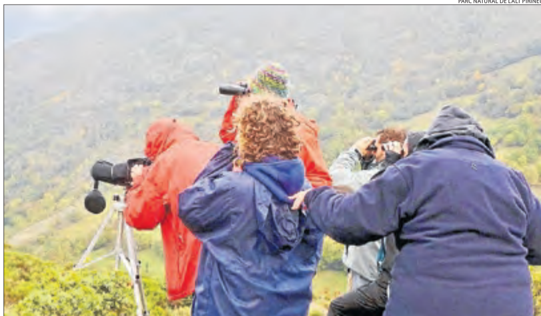
PARC NATURAL DE L'ALT PIRINEU

Turistes a la reserva per observar i sentir la brama del cérvol en una imatge d'arxiu.