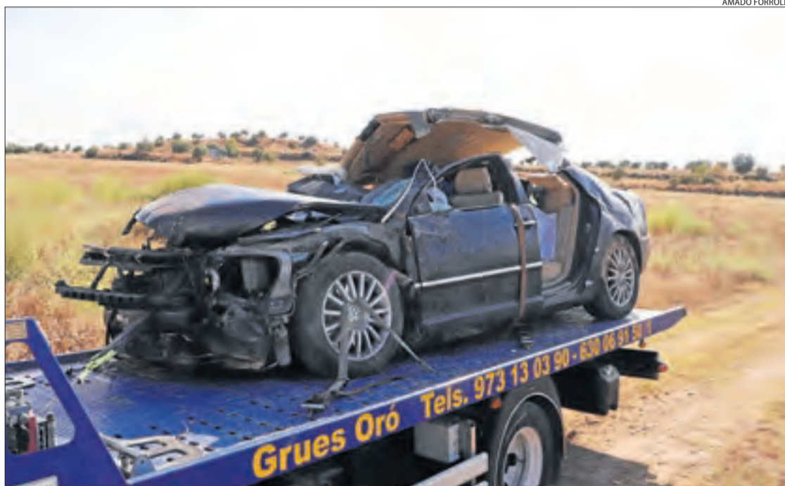
Estat en el qual va quedar el vehicle després de l'accident.

L'accident es va produir a les 14.19 hores al quilòmetre 19 de la carretera C-230a quan, per causes que es desconeixen i s'estan investigant, un turisme va tenir una sortida de via i va fer diverses voltes de campana. El conductor i únic ocupant va resultar ferit d'extrema gravetat