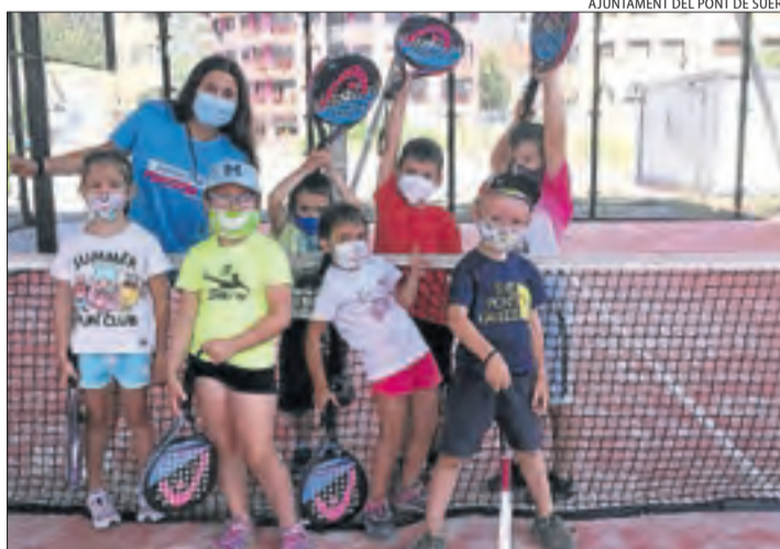
AJUNTAMENT DEL PONT DE SUERT

Un dels grups participants en els casals.