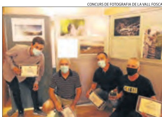
CONCURS DE FOTOGRAFIA DE LA VALL FOSCA