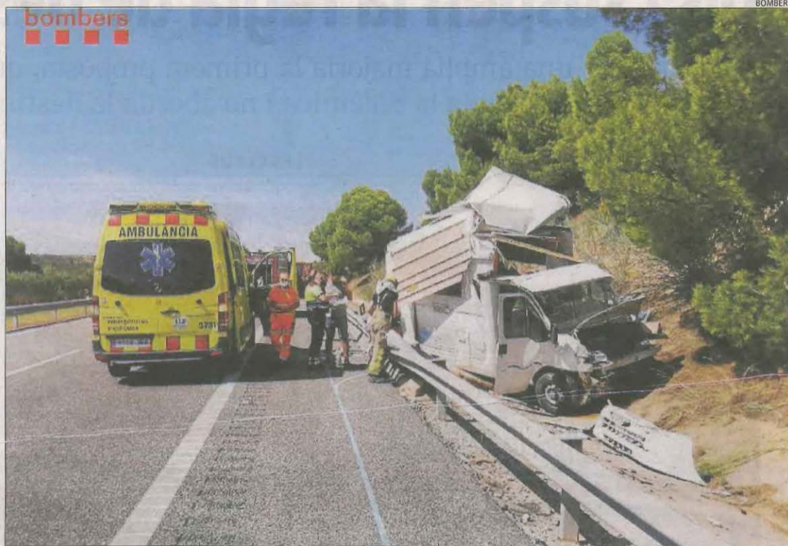
Estat en el qual va quedar l'autocaravana després de l'accident.

L'accident es va produir uns minuts abans de les 8.00 hores quan la menor acudia acompanyada per la seua mare al centre educatiu coincidint amb l'inici del curs escolar, segons va informar la Policia Local a aquest diari. Fins al lloc es va desplaçar una ambulància del SEM així com dos patrulles poli-