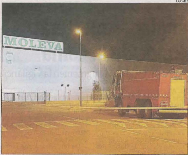
Imatge del carrer tallat i un camió de Bombers a la zona.

producte s'escampés i van tallar l'avinguda Pau Casals preventivament i com marca el protocol. Paral·lelament, es va desplaçar des de Tarragona una altra cisterna de l'empresa afectada per fer el transvasament de l'etanol alimentari, segons van explicar els Bombers. El tràiler va arribar cap a les 19.45 hores i es va procedir a transvasar el líquid. Durant els treballs, els Bombers van quedar-se a la zona de guàrdia.