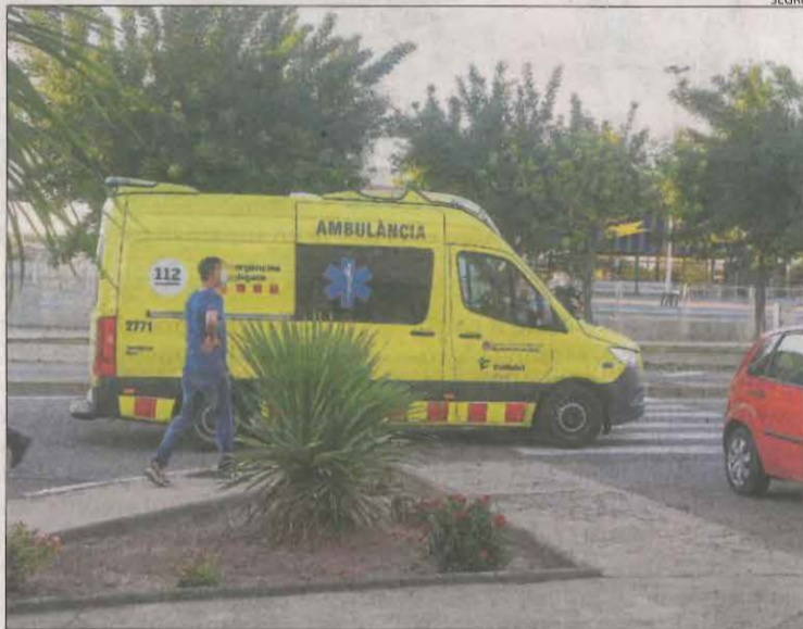
Una ambulància al lloc de l'atropellament a Tàrrega.

D'altra banda, un motorista va resultar ferit a última hora de la tarda d'ahir després de patir una caiguda a Àger. Els serveis d'emergència van rebre l'avís a les 19.30 hores i el seu pronòstic era lleu.