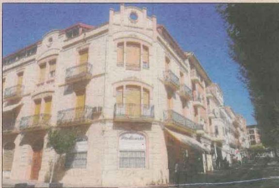
La iniciativa es proposa modernitzar el sector.

Tremp comença avui un curs pràctic de 6 hores destinat al comerç, amb l'objectiu d'actualitzar el sector. En tres sessions de dos hores, s'impartirà Creació d'un córner de producte específic , el segon curs gratuït dels quatre previstos per als comerciants locals. Els assistents aprendran a buscar en el seu local un espai que cridi l'atenció i atregui el consumidor, amb l'objectiu de dinamitzar espais buits de l'establiment.