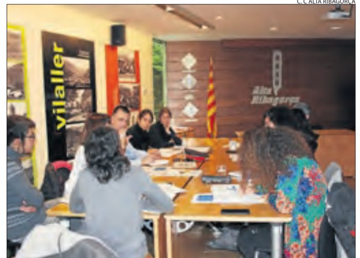
Formació de docents ■ El consell de Ribagorça a través de la Taula de Salut ha posat en marxa uns cursos de formació a docents i tècnics sobre afectivitat i sexualitat que s'allargaran fins al 18 de març.