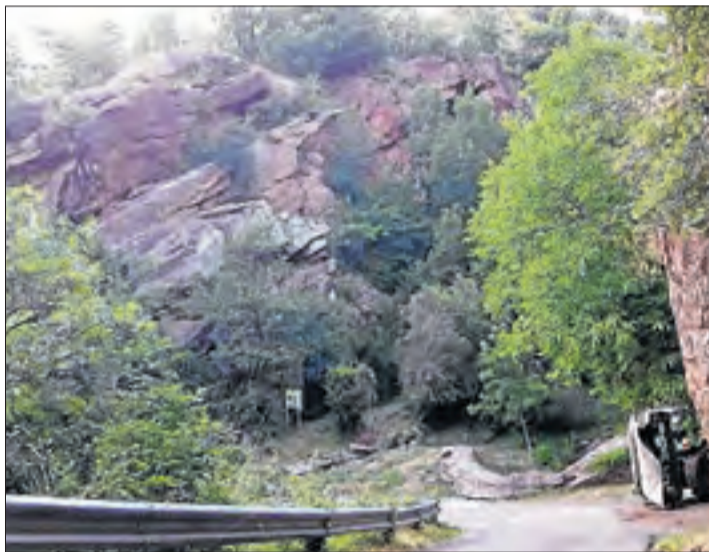
Carretera d'accés al nucli de les Llagunes, a Soriguera.

LLEIDA | El consell del Sobirà invertirà aquest any 318.000 euros en la millora i manteniment de la xarxa veïnal i accessos als nuclis. L'objectiu del consell és millorar l'estat de conservació d'alguns d'aquests accessos més deteriorats i la seguretat en la circulació en aquestes vies de muntanya. El president de l'ens comar-