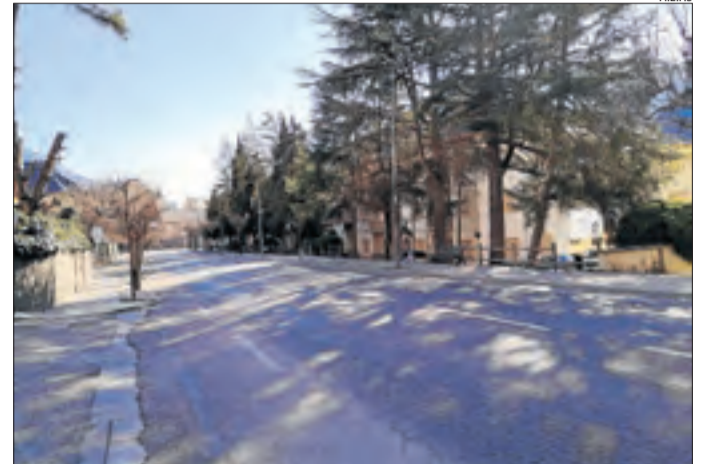
El tram de l'avinguda Victoriano Muñoz que s'intervé.