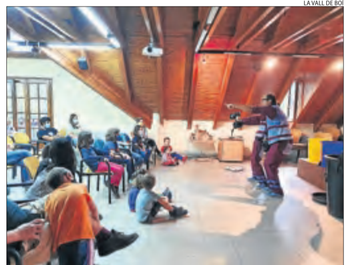
Cultura en família a la Vall de Boí ■ La Vall de Boí va acollir ahir l'espectacle familiar del cicle De Ponent als Pirineus de l'IEI, a càrrec de la companyia Fadunito, per col·laborar amb l'organització de festivals artístics i apostar per la cultura.