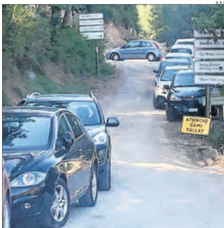
A. B. R.

La Generalitat aposta per regular de manera consensuada amb cada territori l'accés a aquests enclavaments, no de manera homogènia sinó específica a cada zona i que doni solucions concretes en dies puntuals.