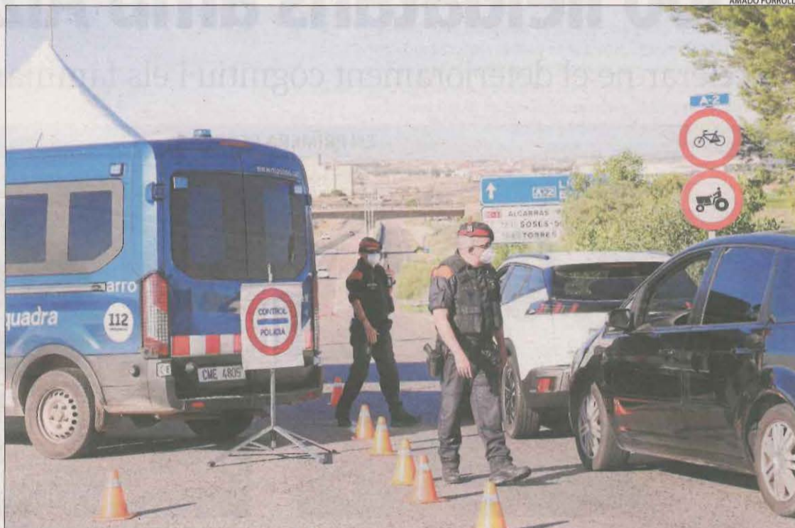
Controls policials el juliol passat després de decretar-se el confinament perimetral del Segrià.

Fonts de Salut van indicar a ACN que aquesta és una de les possibilitats amb què estan treballant, encara que va matisar que "es treballa amb totes les opcions" i que aquesta mesura només seria una de les que contempla. Encara no s'ha fixat una data per a la vacunació d'aquest any, però la campanya sol començar la tercera setmana d'octubre.