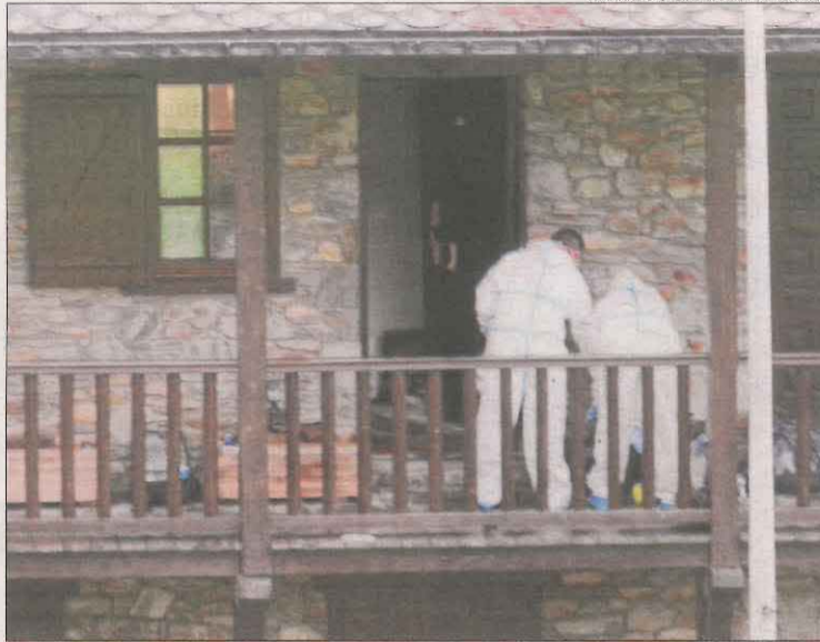
Agents de la policia científica, ahir a la casa a Encamp.

Segons va informar la policia andorrana en un comunicat, van ser els bombers els que van localitzar el cadàver de la víctima després de rebre l'avís a les 3.27 hores que una persona havia irromput en un habitatge i s'havia declarat un incendi. Una vegada iniciades les primeres investigacions, es va establir un dispositiu policial gàbia per evitar que el presumpte agressor fugís del país. Finalment, a primera hora del matí els agents van detenir un home de trenta-un anys a prop del Tarter acusat de l'assassinat. La detenció, segons fonts policials, es va fer "amb la col·laboració" del detingut, que hauria trucat per confessar el crim i