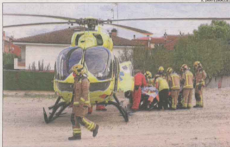
L'operari va ser traslladat amb pronòstic menys greu.