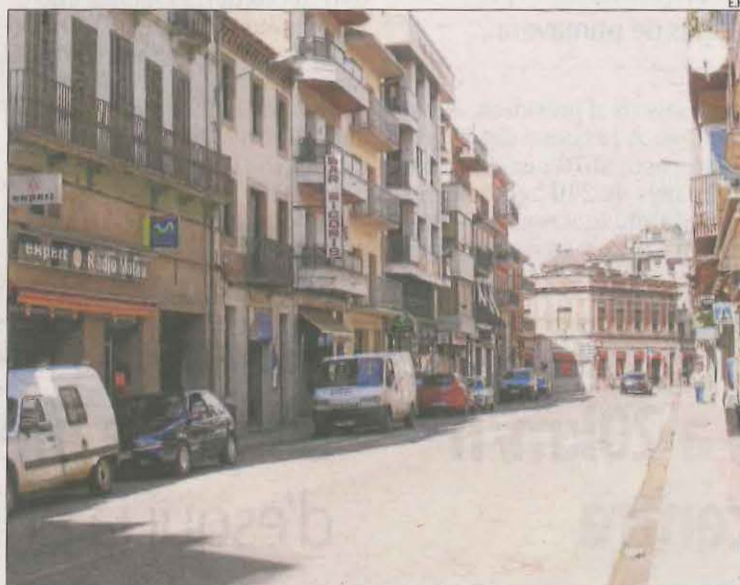
La nova variant evitarà el pas de vehicles pel centre.

Han iniciat una campanya a les xarxes socials contra la variant perquè, diuen, perjudicarà els seus negocis