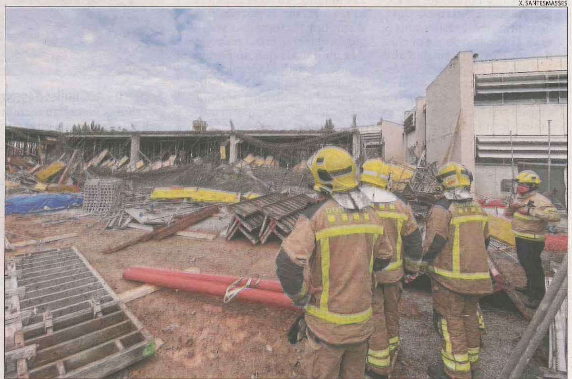
L'estructura, d'uns 15 metres de longitud i 7 de profunditat, es va esfondrar completament.

pilars de la primera planta del nou edifici. Va ser aleshores quan la superfície va començar a cedir i els operaris van sortir corrents per posar-se fora de perill, però un d'ells no va tenir temps de sortir i es va precipitar juntament amb l'estructura des d'uns quatre metres d'altura. Va