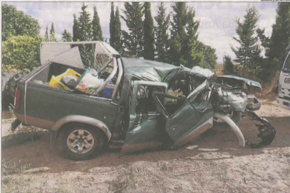
Vista del totterreny que conduïa la víctima i que es va accidentar ahir a Maials.

En el que va d'any, han mort setze persones en accidents a les carreteres lleidatanes, una xifra molt inferior a la registra-