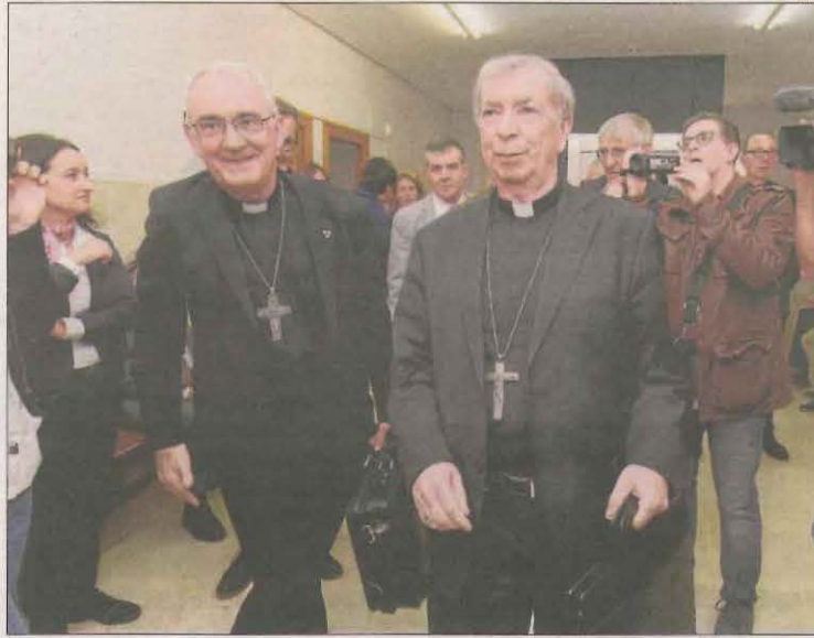
Els bisbes de Barbastre i Lleida, al judici a Barbastre el 2019.

Davant d'aquesta sentència, la primera reacció des de la Generalitat va ser reclamar al Suprem la seua competència "exclusiva" sobre aquests béns en litigi per estar inclosos en una col·lecció d'art que forma part del catàleg del patrimoni cultural de Catalunya des del 1999. El recurs de competència advocava per la unitat de la col·lecció d'obres d'art del Mu-