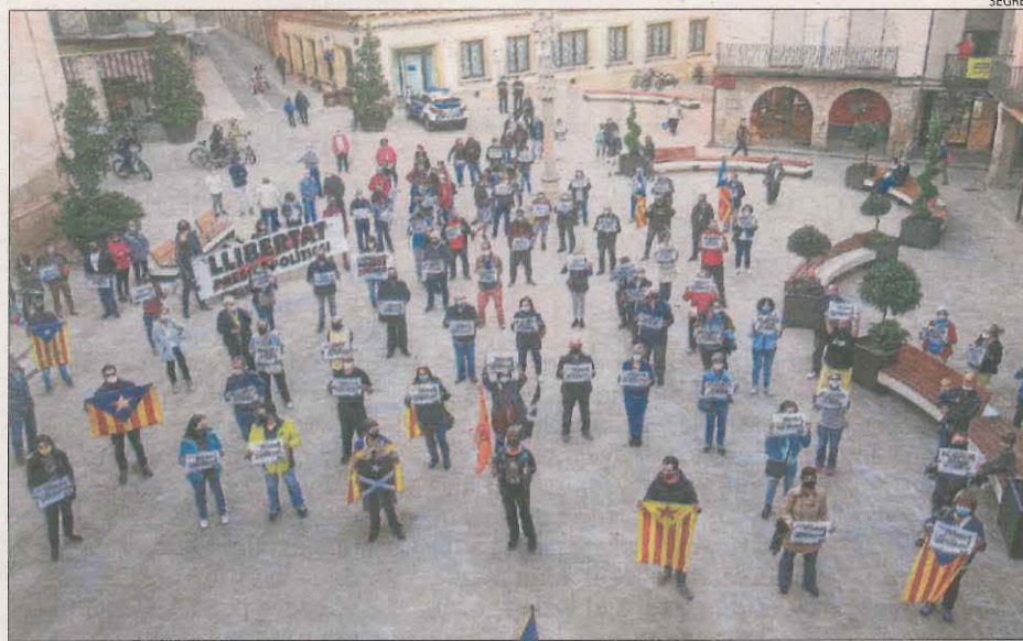
Tàrraga. Estelades i pancartes de suport al president Torra i a favor de la independència durant la concentració a Tàrraga. També pancartes per la llibertat dels presos sobiranistes.