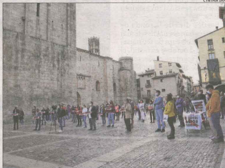
La Seu d'Urgell. Desenes de veïns de la Seu es van afegir a la repulsa a la inhabilitació del president Torra en una concentració a la tarda.