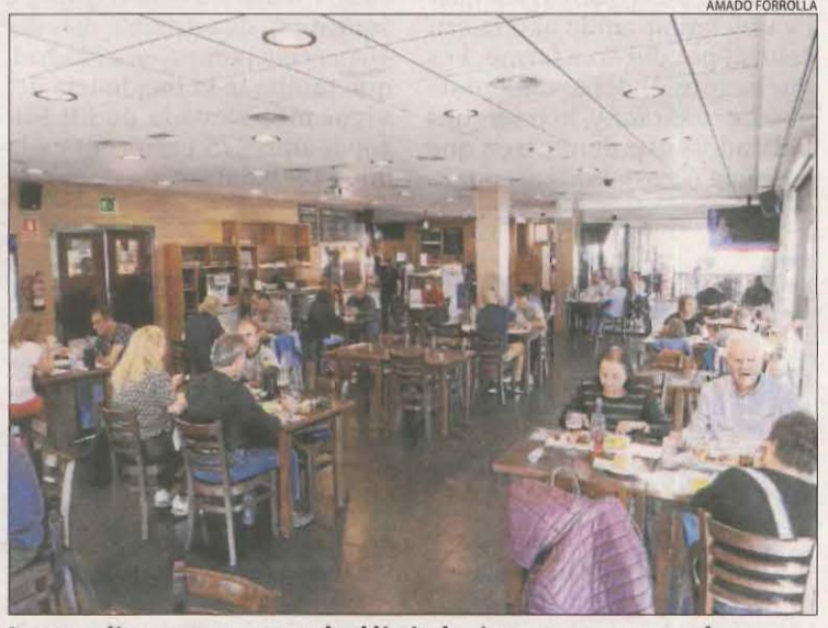
Imatge d'un restaurant amb el límit de sis persones per taula.

Així mateix, el departament de Salut va confirmar quatre decessos més per Covid a la província, que ja registra 337 morts des de l'inici de la pandèmia. Tots quatre tenien més de 70 anys. Un correspon al Pirineu, en concret a la Cerdanya, i aquesta regió sanitària acumula 31 defuncions, després que aquest mes hagi registrat els primers òbits des de l'abril.