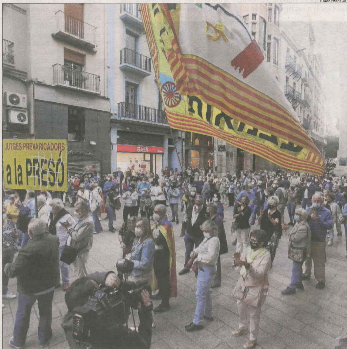
Lleida. Els manifestants es van reunir primer a la plaça Paeria, per després traslladar-se a la plaça de la Pau, davant de la subdelegació del Govern, que van envoltar assegant-se en cadires.