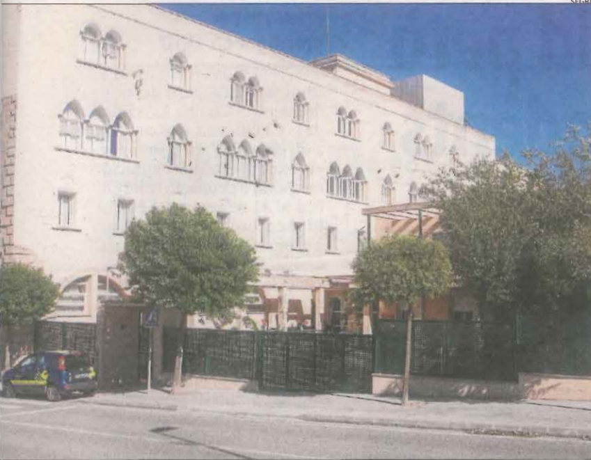
Imatge de l'exterior de la residència Monestir de Sant Bartomeu.