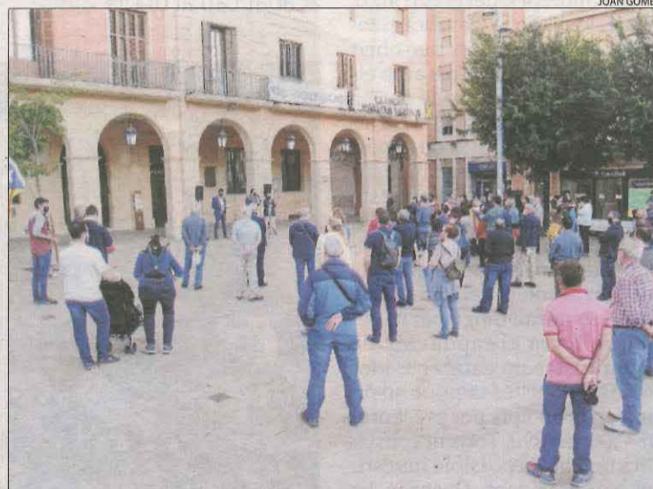
Mollerussa. La plaça de l'Ajuntament va reunir també a Mollerussa desenes de veïns, que van respectar les distàncies a causa de la Covid.