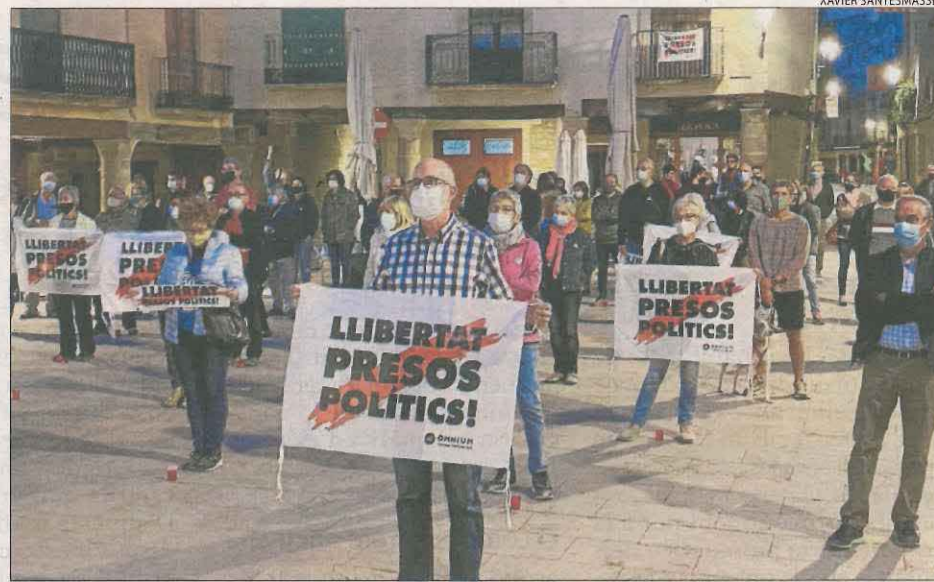
Cervera. Més d'un centenar de veïns van participar en la protesta de Cervera, convocada a la plaça Major. Entitats sobiranistes van promoure la lectura d'un manifest.