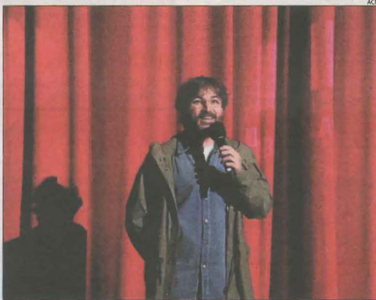
Jordi Évole va presentar dilluns el documental 'Eso que tú me das'.

El film arriba avui a 245 sales de tot el país i no estarà en altres plataformes fins a l'any que ve