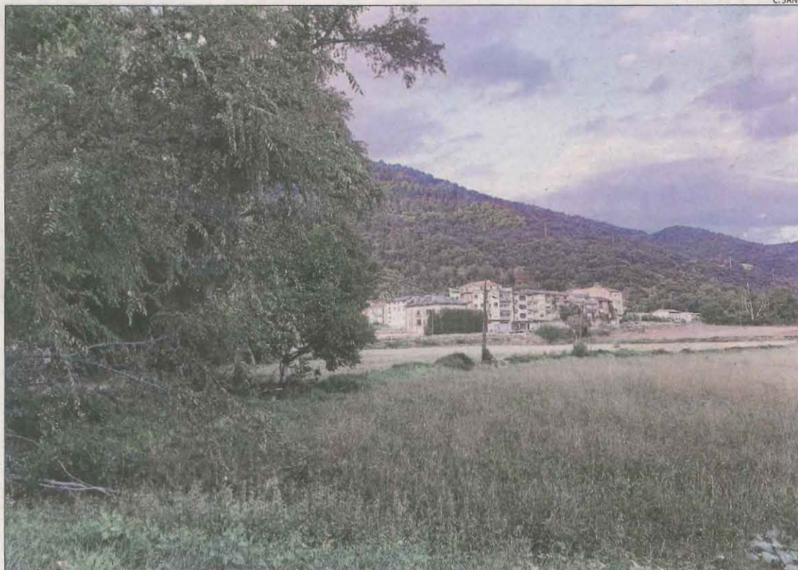
Els terrenys pendents d'urbanitzar pròxims al parc de bombers de la Seu.

Disposen de 9.000 metres quadrats al costat del parc de Bombers i 14.000 a l'Horta del Valira