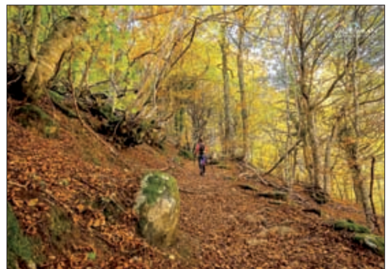
S'ofereixen activitats com el senderisme