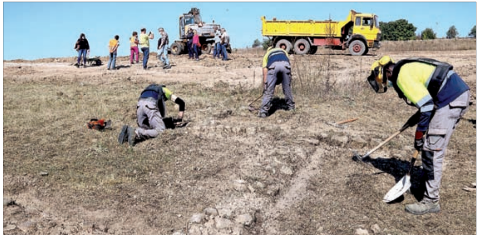
L'actuació inclou la senyalització d'un itinerari fins al nucli d'Isona i l'ampliació de l'excavació i la consolidació dels murs

La vil·la romana de Llorís està a molt pocs metres del poble d'Isona i és per aquest motiu que es condicionarà un camí que connectarà aquestes restes arqueològiques amb la població d'Isona, on encara es pot veure el que queda de l'antiga ciutat romana. La connexió entre la ciutat romana d'Aeso i la vil·la romana de