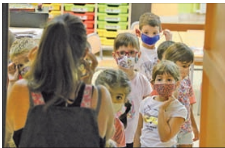
Un grup d'alumnes sortint de l'aula amb la mascareta

L'Ajuntament de Barbens (Pla d'Urgell) va informar ahir que les proves PCR realitzades a les nenes i nens de la guarderia i del menjador han donat negatiu, motiu pel qual reprendrà l'activitat lectiva la setmana que ve. Des del consistori van valorar la notícia com a "tranquil·litzadora", ja que significa que les mesures aplicades "han anat bé". Per una altra banda, el nombre de grups confinats