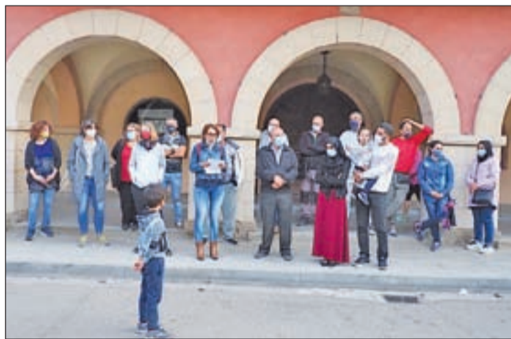
Moment de l'acte que es va fer davant del consistori

Segons van explicar fonts dels Mossos d'Esquadra, els fets van tenir lloc cap a les 17.00 hores, quan la víctima va sortir de casa per anar a buscar la seva filla a l'escola. En aquell moment es va trobar amb dues dones i una d'aquestes li va recriminar que portés la mascareta baixada. Segons van explicar la víctima a través de les xarxes socials, ella li va dir que acabava de sortir al carrer i se la va posar correctament. Aquest fet va acabar amb una discussió amb insults i la presumpta