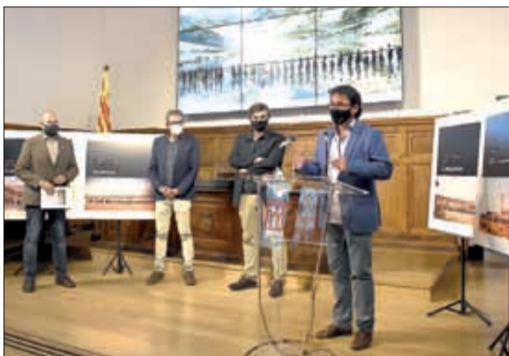
Presentación del Festival de Música, ayer en el IEI

Los conciertos formato medio se harán en Almatret, Organyà, Bellaguarda, Pinós, Alfarràs y dos en Lleida, mientras que los más