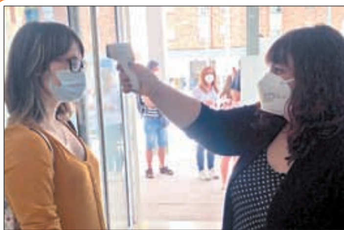
Mesures de prevenció a l'entrada al local

A hores d'ara només resta tancada la Llar d'Infants de Vilagrassa, ja que l'Escola Bressol d'Almenar va reobrir ahir i la Llar d'infants de Barbens ho farà dilluns. La reobertura de l'Escola Bressol d'Almenar coincideix amb una millora als centres escolars del municipi, on resten dos grups confinats a l'escola (35 persones) i tres a l'Institut (59 persones). Segons les dades d'Educació, l'Institut Màrius Torres de Lleida té ara el pitjor registre, amb quatre grups confinats (110 persones) i tres positius.