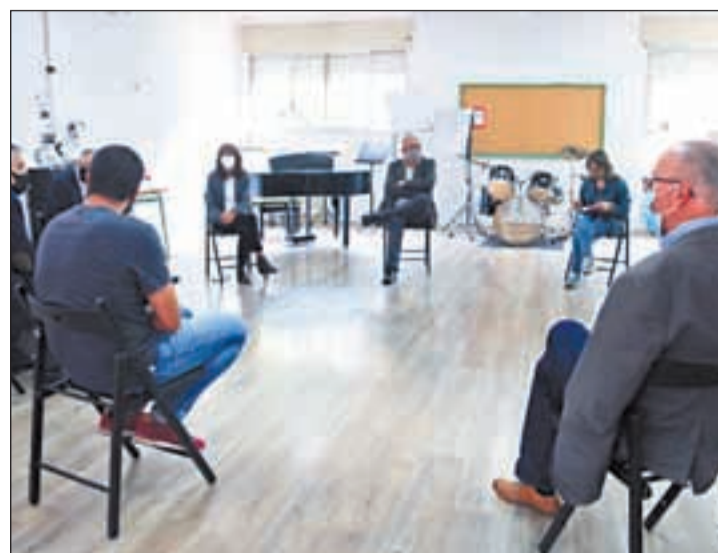
El conseller Bargalló, ahir a Granollers

Des del passat mes de març, la major part de l'activitat de l'entitat s'havia fet de forma telemàtica, per garantir en tot moment que la societat seguís sent inclusiva i amb oportunitats per a totes les persones. L'entitat també ha donat la benvinguda durant aquests mesos a 3 nadons amb síndrome de Down i les seves famílies.