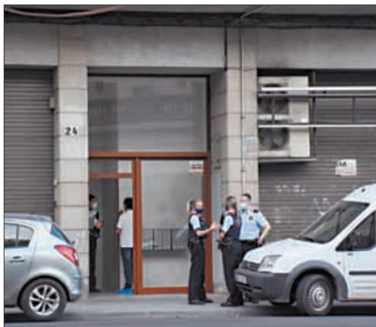
Els Mossos d'Esquadra, el dia que es va cometre el crim

Els Mossos d'Esquadra mantenen oberta la investigació relacionada amb el crim de l'Avinguda de les Garrigues, del passat dissabte 19 de setembre, per tal de poder identificar i localitzar la dona que suposadament es trobava en el moment dels fets amb el presumpte autor. De fet, cal recordar que la policia catalana va rebre una trucada des de França de la germana de l'home, de 57 anys i francès, ja detingut a Bordeus, que els indicava que el seu germà havia matat una persona. Segons les investigacions, la germana del presumpte assassí estava fent una videoconferència amb ell quan aquest li va explicar que havia matat algú i la germana va veure el cadàver a terra. A més, a les imatges també s'hi veia que al pis, a banda del presumpte assassí, hi havia també una dona, que és la que els Mossos d'Esquadra intenten identificar i trobar.