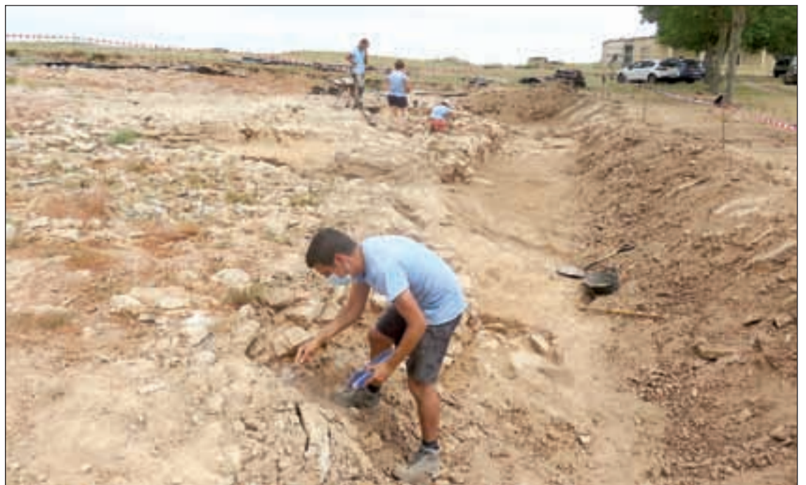
Imatge de les noves descobertes al jaciment ibèric del Molí de l'Espígol

Aquest escenari, segons asseguren des de la Coordinadora, demostra la necessitat de dotar de més mitjans l'àmbit comunitari de la salut mental, no només el sanitari, ja que el primer ha actuat com a dic de contenció de l'atenció sanitària durant aquest període. En el marc d'aquestes reivindicacions, la Coordinadora ha endegat una campanya en motiu del Dia Mundial de la Salut Mental, que es commemora el 10 d'octubre i enguany se celebra el 8. Els protagonistes de la iniciativa són una desena de persones afectades i les seves famílies que expliquen la seva experiència durant el confinament i mostren les accions que porta a terme la Coordinadora així com un primer vídeo sobre l'estigma a partir de testimonis reals.