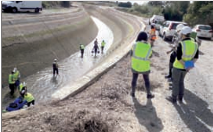
Imatge dels treballs que s'estan fent a Balaguer

Endesa, mitjançant la seva divisió d'energies renovables Enel Green Power, va començar aquest dilluns el buidatge periòdic dels canals de Balaguer i Tèrmens, a la Noguera, i de Lleida, al Segrià, amb l'objectiu de realitzar-hi diversos treballs de manteniment i millora. El buidatge progressiu d'aquests tres canals industrials es farà també la setmana del 12 d'octubre al canal de Seròs (Segrià), que es troba aigües avall de la presa de