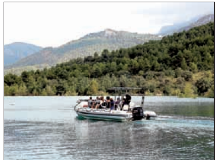
Imatge d'arxiu d'una embarcació al pantà de Canelles

Segons explica l'alcaldeessa d'Àger, es tracta d'unes accions que s'han pres "a l'espera de tenir el Pla Director d'Ordenació Territorial de l'embassament",