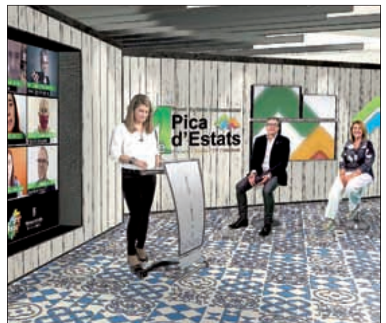
L'entrega es va fer de forma virtual per la pandèmia