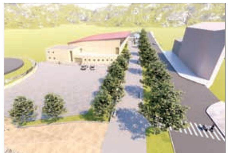
Imatge virtual de com quedarà aquesta zona

Les obres tindran com a principals actuacions la creació d'un espai verd de 4m que separarà físicament la vorera de la carretera N-260, cosa que en millorarà la seguretat per als vianants i, alhora, generarà espais d'ombra al nou trajecte. També es preveu pavimentar l'espai exterior del pavelló, crear unes grades exteriors i millorar-ne els problemes de drenatge per convertir-lo així en espai exterior per a la realització d'actes municipals. Amb aquestes actuacions, que es licitaran properament, es millora sobretot la comoditat dels vianants i usuaris de l'equipament.