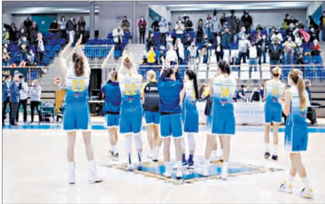
El Cadí volverá a jugar ante su afición