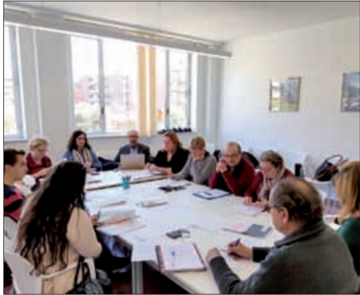
Una reunió de la Coordinadora abans de la pandèmia

Les associacions que formen part de la Coordinadora d'Entitats Salut Mental Catalunya – Terres de Lleida han registrat un increment d'atencions del 65% respecte l'any passat i han atès gairebé un miler de persones durant el confinament. La dada demostra, segons la coordinadora, la necessitat de dotar de més mitjans a les associacions que fan atenció comunitària, que durant la pandèmia de la covid-19 han fet de "parallamps" per contenir el sistema sanitari.