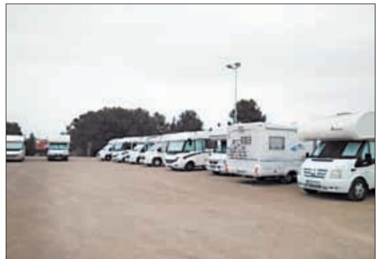
Va quedar malmès arran de les llevantades

Per aquest motiu l'ajuntament va convidar una desena d'empreses locals especialitzades a presentar proposta econòmica per a fer les actuacions d'enderrocar totalment el paviment existent, tant en la part d'accés dels vehicles com en la vorera lateral. Una vegada examinades les propostes els tècnics han determinat que s'havia d'adjudicar a un contractista local, per un import de 18.153,69 euros.