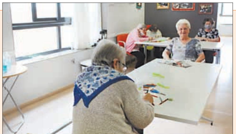
Es vol premiar així la implicació i el compromís demostrat durant la pandèmia

El personal del servei d'atenció domiciliària de les Garrigues rebrà un ajut econòmic extra pels serveis prestats pel coronavirus. Vista la implicació i el compromís demostrat per tots els professionals d'atenció directa que van treballar durant les setmanes de confinament atenent a persones vulnerables tant a les residències de gent gran com en domicilis particulars, SUMAR, l'empresa que gestiona el Centre de Serveis Integrals per a Gent Gran (CSIGG) de les Garrigues té previst compensar els treballadors que van posar en risc la seva salut i la de les seves famílies amb un ajut econòmic de 900 euros, la mateixa