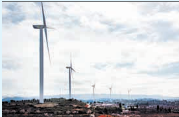
Imatge d'arxiu d'aerogeneradors a la Granadella

En aquest sentit, la Segarra és una altra zona que copa part d'aquests elements. La Gene-