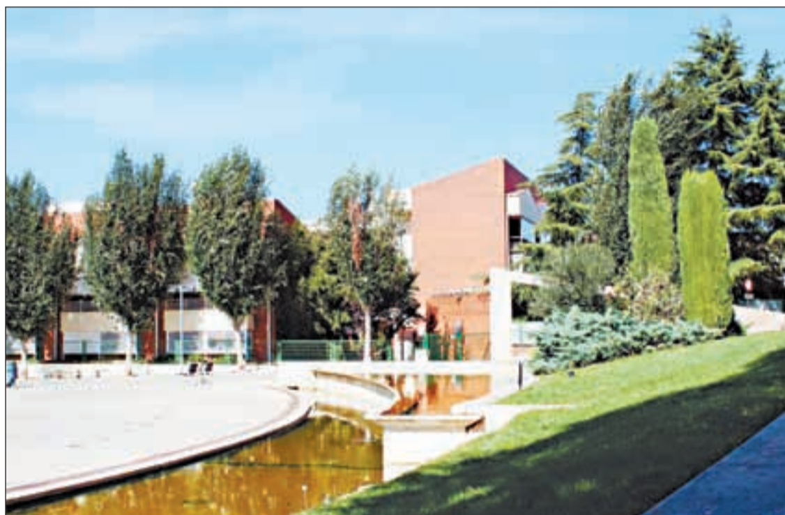
La residència L'Onada compta amb un total de 59 residents, 34 dels quals han donat positiu

El cas de Covid-19 detectat a la residència L'Onada de la capital de les Garrigues ha elevat el risc de rebrot de les Borges Blanques fins als 643,27 punts. Això també ha provocat que el risc de les Garrigues també hagi pujat fins als 392,18 punts. El centre va informar que l'equip està "preparat amb tots els coneixements i equips amb tots els EPI necessaris per fer front a la situació". A més enviarà un comunicat diari als familiars i publicaran les dades actualitzades a la fitxa del centre a OnaCivitas (enllaç Coronavirus) per fer seguiment de l'evolució de la pandèmia a la residència.