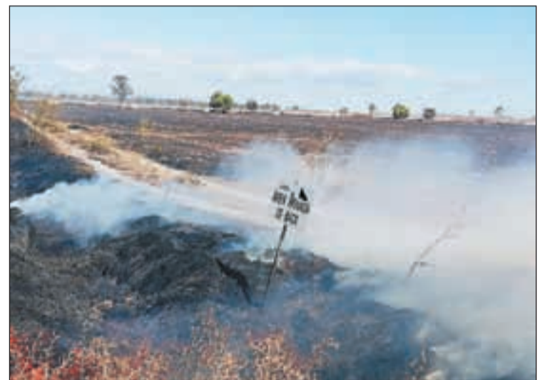
A Belianes van cremar prop de 13 hectàrees de matolls

Els Bombers de la Generalitat van treballar ahir en deu incendis a la demarcació, la majoria de vegetació. N'hi va haver a Belianes, Seròs, Castellnou d'Oluges, Torregrossa i Puigverd de Lleida. A Lleida ciutat, van cremar matolls prop del carrer Palauet i als Alamús i contenidors a Pere de Cavassèquia i a Enginyer Cellers.