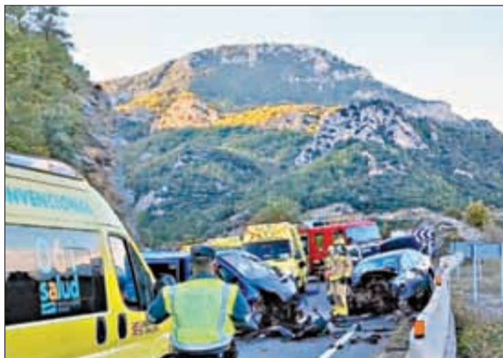
L'accident, entre un turisme i una furgoneta, ahir

L'accident, entre un turisme i una furgoneta, fou a les 17.30 hores, al quilòmetre 116 de l'N-230, i es van desplaçar al lloc dels fets 3 ambulàncies i un helicòpter del SEM, 3 dotacions dels Mossos d'Esquadra, 1 dotació de Bombers de la Generalitat. Tres de les persones ferides greus van ser traslladades a l'Hospital Arnau de Vilanova, una de menys gravetat a l'Hospital de Vielha i la cinque-