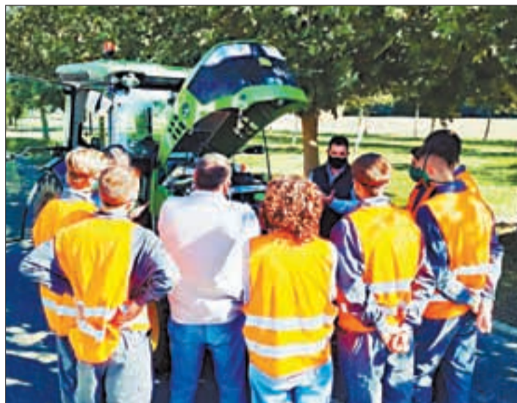
Una explicació tècnica de representants de John Deere (esq.) i una sessió teòrica de paisatgisme i producció agroecològica (dreta)