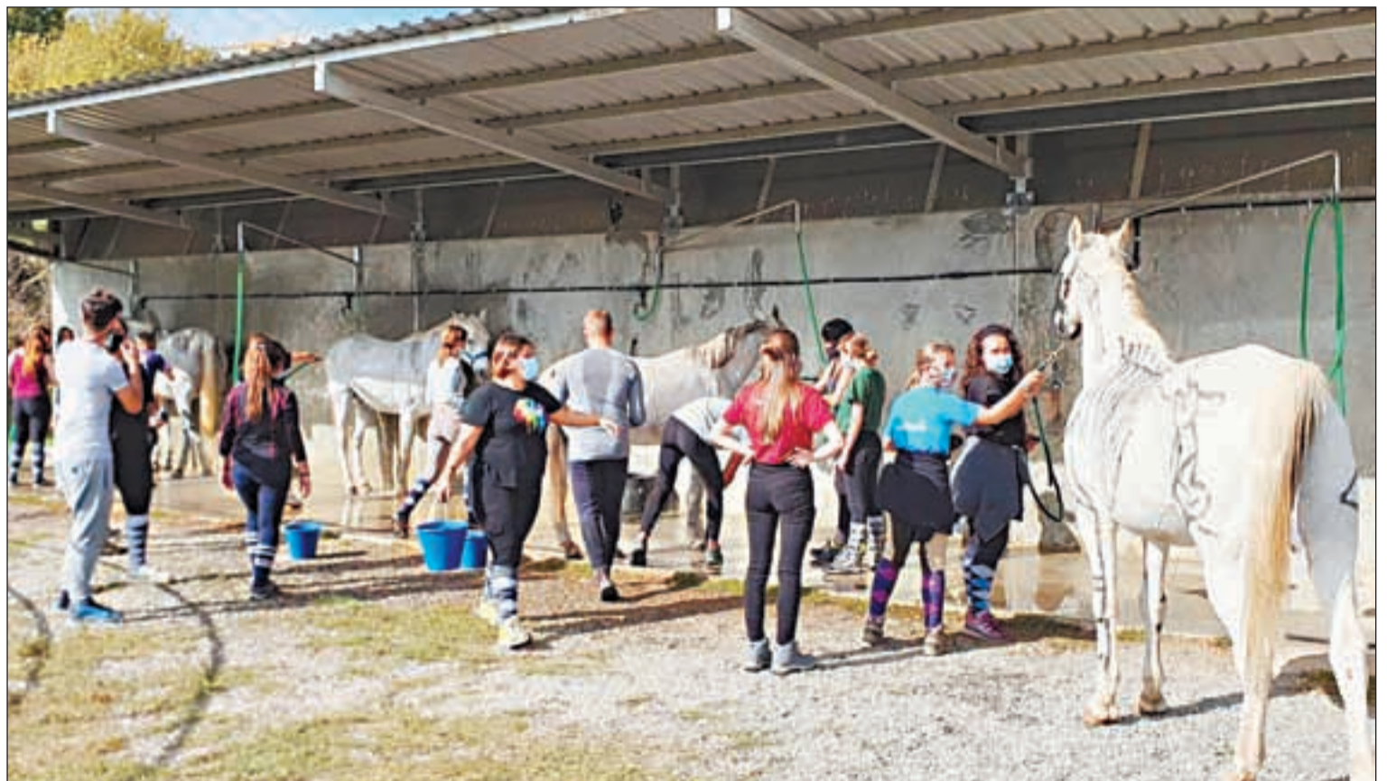
Activitats eqüestres de l'alumnat de primer curs per tal d'assimilar la morfologia externa del cavall, a l'Escola Agrària del Pirineu

Un altre dels centres que ha notat un increment de les matriculacions femenines ha estat l'EA d'Alfarràs, especialitzada en fructicultura. La seva directora,