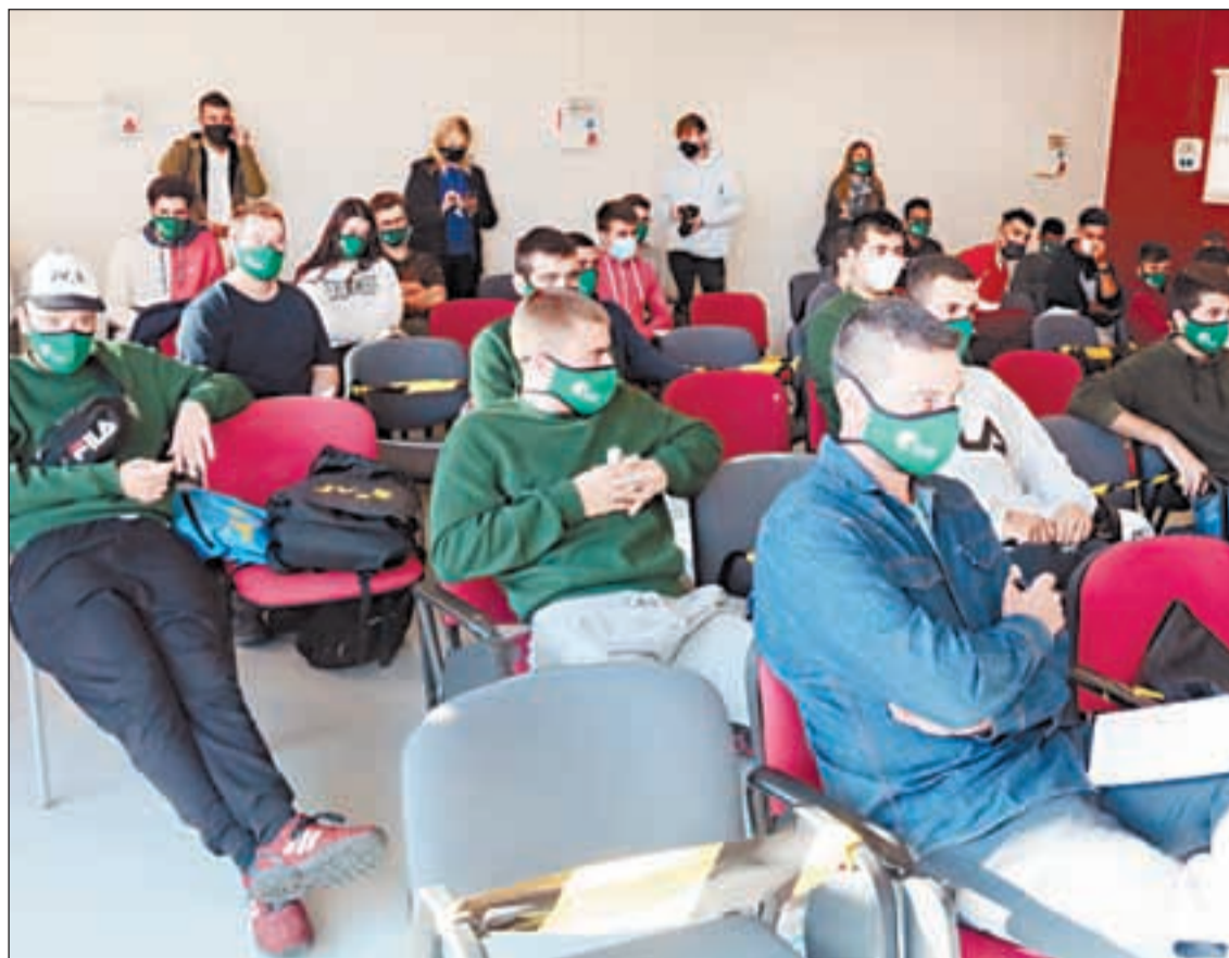
Alguns dels joves participants en la 1a jornada Networking Odisseu Segrià