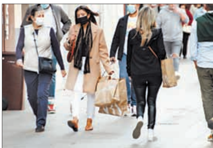
Imatge de la tarda d'ahir a l'Eix Comercial