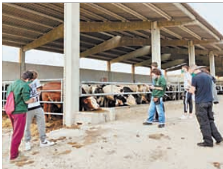
Visita als allotjaments ramaders de vedells d'engreix

El projecte Odisseu busca el retorn i la inserció laboral de joves al medi rural, fomentant l'emprenedoria, millorant l'ocupabilitat, evitant el despoblament rural i millorant les oportunitats laborals del medi rural. Durant la jornada formativa encarada a joves que s'estan formant en l'àmbit agrari, es van donar a conèixer experiències de productors locals. En concret, en van formar part el Cellar La Gravera (Alfarràs), Elixirs de Ponent (Almacelles), Cervesa Artesana Lo Vilot (Almacelles)