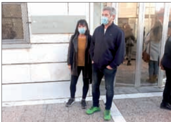
Els pares de la jove que va resultar morta en l'accident