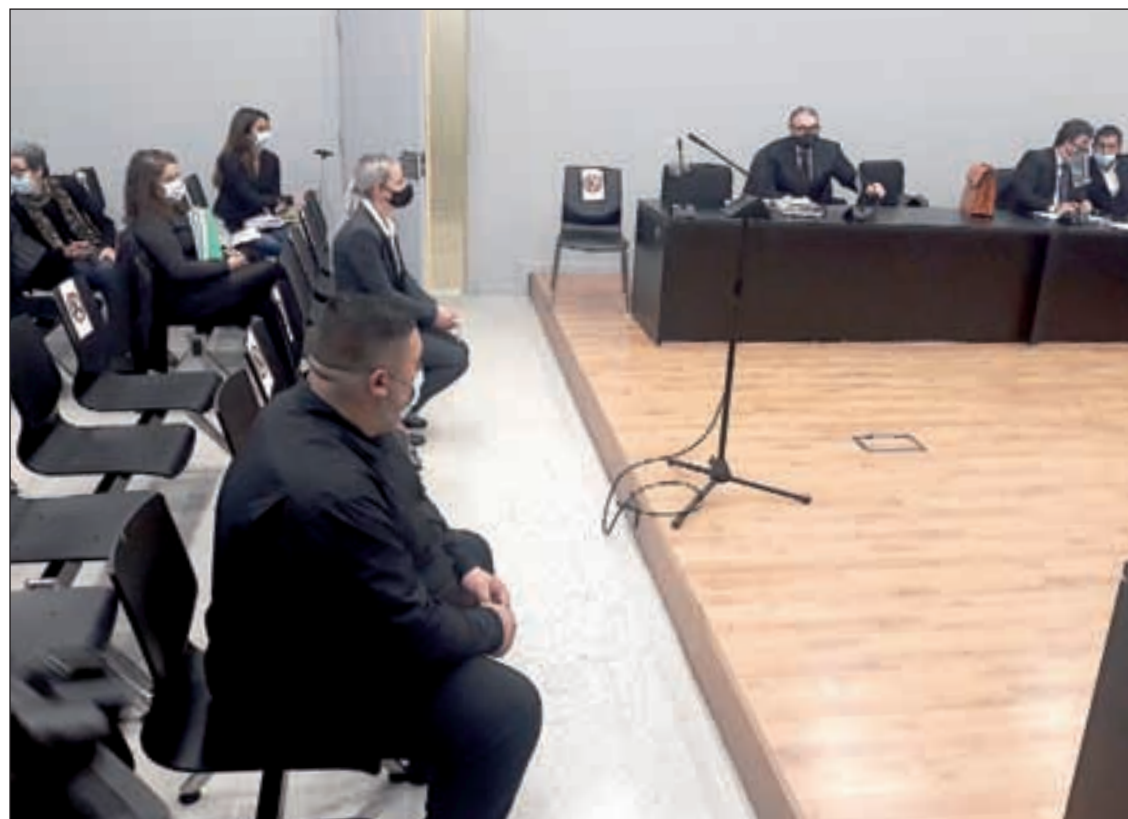
Els dos acusats per la mort d'una jove de 27 anys de les Borges Blanques en l'N-240

Però els Mossos van descartar-ho, ja que quedava “clar” que l'acusat va colpejar per darrera el cotxe de l'altra acusada i va impactar contra el vehicle la víctima. Sobre la velocitat i l'alcoholèmia, van puntualitzar que l'home també va donar positiu, però en cap cas eren nivells penals. I van indicar que la víctima va fer una maniobra instintiva desplaçant-se