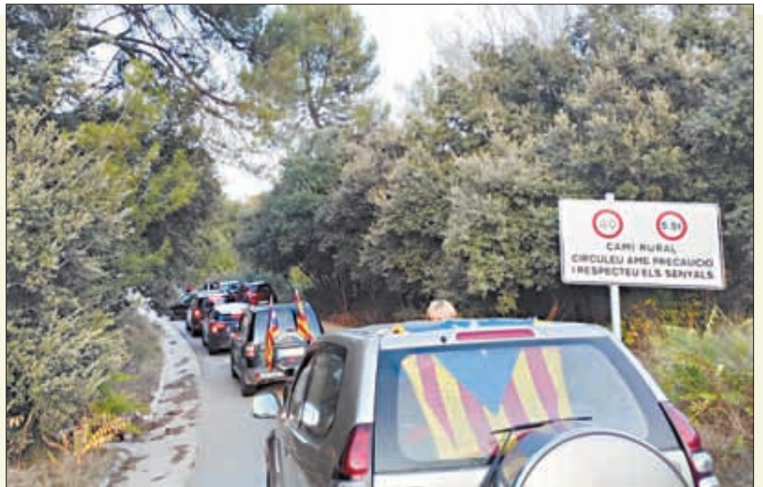
Des de Lleida i Tremp també van participar cotxes i motos fins a Lledoners

te", escriu el líder d'Òmnium. La relatora especial dels defensors dels drets humans de l'Organització de les Nacions Unides (ONU), Mary Lawlor, i la ponent general sobre la situació dels defensors dels drets humans de l'Assemblea Parlamentària del Consell d'Europa, Alexandra Louis, van demanar l'alliberament de Jordi Cuixart, quan es compleixen tres anys del seu empresonament. Lawlor va recordar que el 2019 el Grup de Treball sobre Detencions Arbitràries de l'ONU va considerar que la presó de Cuixart "violava" la Declaració Universal dels Drets Humans i el Pacte Internacional de Drets Civils i Polítics, i la va titllar "d'arbitrària". Per això considera que Cuixart "hauria de ser alliberat". Louis va considerar "preocupants" les condicions de l'empresonament de Cuixart, que ha qualificat de "particularment dràstic". La relatora del Consell d'Europa ha cridat les autoritats espanyoles a "revisar les seves decisions" a l'entorn de l'empresonament de Cuixart, en particular sobre les "restriccions" a les quals està subjecte, i a "considerar posar-lo en llibertat condicional tan aviat com sigui possible".