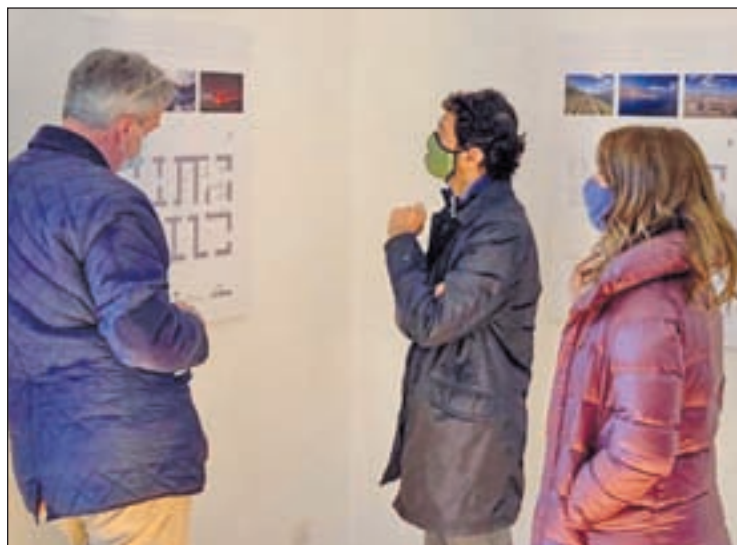
El conseller durant la seva visita a la Torre de Capdella

Construït el 1912, l'edifici compta amb una superfície útil de 449 m2. Es rehabilitaran els 4 nivells i una zona exterior, i s'adaptarà a persones amb mobilitat reduïda. Acollirà una exposició permanent sobre els valors del cel nocturn, del patrimoni natural i cultural, i disposarà de sales polivalents per fer-hi activitats. La zona enjardinada acollirà itineraris de flora, aprofitant els