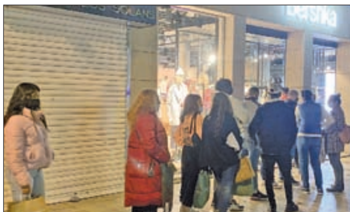
Colas ante los comercios por las nuevas restricciones

✓ Piden aplazar impuestos para quien haya sido forzado a cerrar